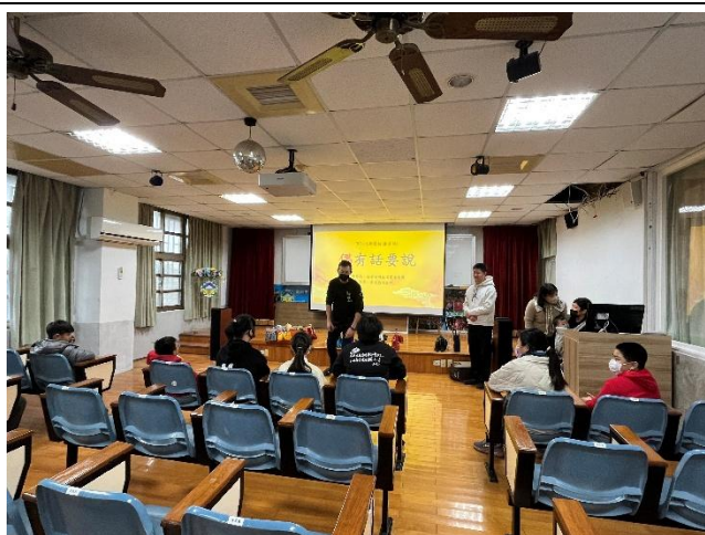
老師介紹布袋戲偶