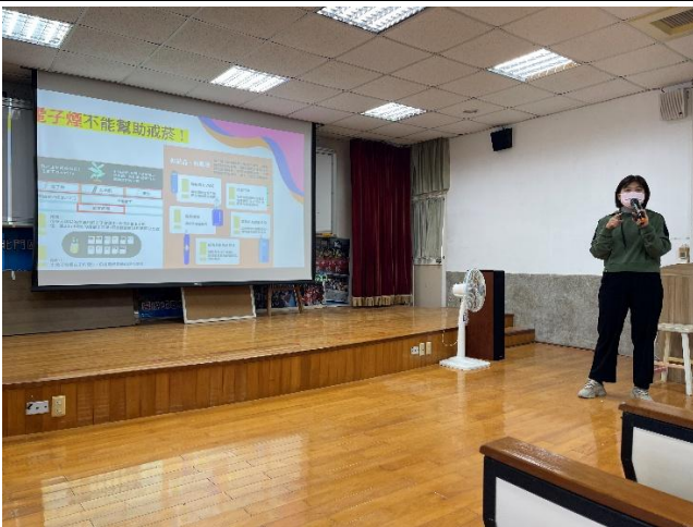
釐清電子菸能幫助戒菸的迷思