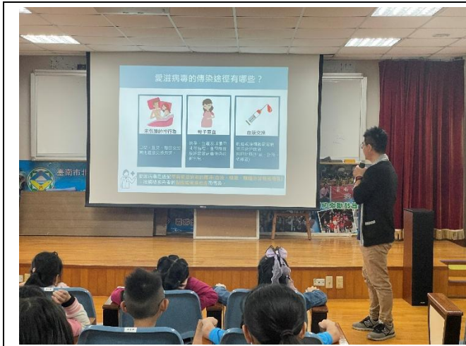
說明愛滋病的傳染途徑