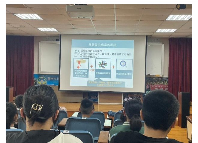
介紹暴露愛滋病的風險