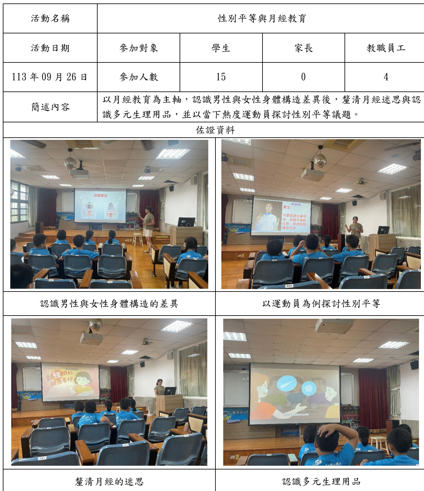
臺南市 113 學年度北門國民小學健康促進相關增能活動成果表