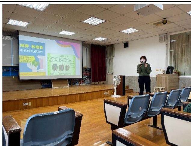
宣導檳榔本身就是致癌物