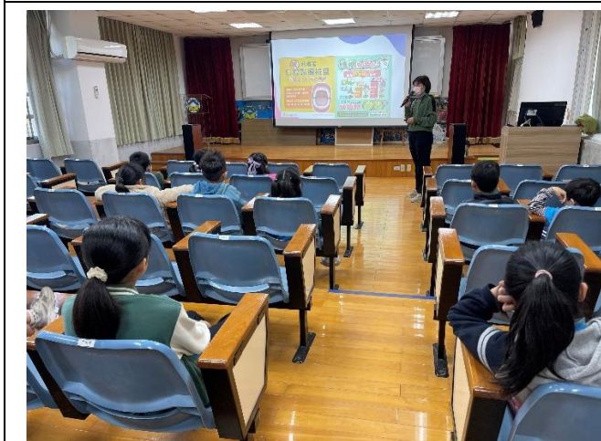
宣導口腔黏膜檢查的重要性