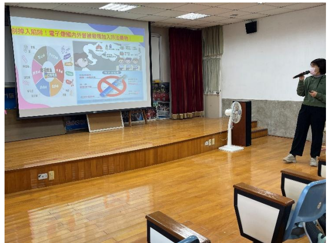
警告電子菸加入非法藥物的風險