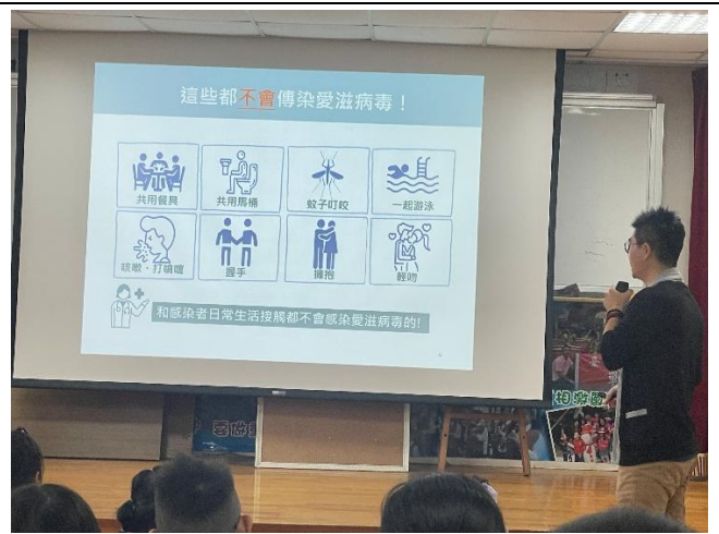
釐清愛滋病的傳染迷思