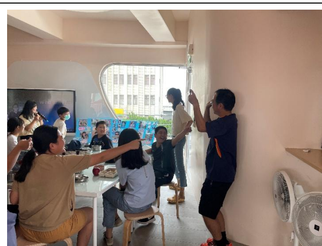
營造校園溫馨氛圍