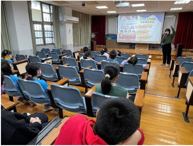
介紹二手菸及三手菸