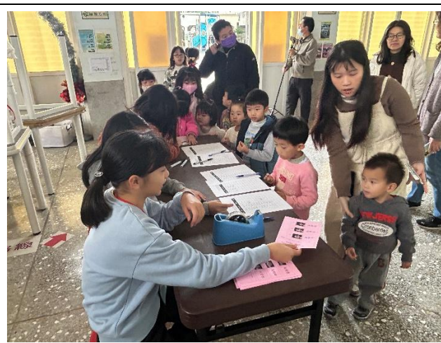
學生擔任工作人員發放選票