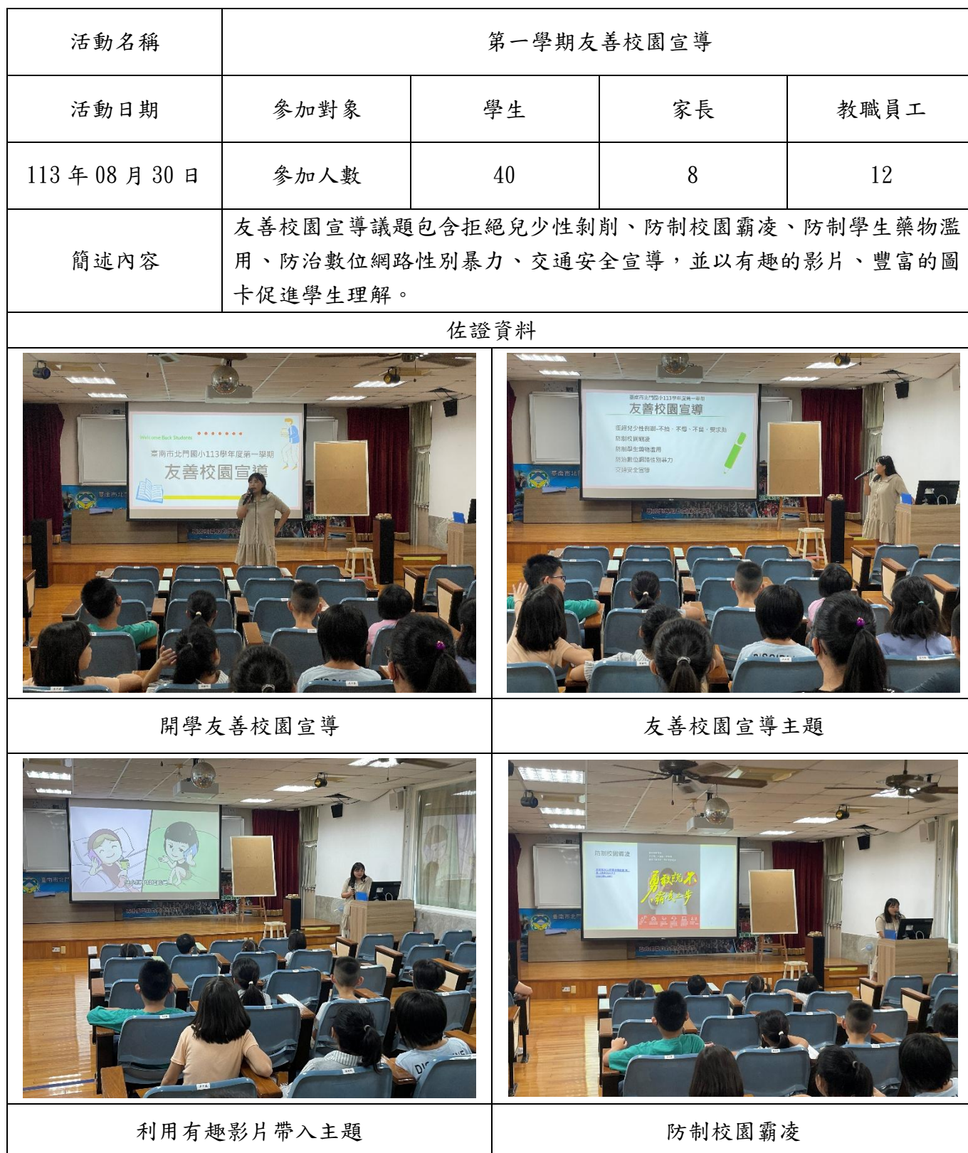
臺南市 113 學年度北門國民小學健康促進相關增能活動成果表