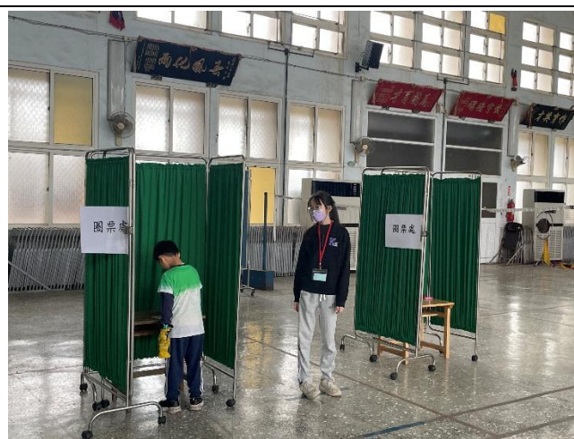
學生於圈票處蓋章投票