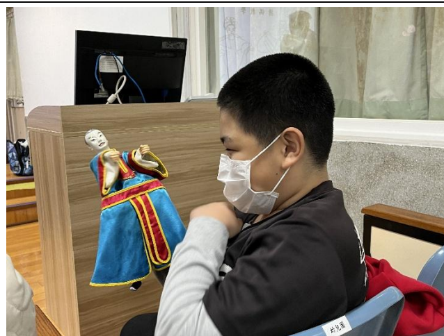
學生與戲偶的自我對話