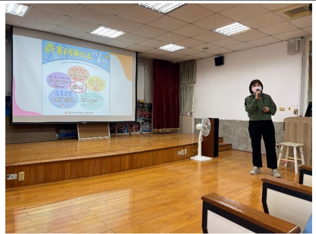
法治教育-菸害防制法