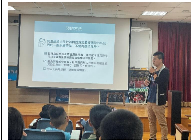
說明愛滋病的預防方法