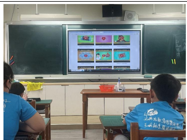
觀賞拒毒相關影片