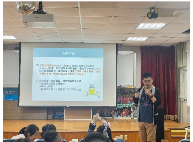
初步介紹愛滋病的治療方法