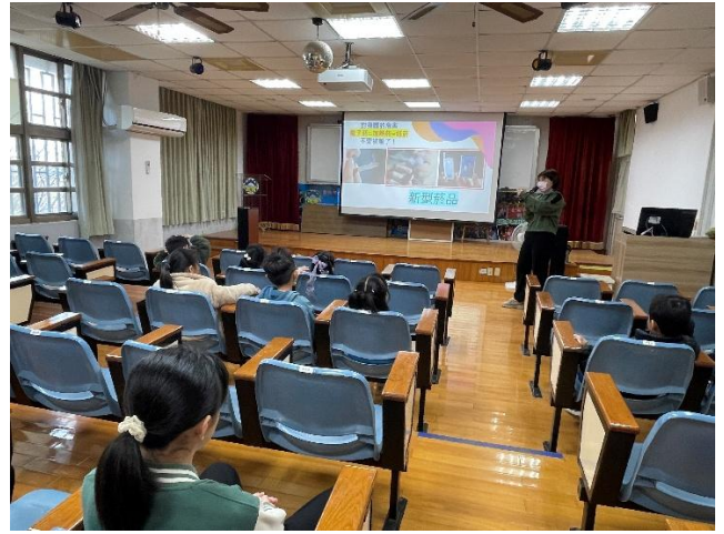
介紹新型菸品的危害