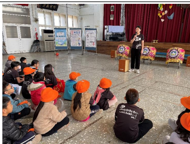
投票前一週政見發表活動