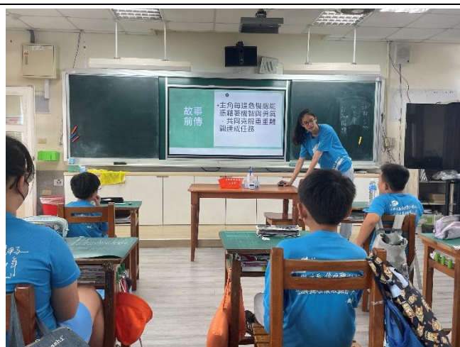
情境故事引導進入主題