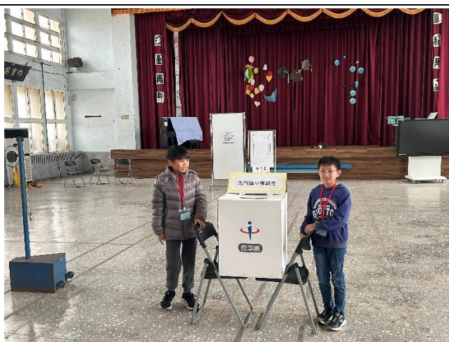
學生擔任選務工作人員