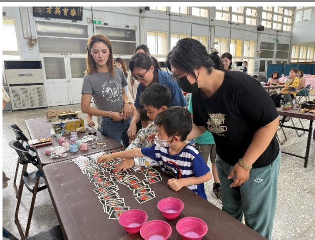
簡單的親子互動遊戲