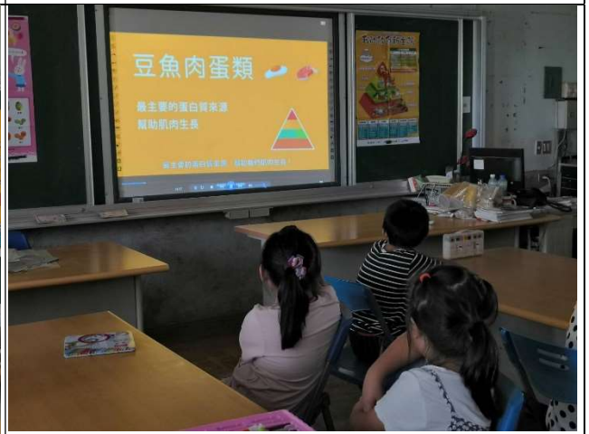
健體教師帶領學生認識飲食金字塔