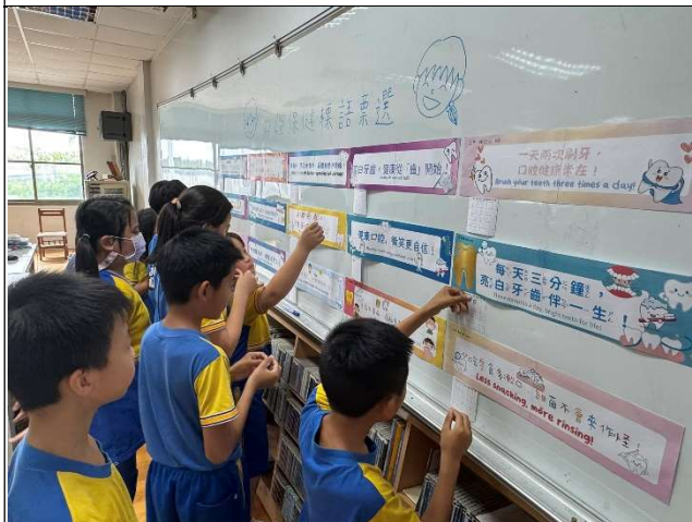
學生參與口腔保健標語票選活動