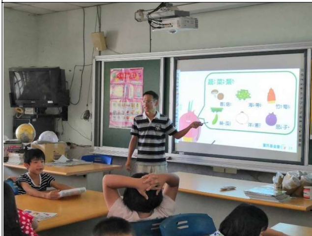
健體教師帶領學生認識飲食金字塔