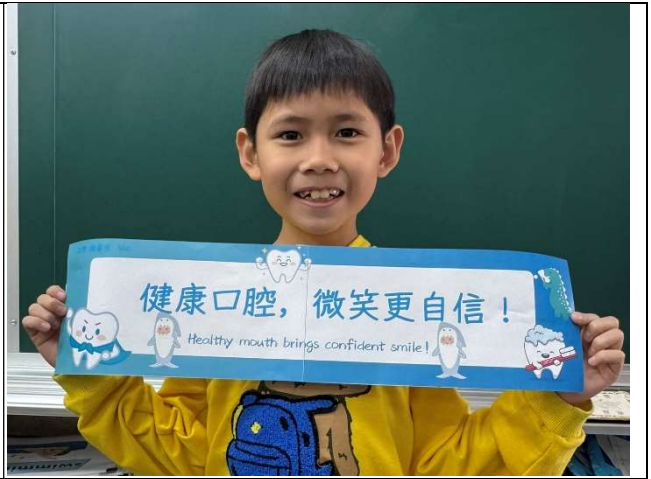
學生入班進行口腔保健標語推廣