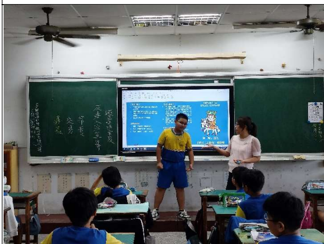
與學生討論藥物濫用對身體健康的傷害