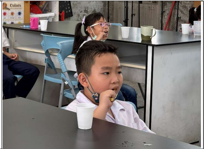
學生於課堂中練習貝氏刷牙法