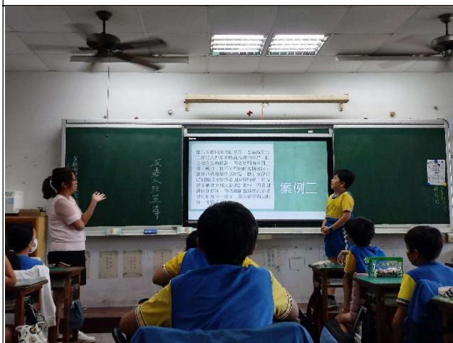
教師帶領學生認識藥物濫用的概念