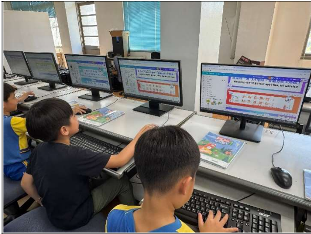
使用數位科技平台進行口腔保健標語設計