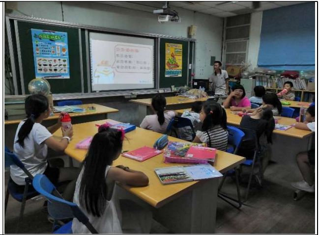
健體教師帶領學生認識飲食金字塔