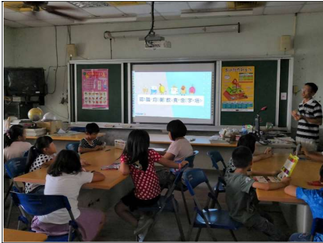
健體教師帶領學生認識飲食金字塔