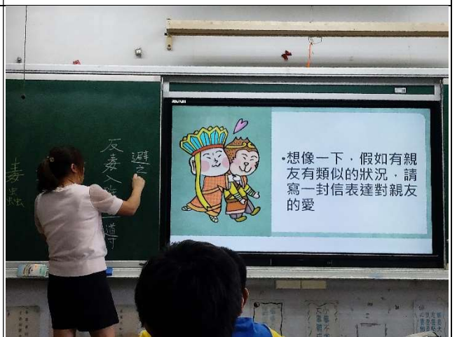
與學生討論藥物濫用對身體健康的傷害