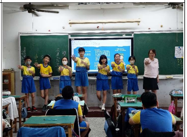
運用情境劇培養學生拒絕毒品的態度