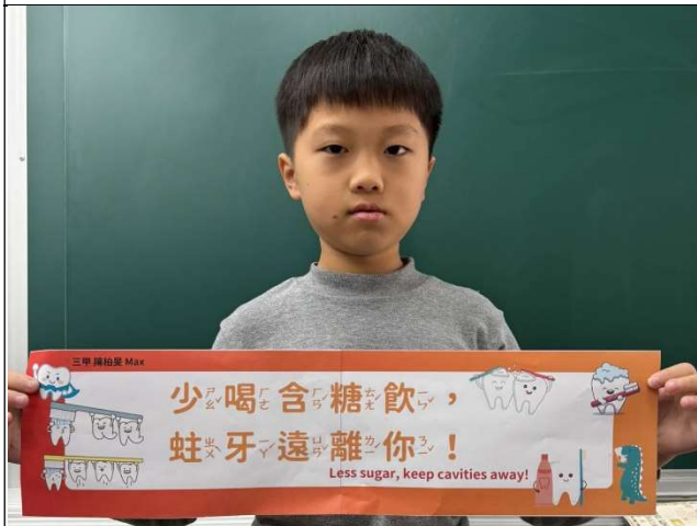
學生入班進行口腔保健標語推廣