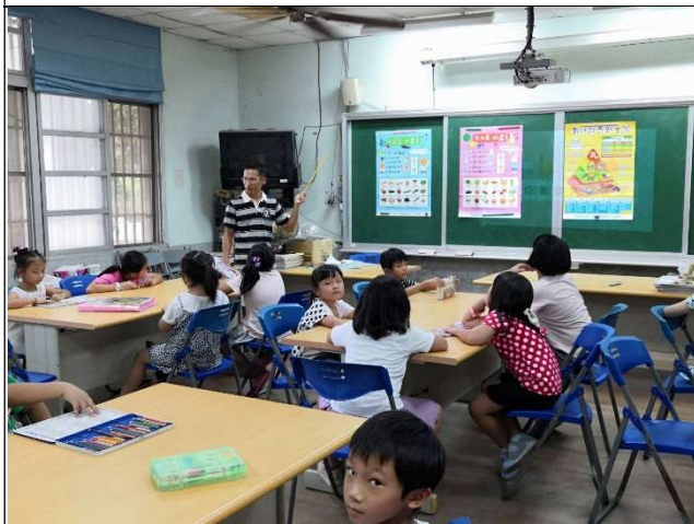
健體教師帶領學生共同討論如何健康飲食