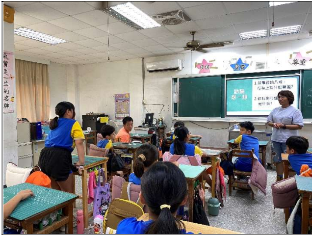
與學生討論藥物濫用對身體健康的傷害