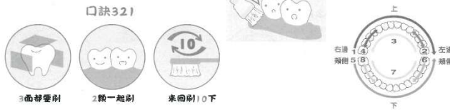
睡前潔牙檢核表，全家一起來刷牙