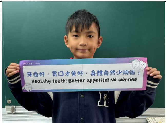
學生入班進行口腔保健標語推廣