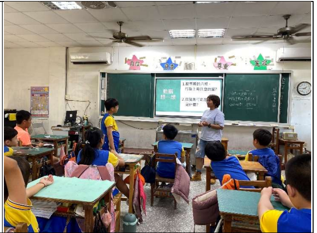
與學生討論藥物濫用對身體健康的傷害