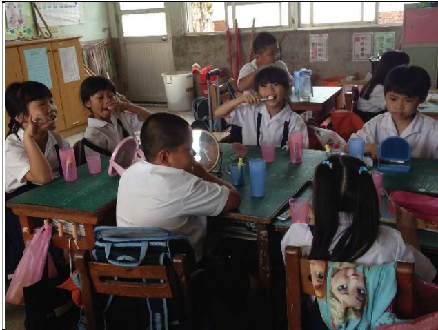
學生於課堂中練習貝氏刷牙法