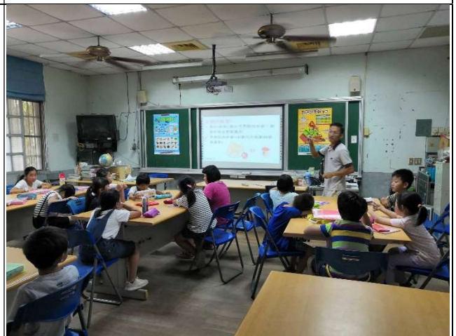
健體教師帶領學生共同討論如何健康飲食