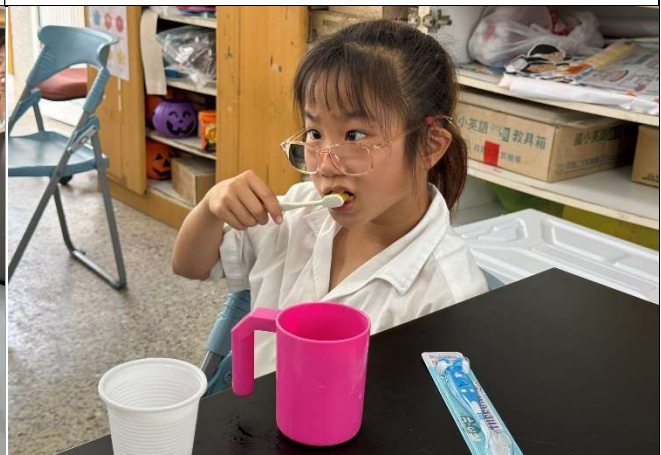
訓練學生擔任潔牙小天使