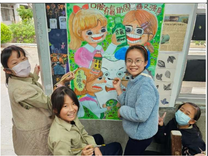
學生參與口腔保健潔牙推廣海報創作