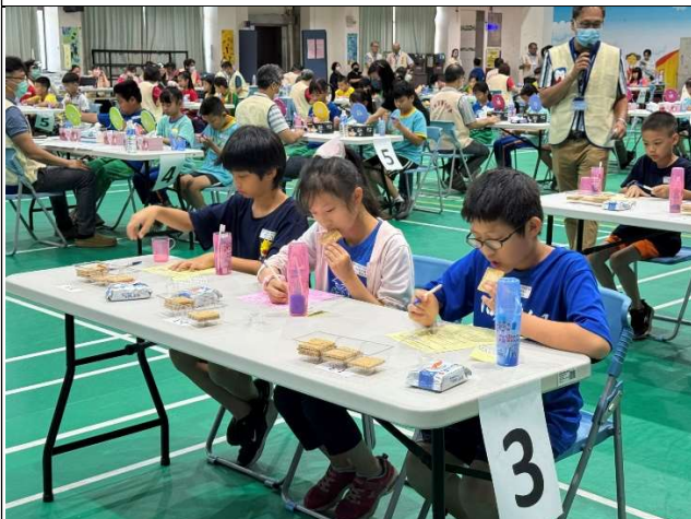
學生進行口腔保健知識答題