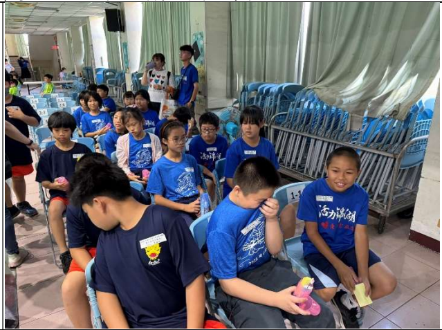
學生參與口腔保健潔牙觀摩比賽