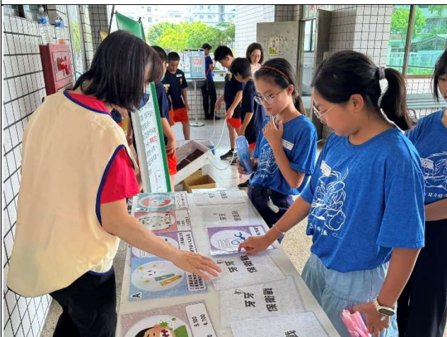
學生參與口腔保健闖關活動