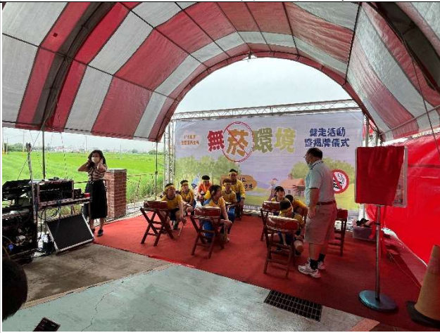
戰鼓隊學生參與無菸健走步道揭牌活動