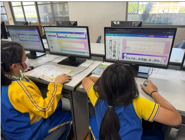
學生於資訊課進行口腔保健標語設計與製作