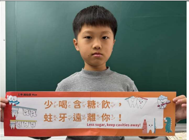
學生入班進行口腔保健標語推廣