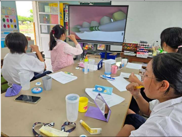
訓練學生擔任潔牙小天使