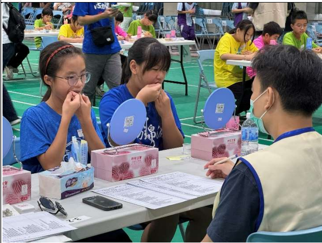
學生使用牙線進行潔牙工作