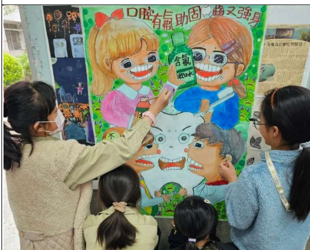
學生參與口腔保健潔牙推廣海報創作