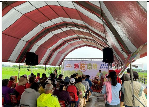
戰鼓隊學生參與無菸健走步道揭牌活動