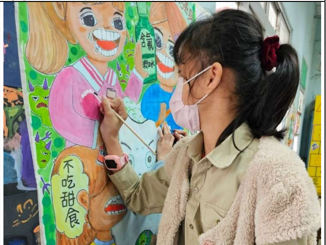
學生參與口腔保健潔牙推廣海報創作