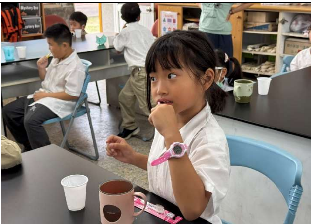
訓練學生擔任潔牙小天使