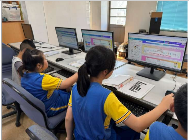
學生於資訊課進行口腔保健標語設計與製作