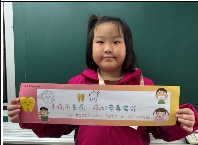
學生入班進行口腔保健標語推廣