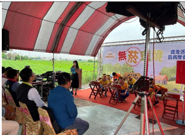
戰鼓隊學生參與無菸健走步道揭牌活動