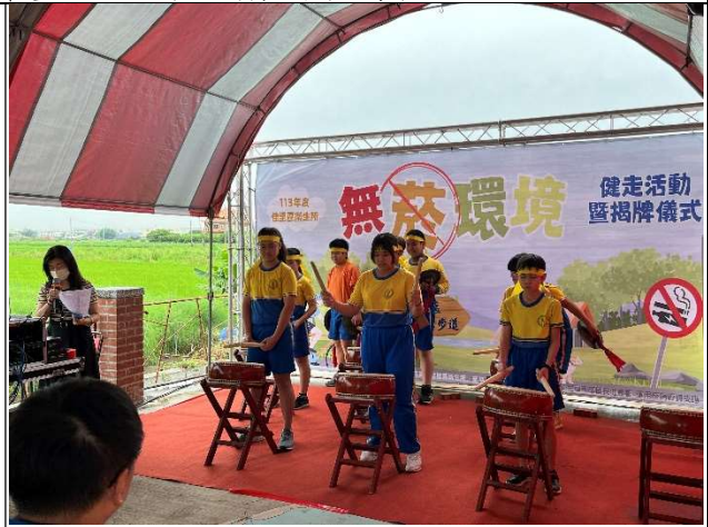
戰鼓隊學生參與無菸健走步道揭牌活動