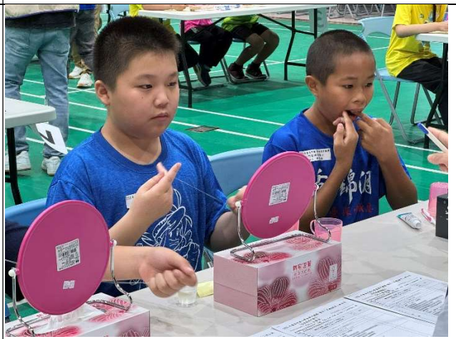
學生使用牙線進行潔牙工作