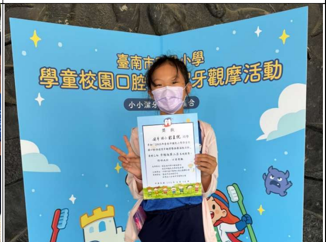
學生獲得個人牙線組第二名