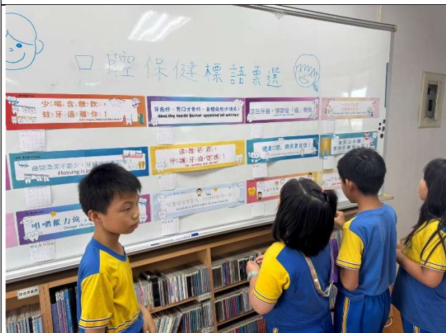
學生進行口腔保健標語票選活動