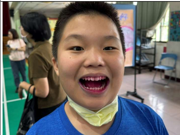
學生使用牙菌斑顯示劑進行口腔檢查