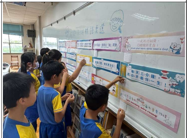
學生進行口腔保健標語票選活動