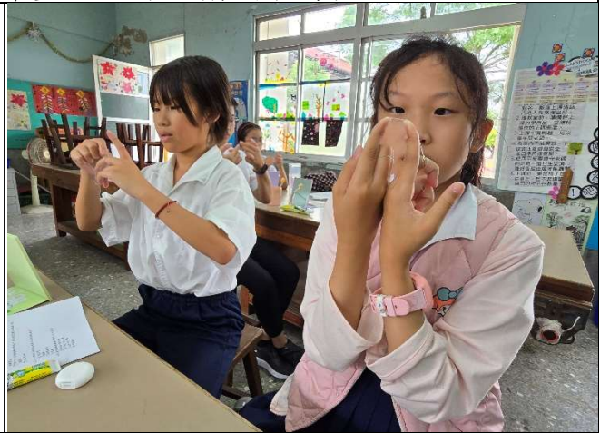
訓練學生擔任潔牙小天使