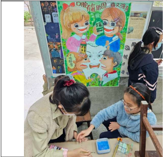
學生參與口腔保健潔牙推廣海報創作