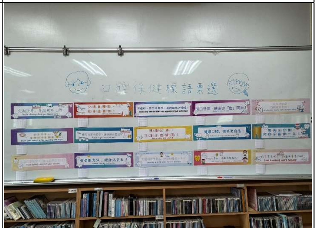
辦理口腔保健標語票選活動