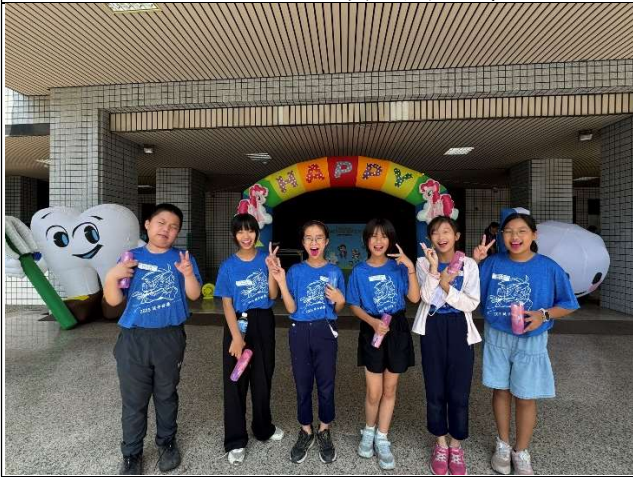
學生參與口腔保健潔牙觀摩比賽