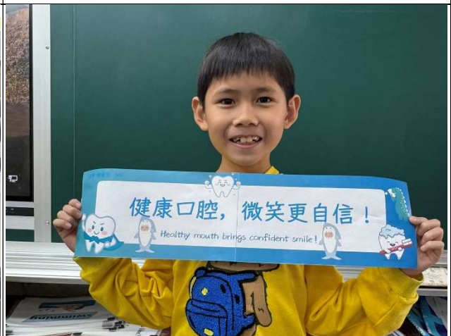
學生入班進行口腔保健標語推廣