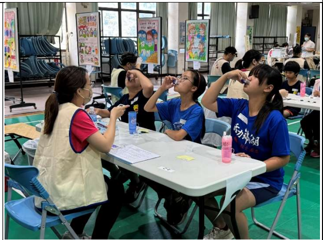
學生使用牙菌斑顯示劑進行口腔檢查