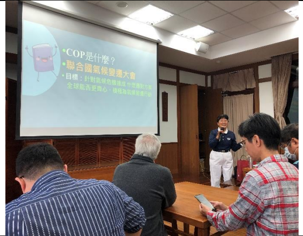
教師參加慈濟 SDGS 議題宣導