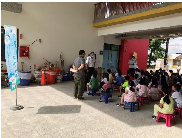
結合佛光山雲水書車推動生態教育