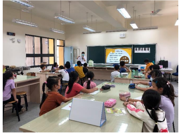
金融研訓課程，理解責任消費與生產