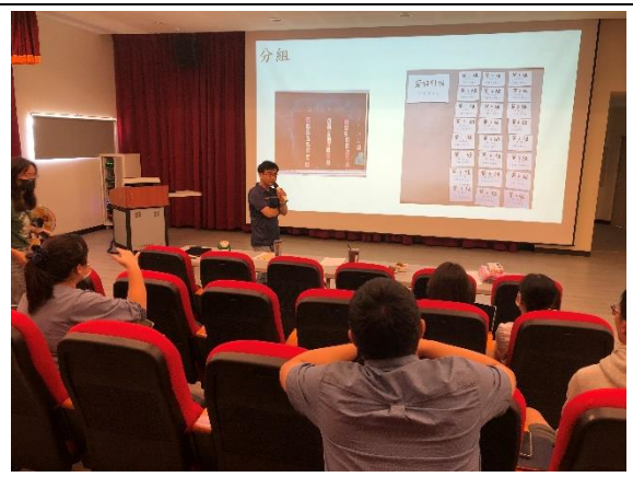
延聘專業教師蒞校指導胡麻課程規劃