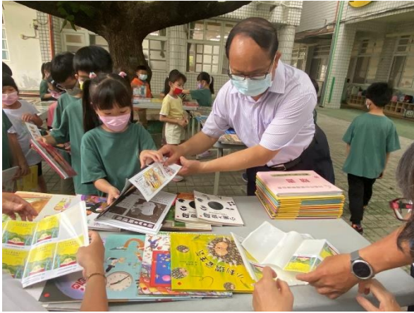
結合台灣深耕閱讀協會進行環境宣導