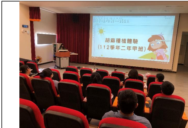
教師間校本課程計畫分享