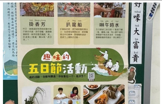
結合母語日以及節慶活動