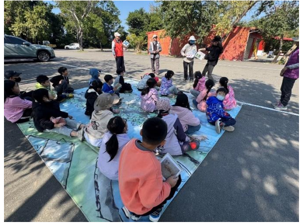
台南安平四草綠色隧道踏查