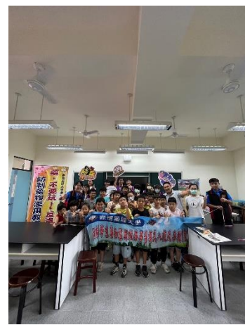
結合嘉南藥事科技大學進行反毒宣導