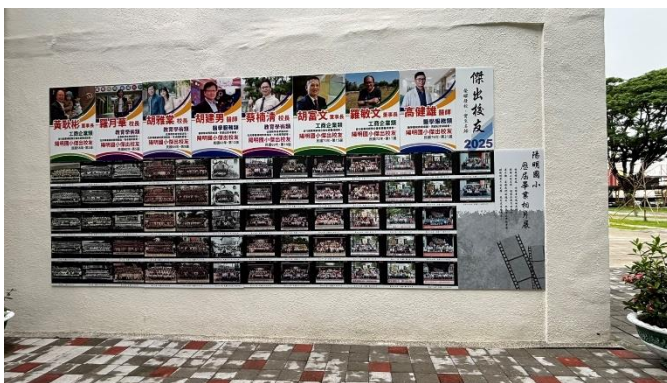
校園支持永續發展情境佈置