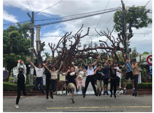
參觀善化糖廠，體驗製糖的辛苦