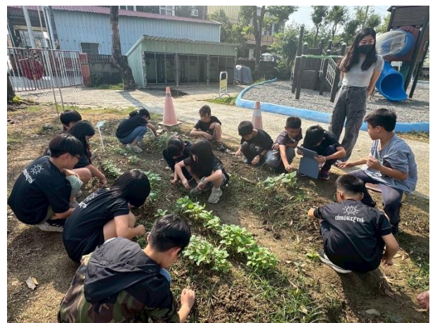
學生親身種植胡麻