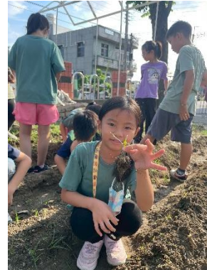
教師研考胡麻課程共備時間與學生親身種植胡麻