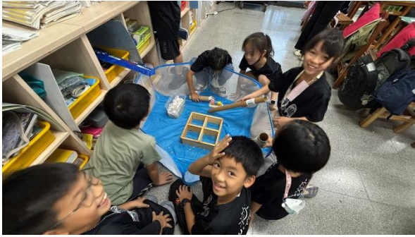
學生觀察倉鼠，理解生命的可貴