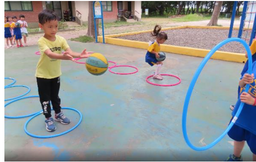
體能活動，促進生體健康