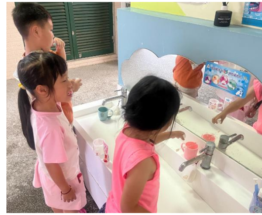
每天固定飯後刷牙，造就健康牙齒