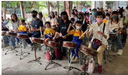
到十鼓文化園區體驗十鼓活動