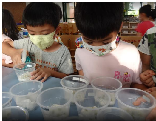
結合食農教育，讓學生體驗當小小農夫