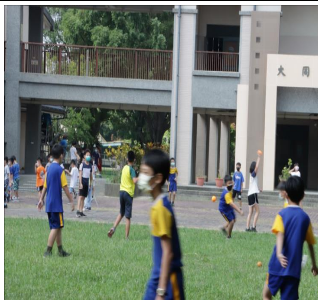
教室淨空運動-樂樂棒球