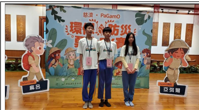
參加 PaGamO 環保防災勇士 PK 賽