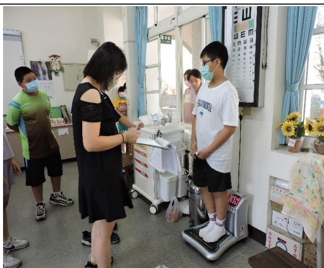
體位過輕與過重學生持續追蹤