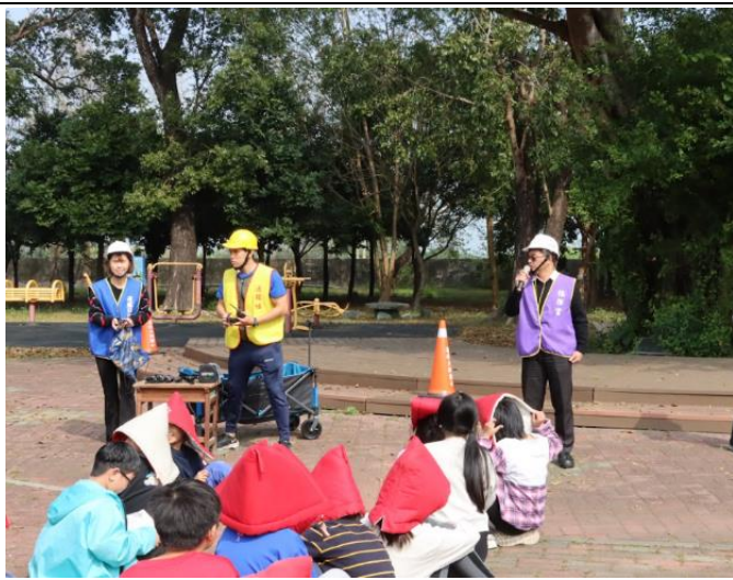
每學期固定進行防災演練