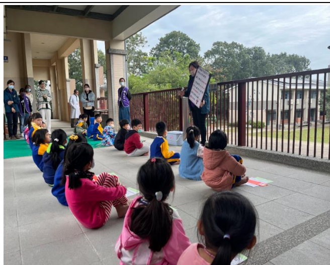
護理師進行健檢衛教宣導