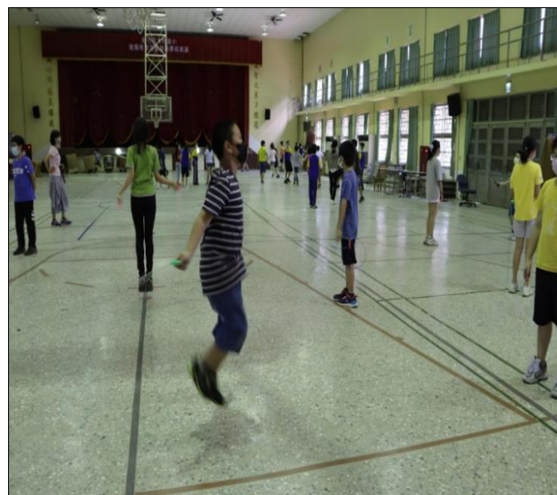
教室淨空運動-跳繩