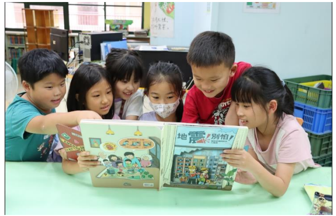
學生觀看【地震! 別怕!】書籍