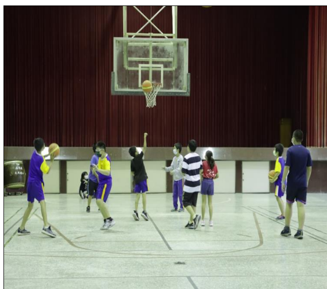
教室淨空運動-籃球