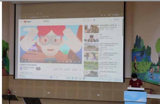
議題宣導-網路成癮結合視力保健宣講