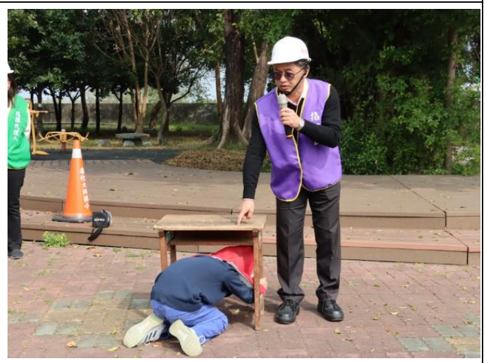
演練後進行【趴、掩、穩】重點提醒