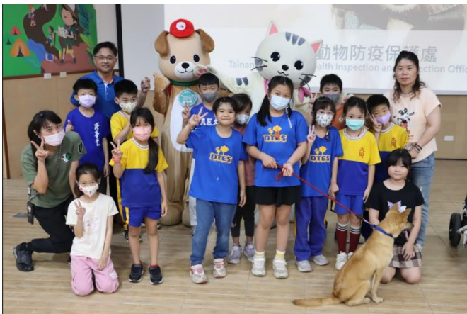
邀請豆哥與凱蒂到校進行 生命教育 宣導