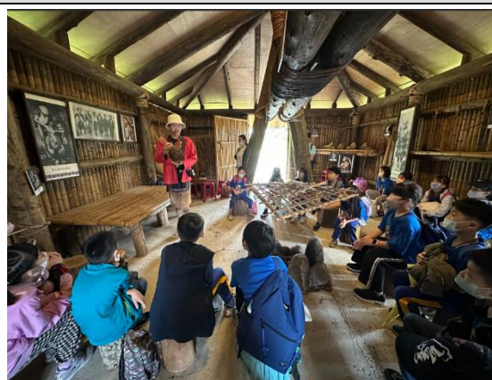
三年級學生參與小獵人體驗教育