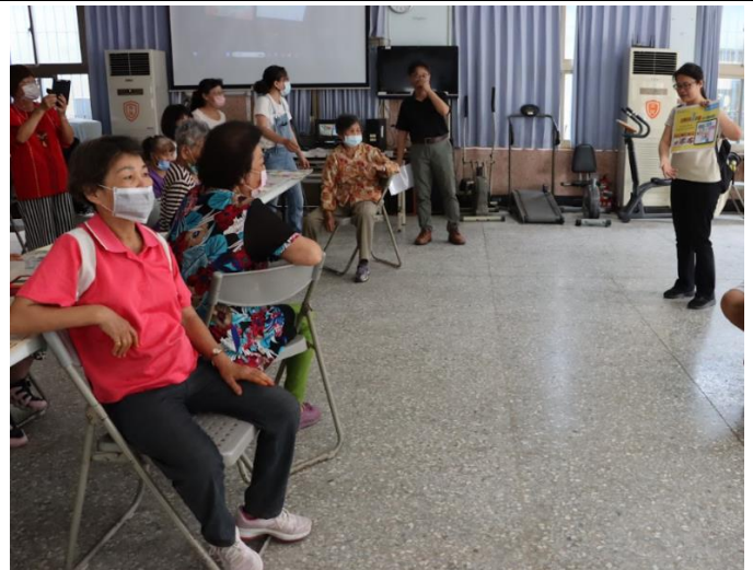
到活動中心為在地老人進行 防災教育 宣導，將防災教育推廣到社區