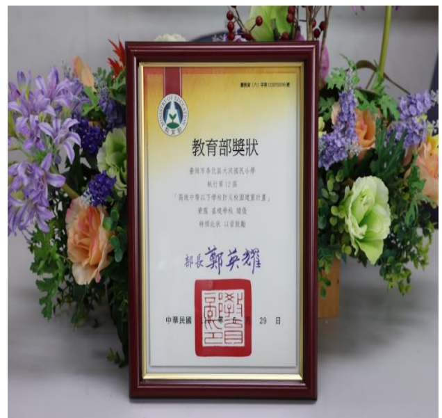
榮獲教育部 113 年防災基礎建置績優學校