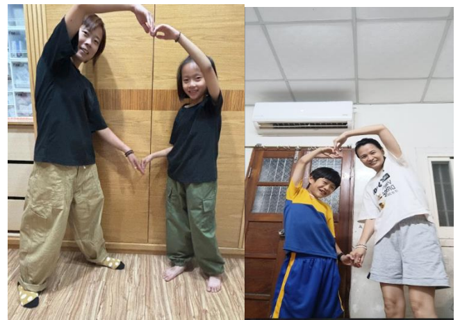
結合 母親節 活動讓學生邀請家長合照，傳遞母親節的重要性