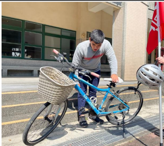
腳踏車考照-腳踏車設備檢查