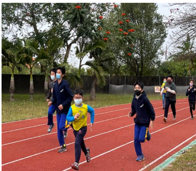
教室淨空運動-跑步