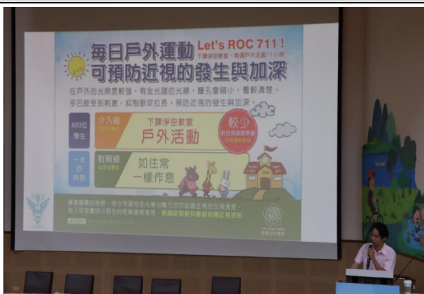
邀請外聘講師到校進行視力保健宣講