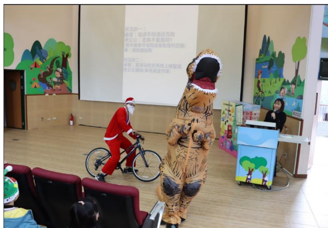
聖誕節結合交通安全教育宣導