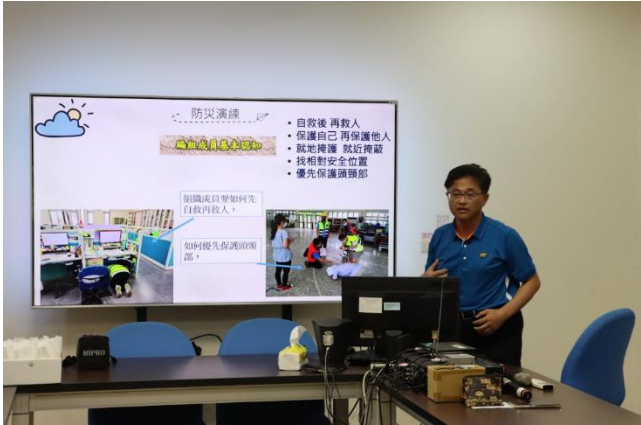
校長進行防災教育觀念宣導