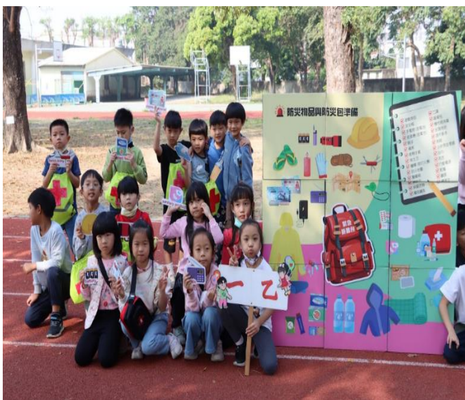
防災教具-防災九宮格