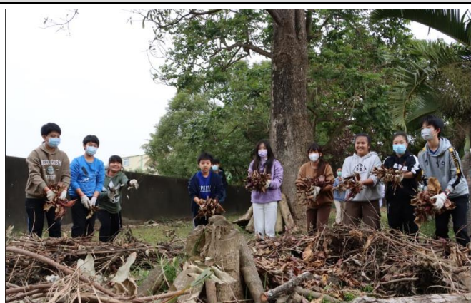
六年級學生製作落葉枝埔堆肥區