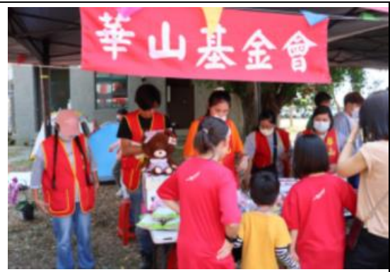
校慶運動會請華山基金會擺設攤位