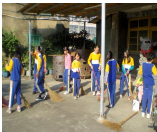
社區打掃，回饋社區