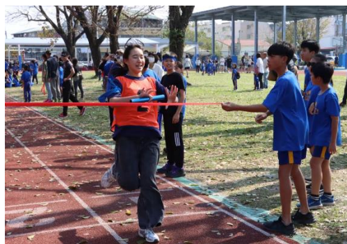
校友回學校參加拔河、大隊接力