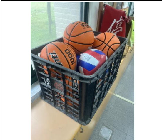
為課照學生購買球類運動器材