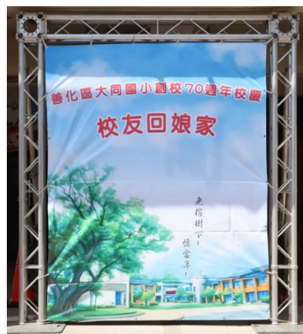
校慶安排校友回娘家