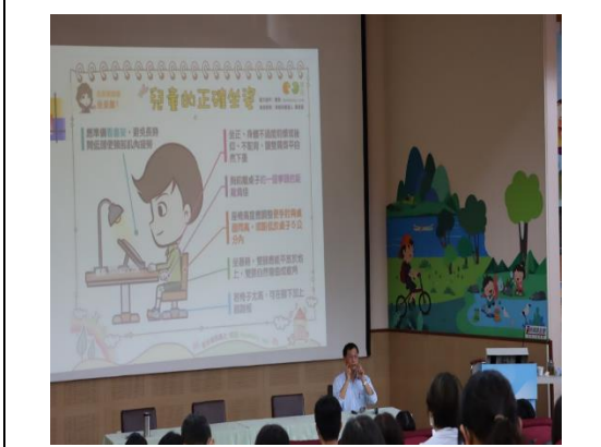
外聘講師到校進行視力保健宣導