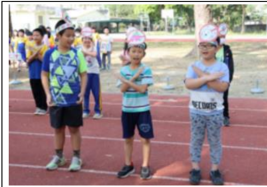
校慶運動會學生化妝進場-健康心理