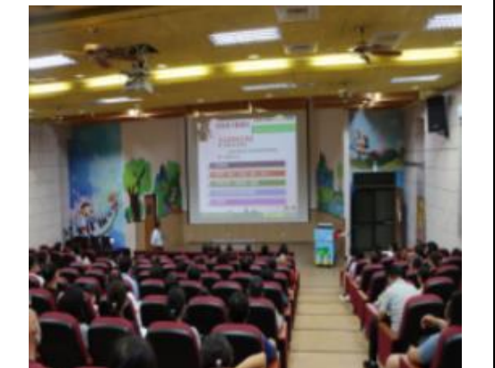
校長於期初班親會進行健康促進宣導