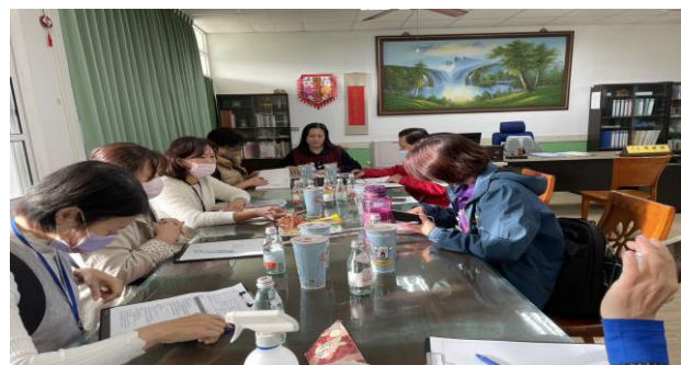
時間：113 年 12 月 25 日 內容：七年級健康檢查召開檢討會議