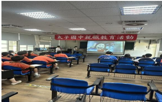
時間：114 年 4 月 17 日 內容：HPV 疫苗接種健康宣講