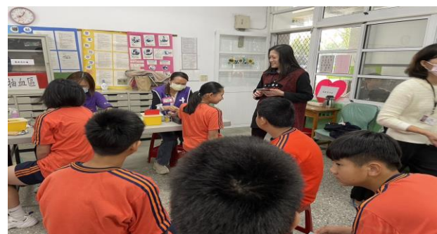
時間：113 年 12 月 25 日 內容：本校陳校長關心學生身心狀況