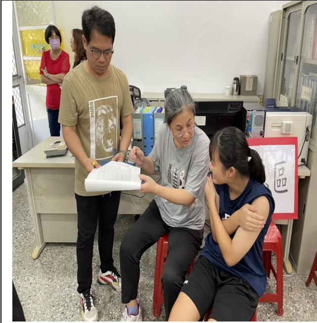
說明：施打疫苗前確認教師個人基本資料