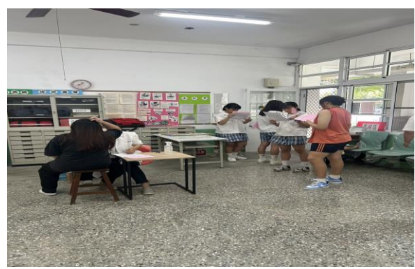
時間：114 年 4 月 17 日 內容：HPV 疫苗接種