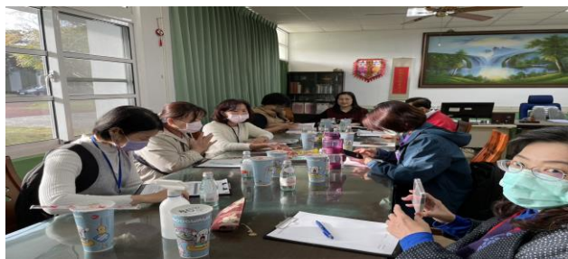
時間：113 年 12 月 25 日 內容：七年級健康檢查召開檢討會議