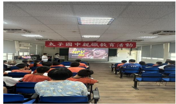
時間：114 年 4 月 17 日 內容：HPV 疫苗接種健康宣講