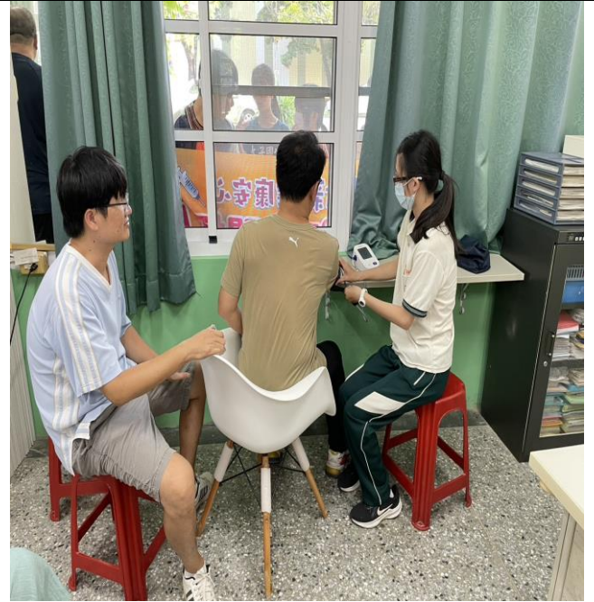
說明：施打疫苗前做好做滿健康諮詢