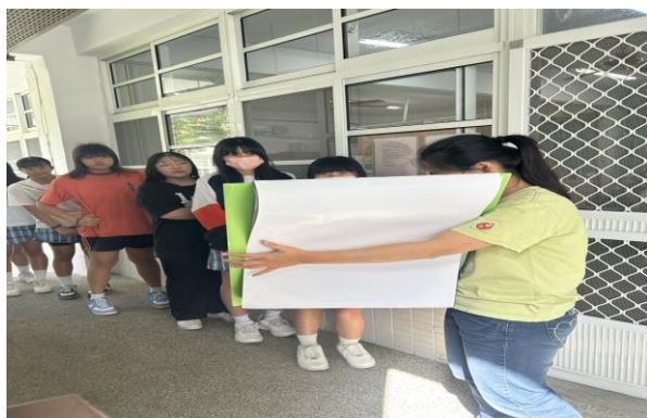
時間：114 年 4 月 17 日 內容：HPV 疫苗接種說明事項