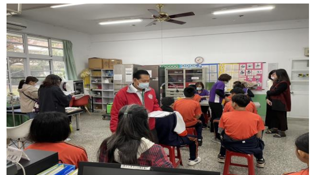
內容：局端訪視委員關心本校抽血過程