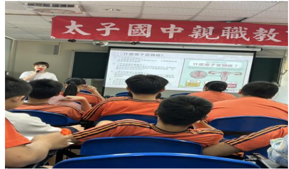
時間：114 年 4 月 17 日 內容：HPV 疫苗接種健康宣講