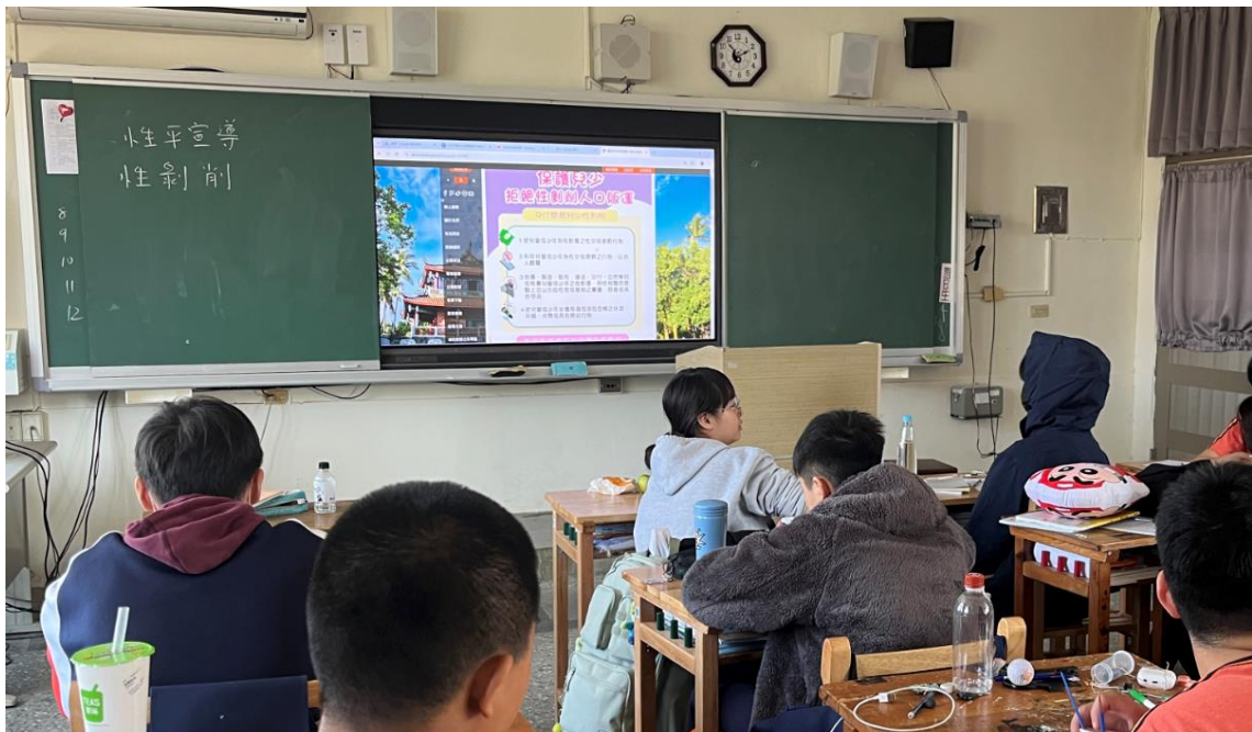
113 學年度下學期結合友善校園週辦理九年級導師入班宣導