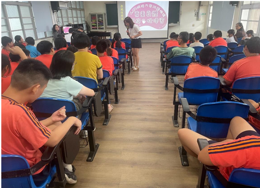
結合友善校園週向全校師生宣導