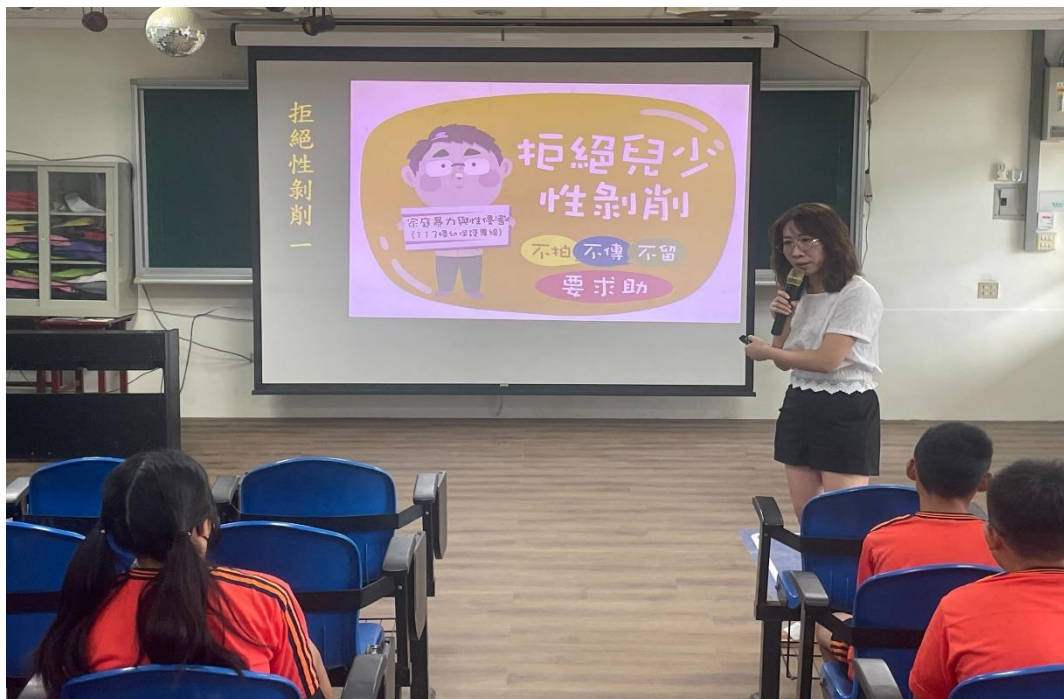
結合友善校園週向全校師生宣導