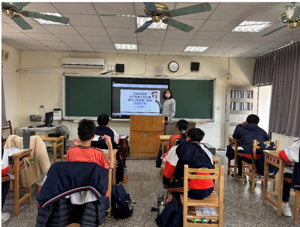
113 學年度下學期結合友善校園週辦理八年級導師入班宣導