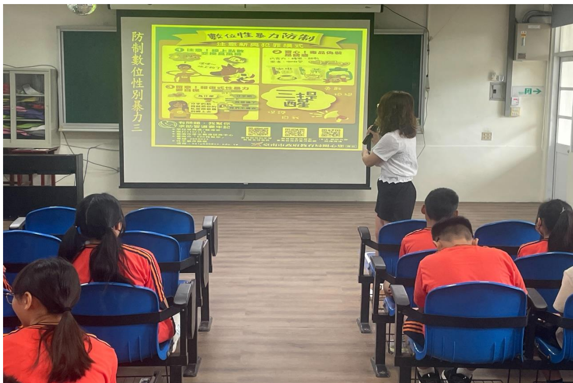
結合友善校園週向全校師生宣導