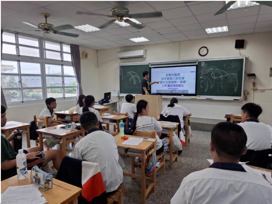
113 學年度上學期結合友善校園週辦理九年級導師入班宣導