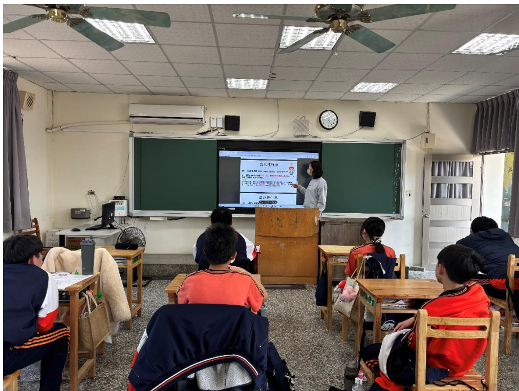
113 學年度下學期結合友善校園週辦理八年級導師入班宣導