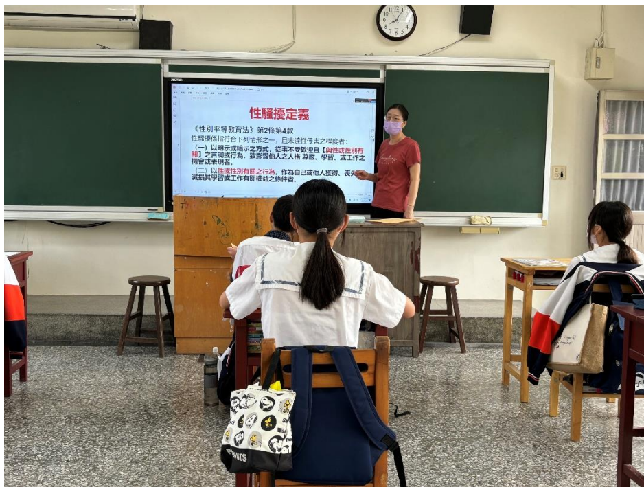
113 學年度上學期結合友善校園週辦理八年級導師入班宣導