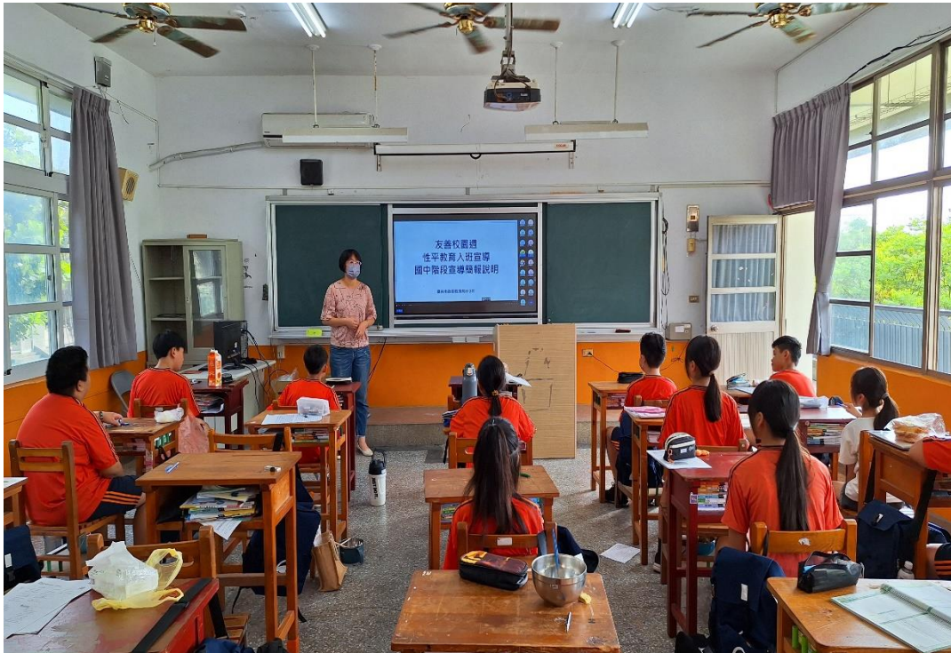
113 學年度上學期結合友善校園週辦理七年級導師入班宣導