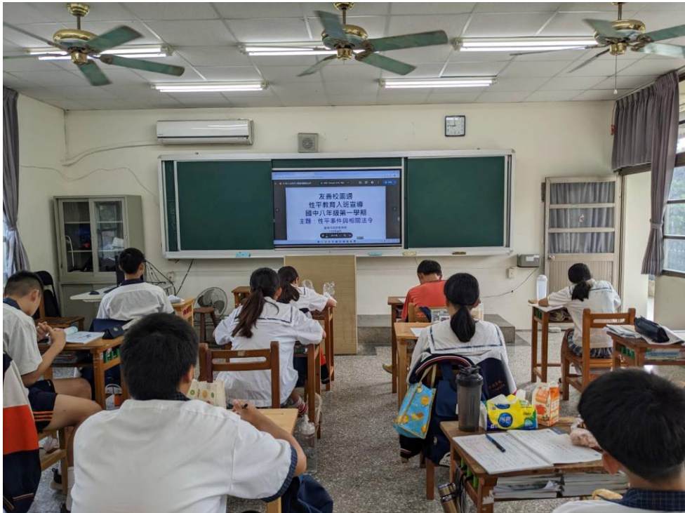
113 學年度上學期結合友善校園週辦理八年級導師入班宣導