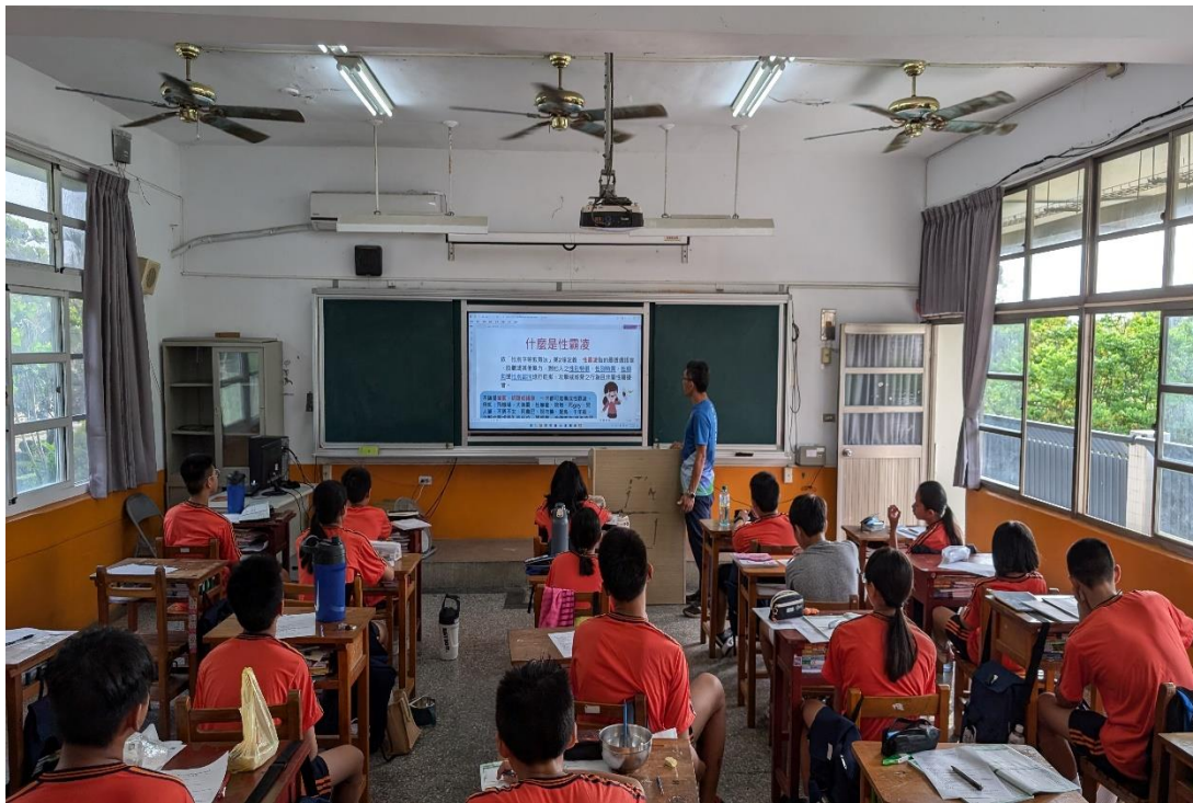
113 學年度上學期結合友善校園週辦理七年級導師入班宣導