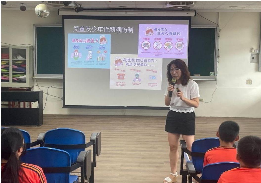
結合友善校園週向全校師生宣導