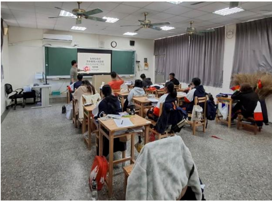
113 學年度下學期結合友善校園週辦理九年級導師入班宣導