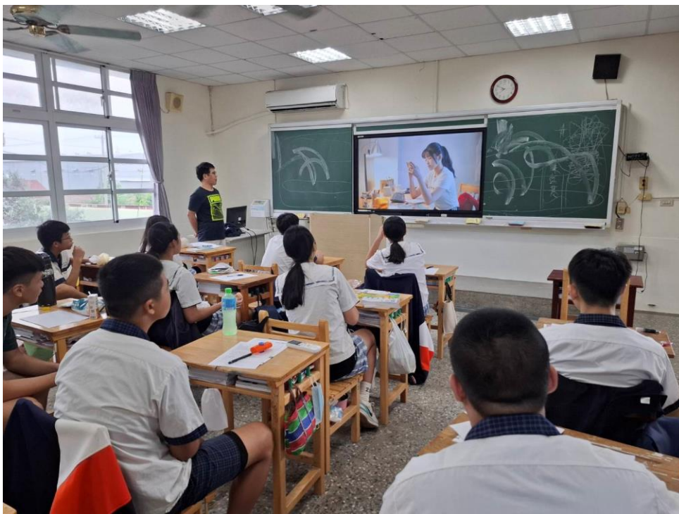
113 學年度上學期結合友善校園週辦理九年級導師入班宣導