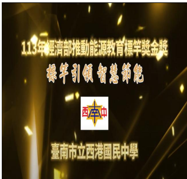
能源標竿學校獲獎影片