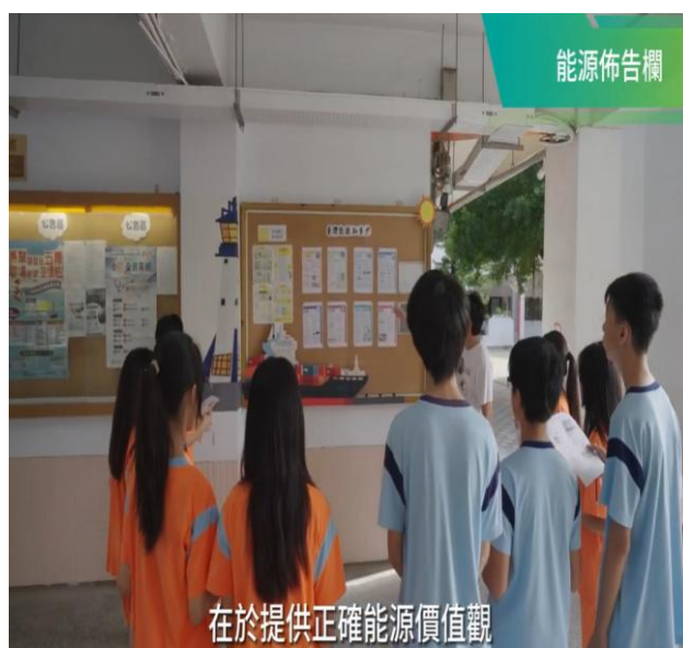
能源標竿學校獲獎影片