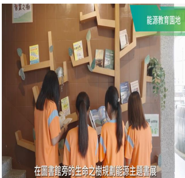
能源標竿學校獲獎影片