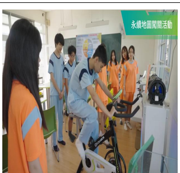
能源標竿學校獲獎影片