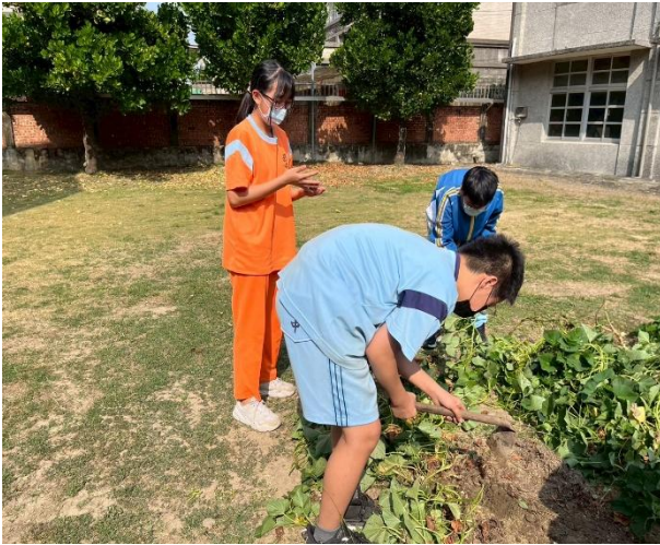
教師帶領學生進行食農教育課程