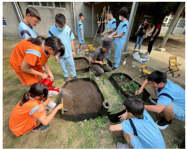
教師帶領學生進行食農教育課程