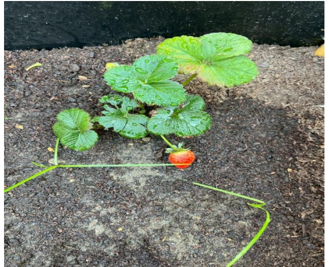
教師帶領學生進行食農教育課程