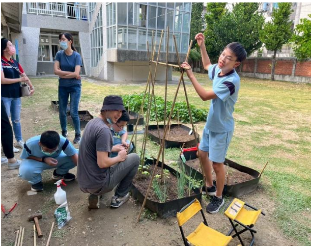
教師帶領學生進行食農教育課程