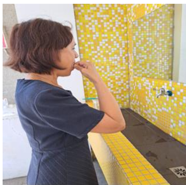
教職員飯後使用牙線潔牙