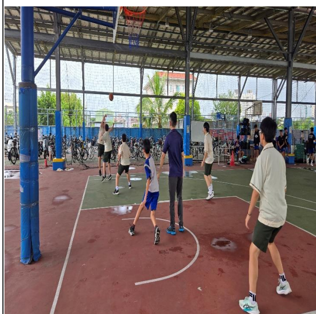
本校教師跟同學打籃球