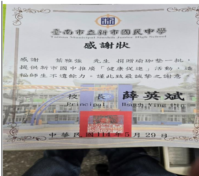
熱心民眾贈送本校瑜珈墊,致感謝狀