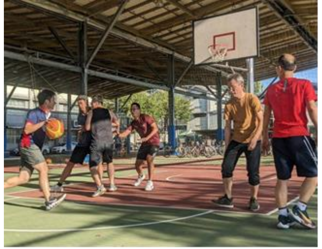
教職員結伴打籃球