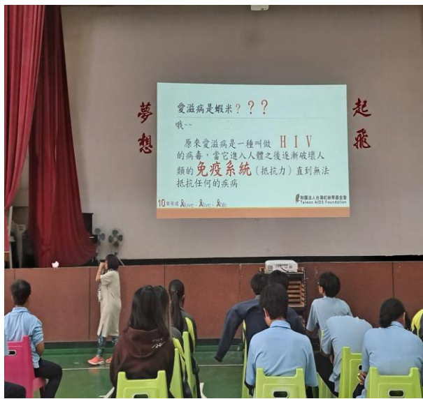
內容說明：認識愛滋病