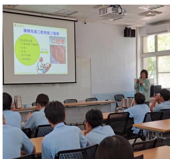
說明：檳榔防治宣導