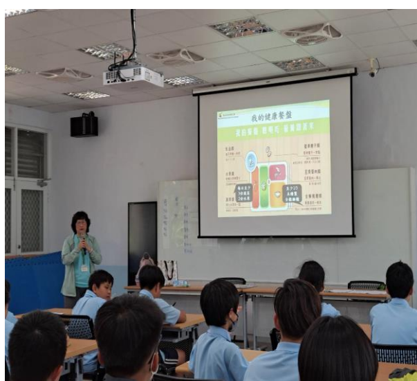
說明：正確均衡飲食宣導