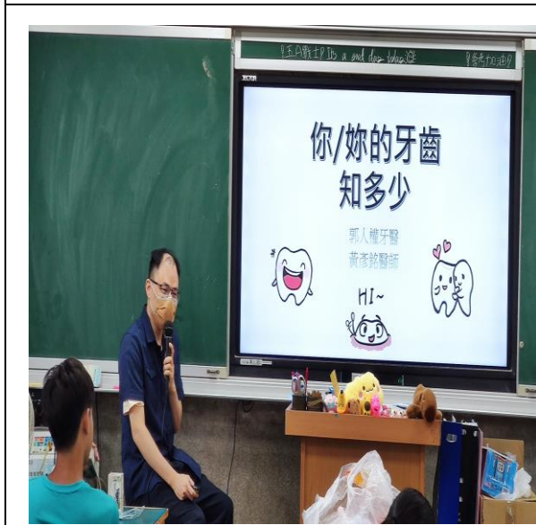
說明：課程內容說明