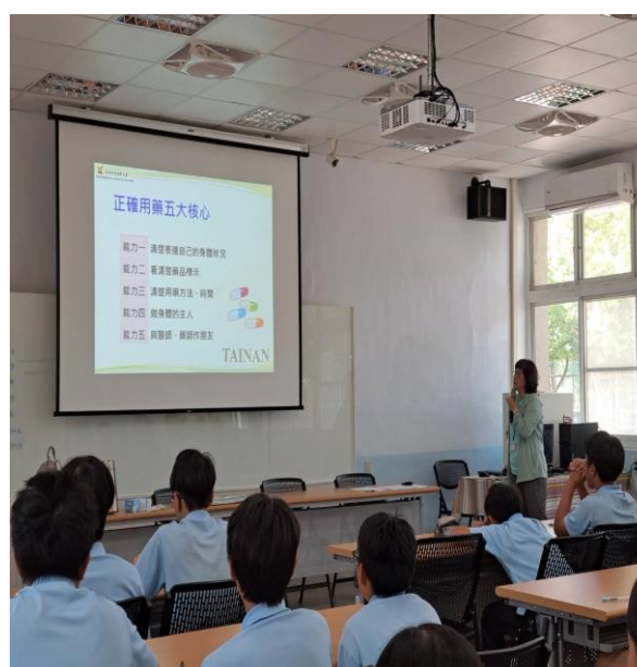
說明：正確用藥宣導