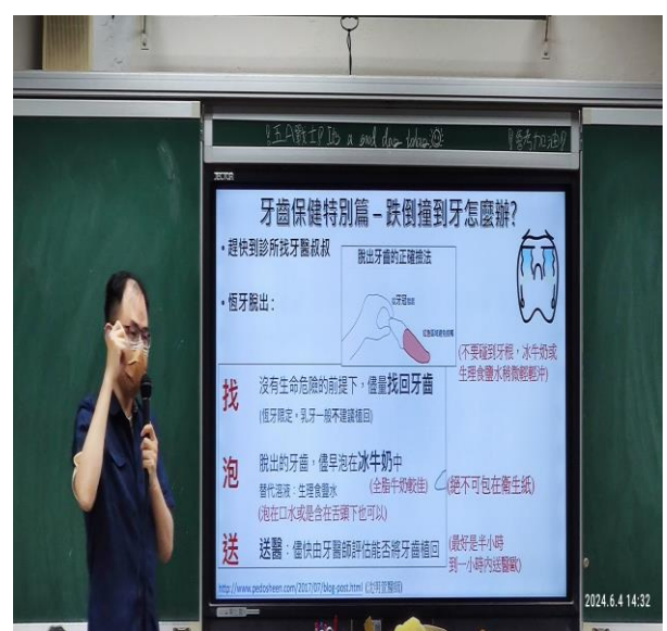
說明：牙齒撞傷怎麼辦？