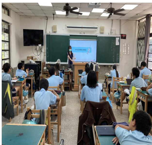
說明：HPV疫苗注射應注意