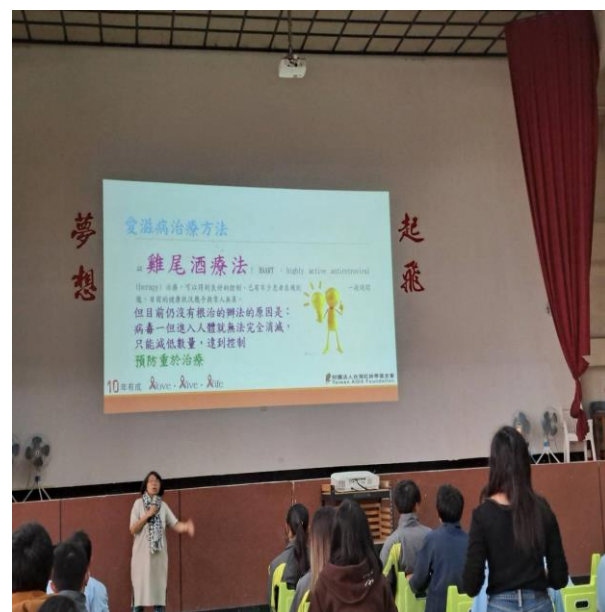
內容說明：愛滋病的治療方法