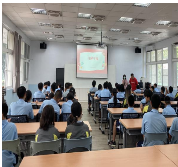
內容說明：課程內容大綱介紹