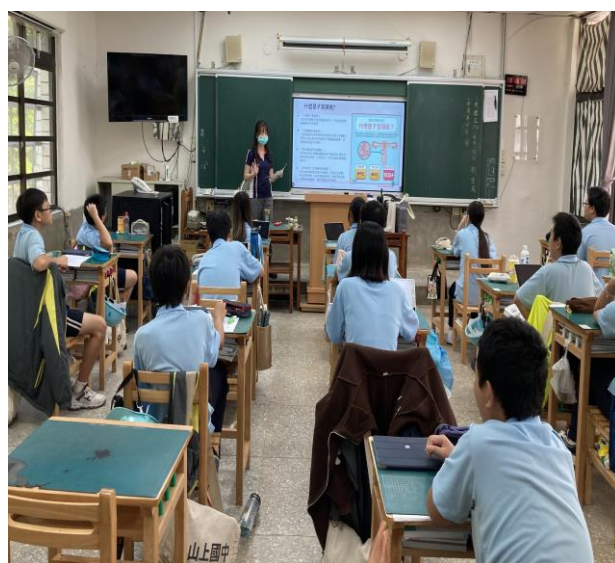
說明：認識子宮頸癌