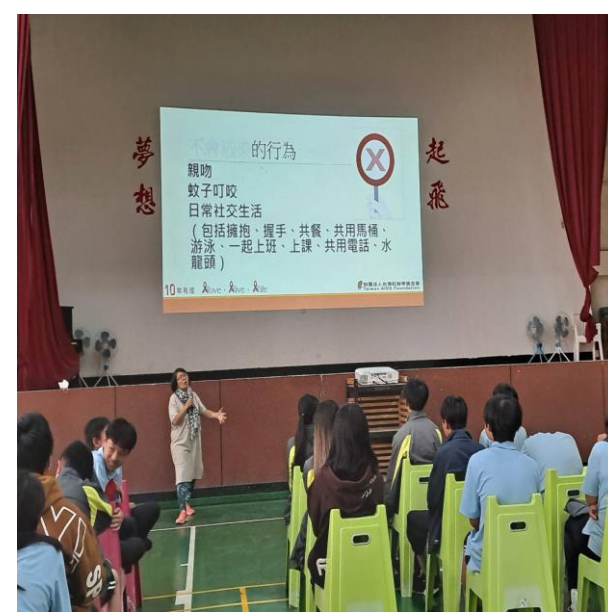
內容說明：什麼情形不會傳染愛滋病如何避免被傳染