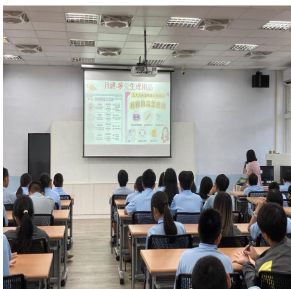
內容說明：月經生理期介紹