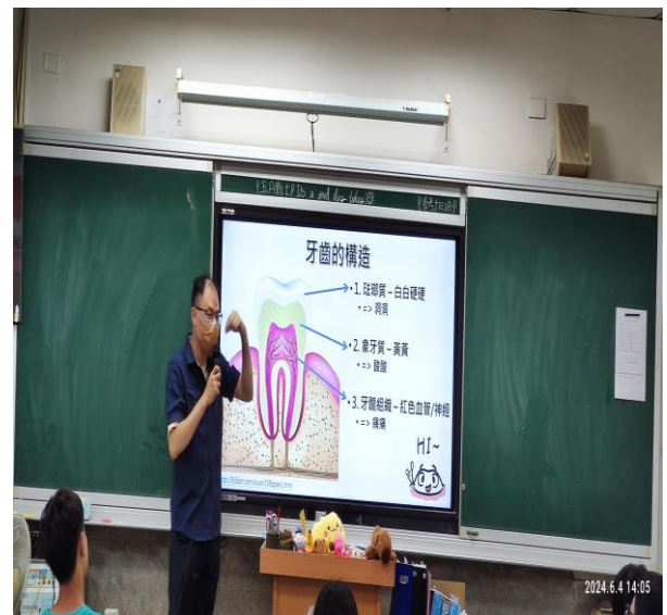
說明：認識牙齒的構造