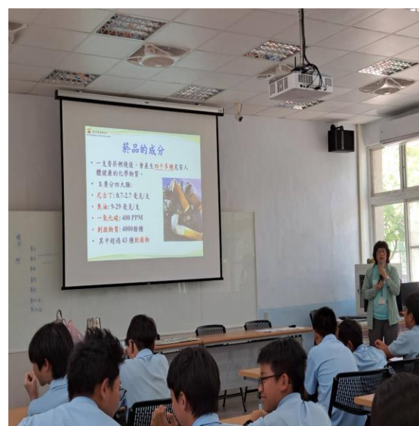
說明：菸害防制宣導