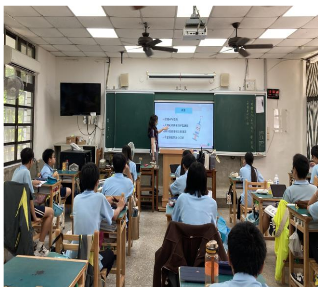
說明：課程內容大綱介紹