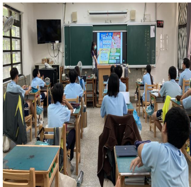
說明：其他性病介紹