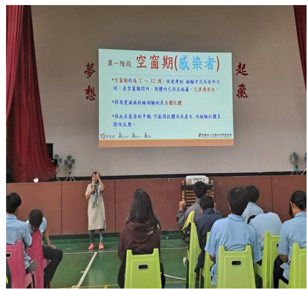
內容說明：愛滋病空窗期