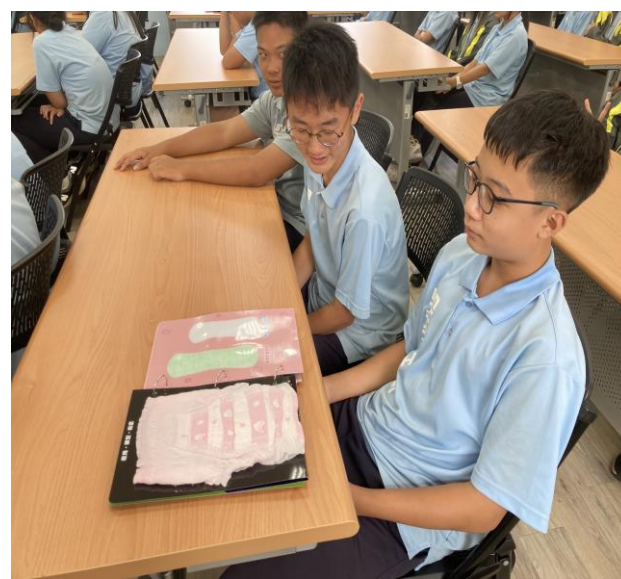
內容說明：認識多元生理用品