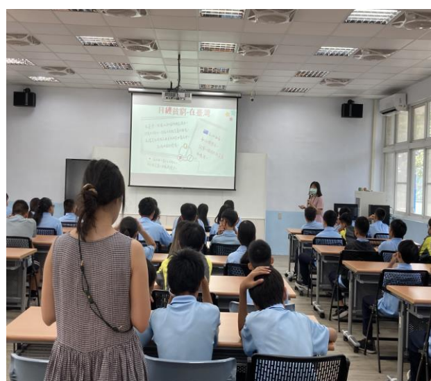
內容說明：月經平權在臺灣困境