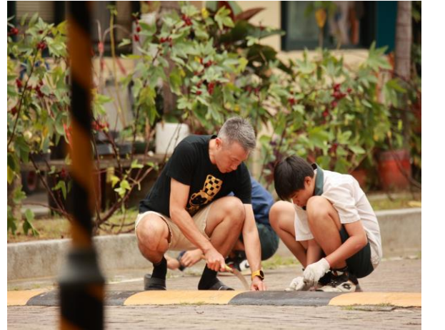
教師與學生一起打掃校園環境