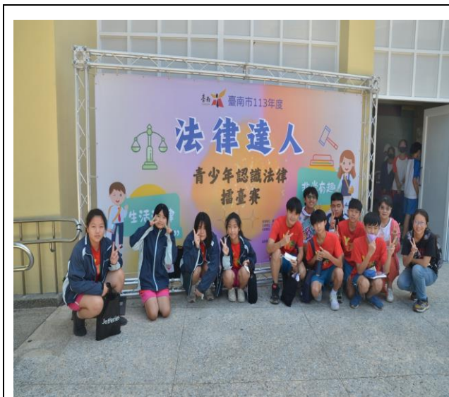
帶領學生參加法律達人比賽