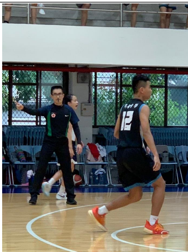
擔任校際籃球賽裁判