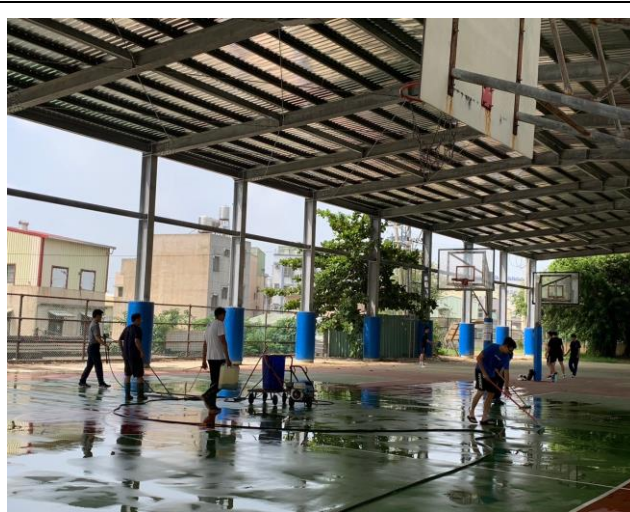
教師協助籃球場環境整理