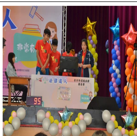
帶領學生參加法律達人比賽