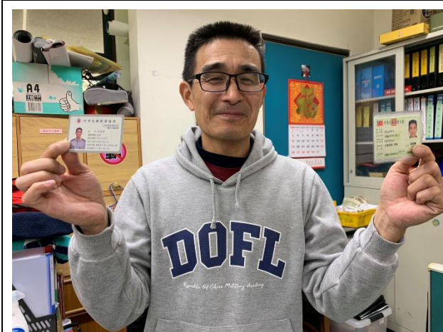
校安人員利用課餘時間取得籃球裁判及丙級廚師執照