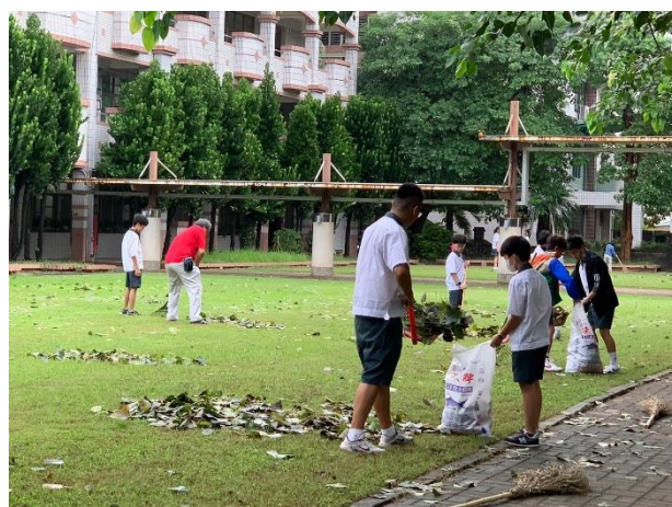
教師與學生一起打掃校園環境