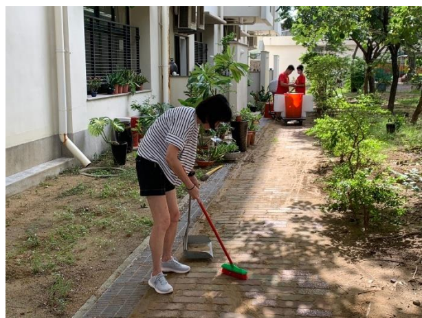
教師與學生一起打掃校園環境