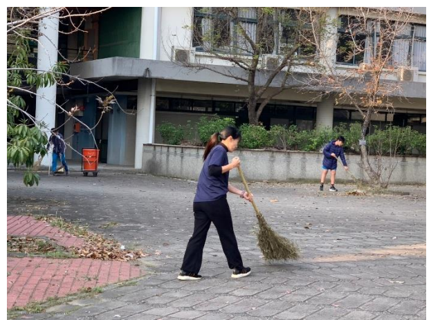
教師與學生一起打掃校園環境