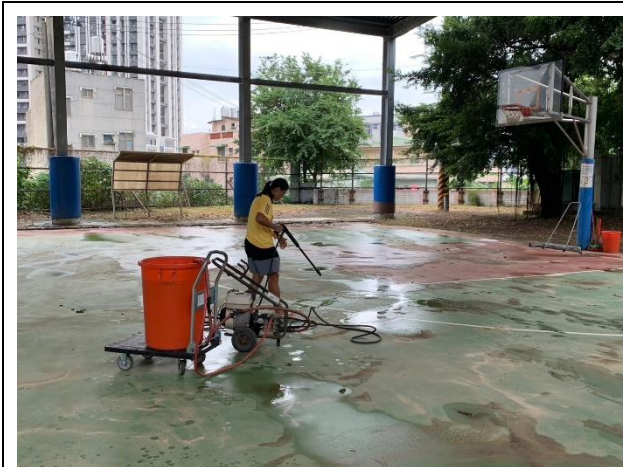
教師協助籃球場環境整理