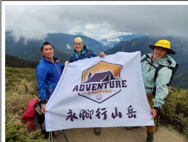
假日登山活動(路線探勘)