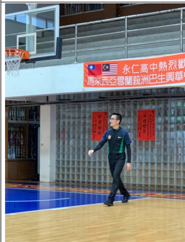
擔任校際籃球賽裁判