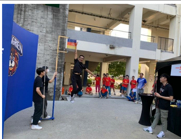
與學生一起參加 HBL 校園活動