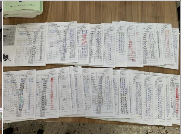
每年級三班(共九班填寫健康護照)