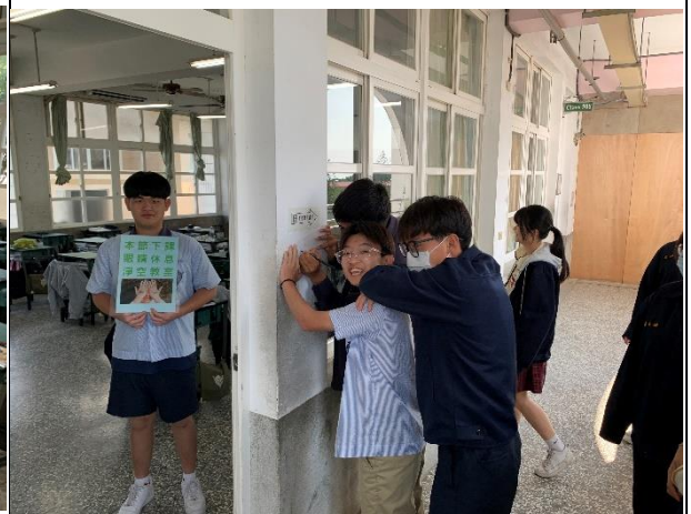
班級有負責學生標語提醒同學