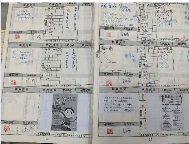
利用聯絡簿張貼相關健康資訊