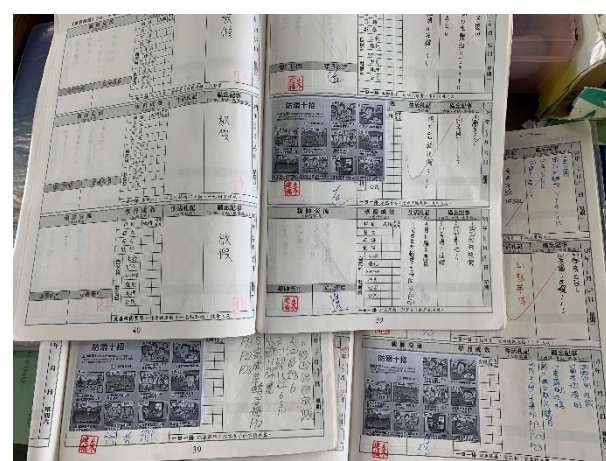
利用聯絡簿張貼相關健康資訊