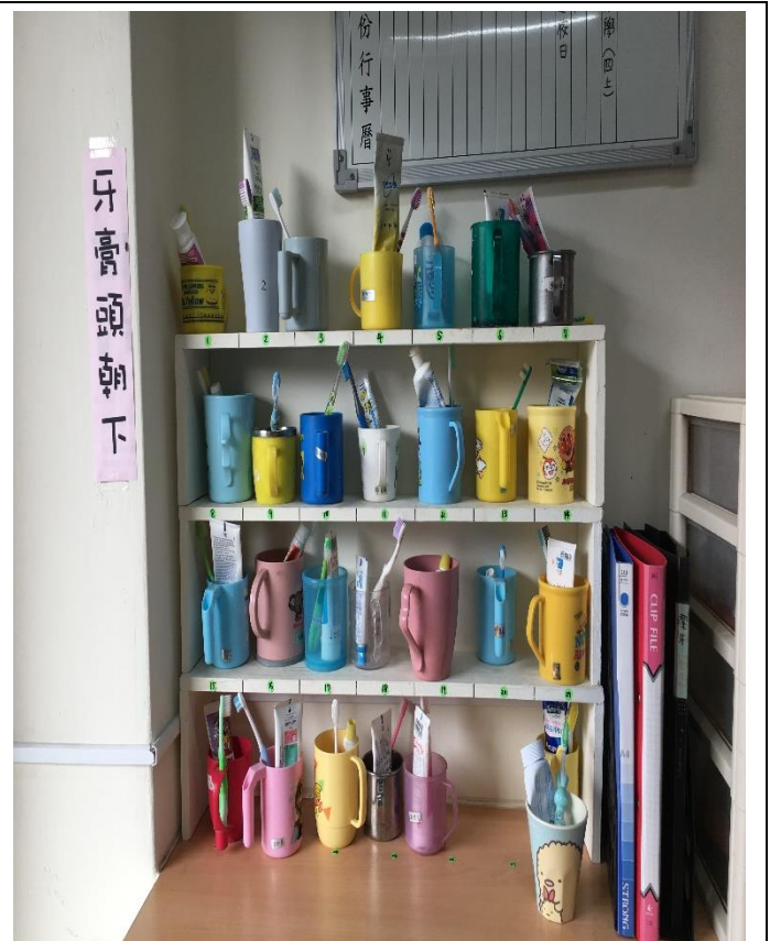
說明：健康習慣從小養成