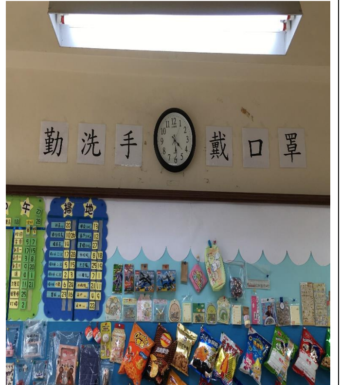
說明：明顯處張貼標語