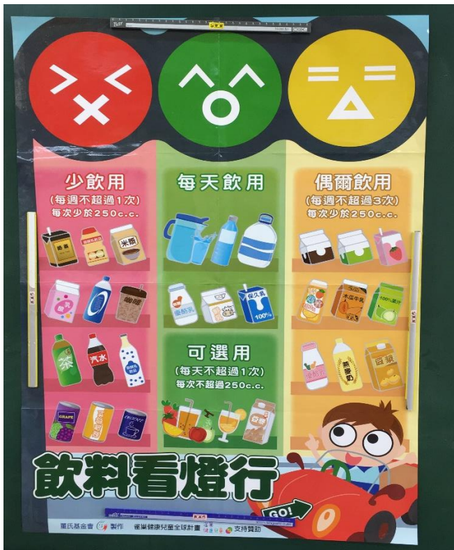
說明：健康飲食宣導