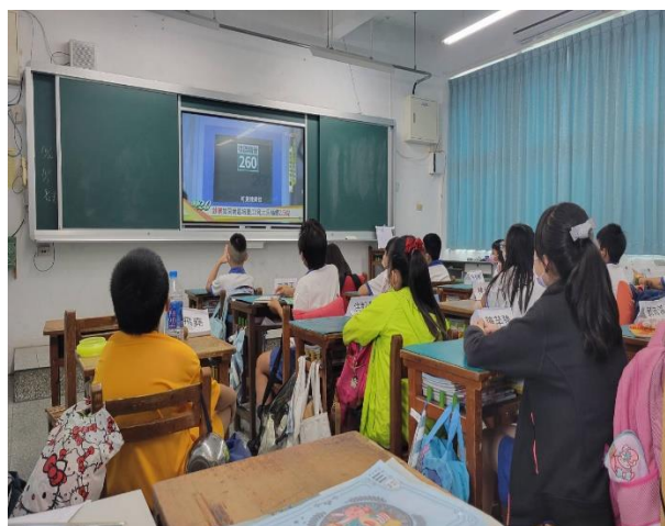
說明：防疫重點-戴口罩、勤洗手、噴酒精、有症狀不到校。