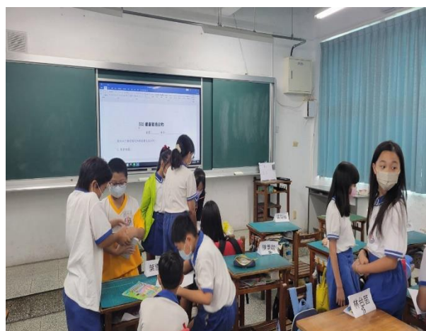
說明：討論勤洗手、保持座位整潔。