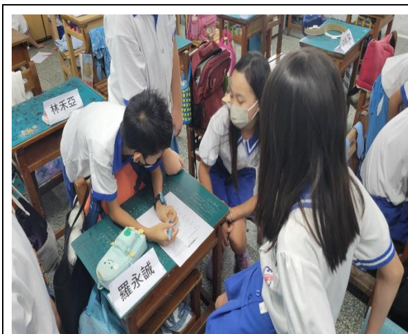
說明：討論吃飯前洗手、打飯保持安靜。