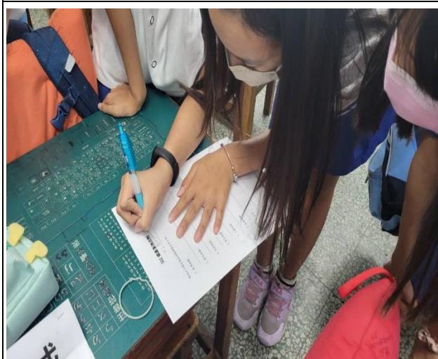
說明：寫下教室內不嬉鬧遊戲、跑跳。