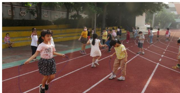
下課時間清空教室進行運動