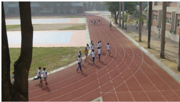
下課時間清空教室進行運動