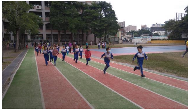
下課時間清空教室進行運動