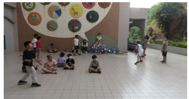
下課時間清空教室進行運動