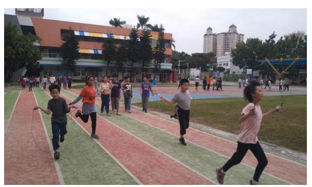
下課時間清空教室進行運動