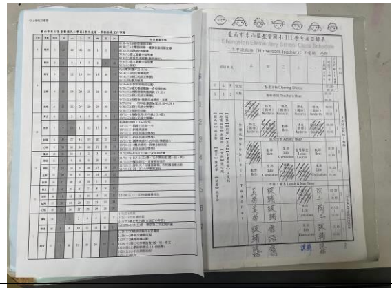
聯絡簿張貼行事曆提供健康活動日程資訊