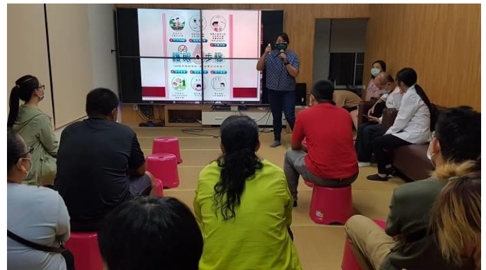
辦理護眼講座提供家長健康資訊