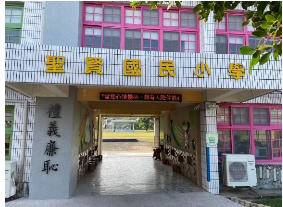
利用跑馬燈進行健康資訊傳達