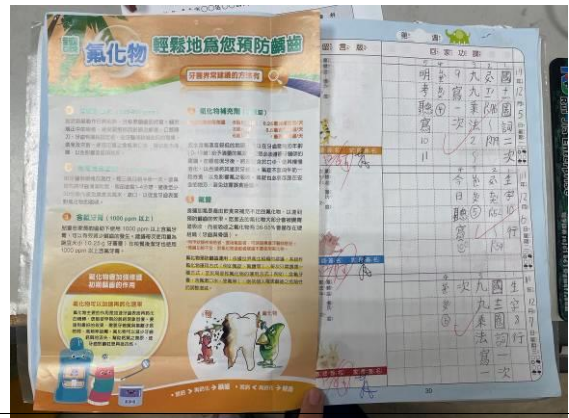
氟化物宣導單張貼於聯絡簿