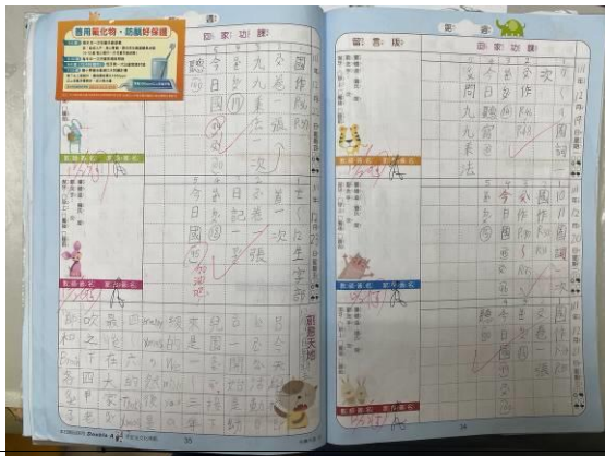
氟化物宣導貼紙貼於聯絡簿