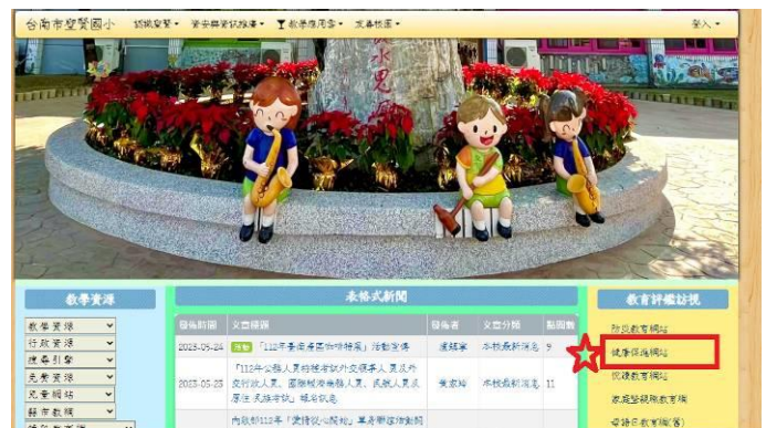
學校網站提供健康促進網站連結