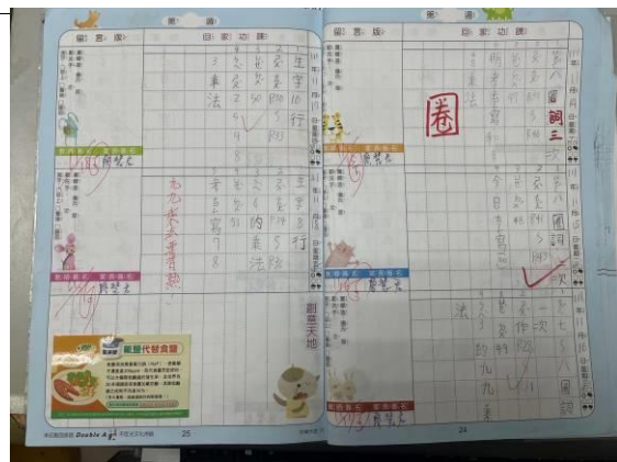
氟鹽宣導貼紙貼於聯絡簿