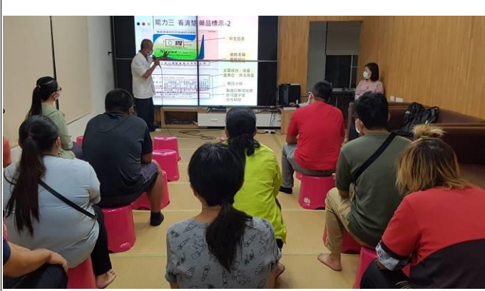
利用班親會辦理正確用藥健康宣導