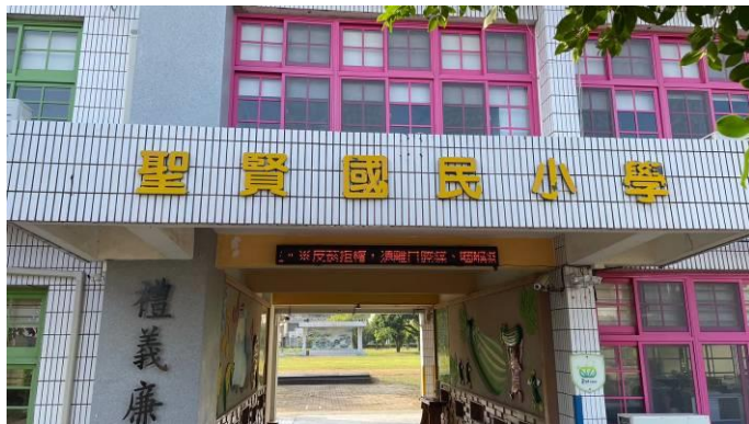
利用跑馬燈進行健康資訊傳達