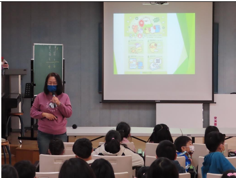
說明 2：友善校園宣導~對抗網路霸凌處理方式