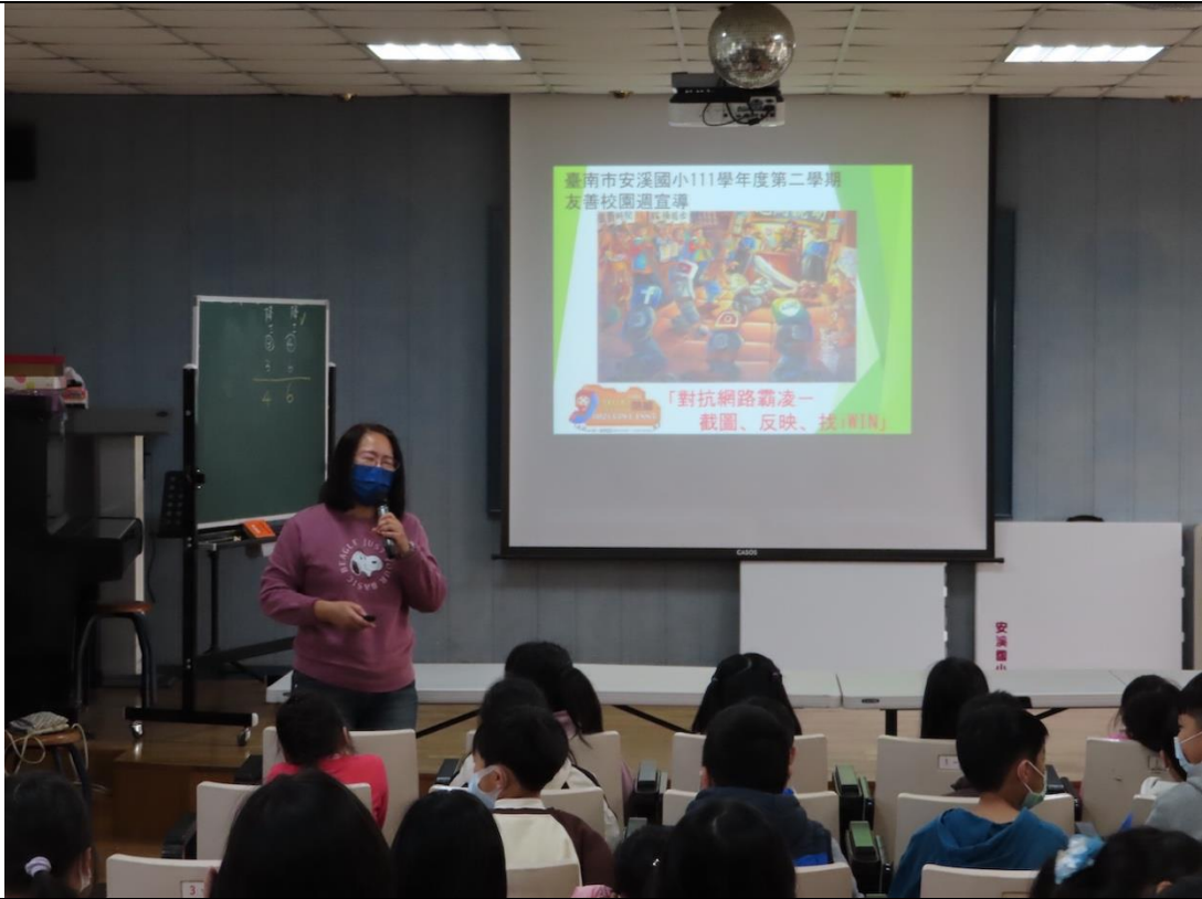
說明 1：友善校園宣導~對抗網路霸凌