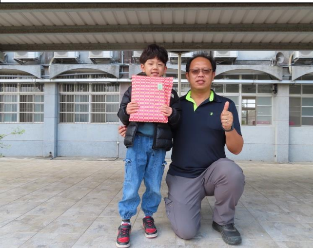
111 學年度幼兒園模範生頒獎