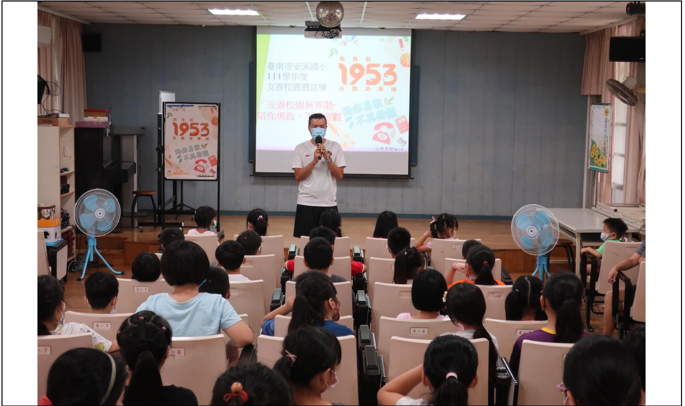
說明 1：友善校園宣導~反霸凌專線 1953