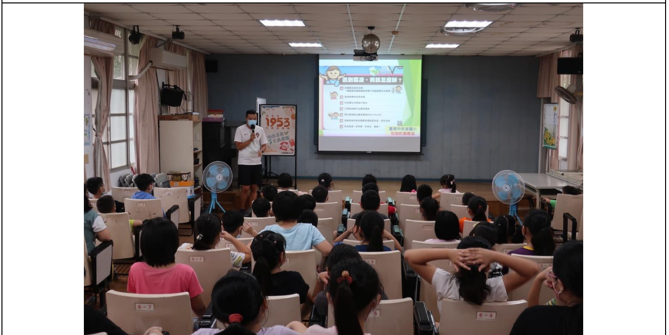
說明 2：友善校園宣導~遇到霸凌該怎麼辦