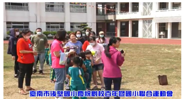
家長一同參與闖關活動