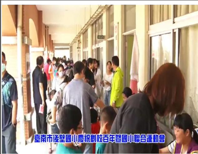
家長一同參與闖關活動