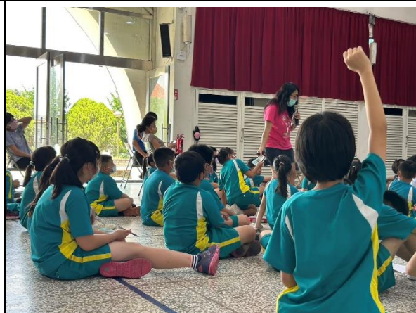
說明：進行有獎徵答。