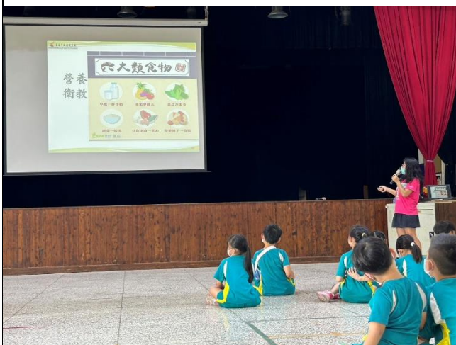
說明：哪些是六大類食物。