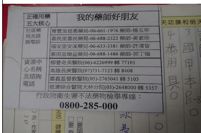
社區藥局諮詢電話張貼聯絡簿