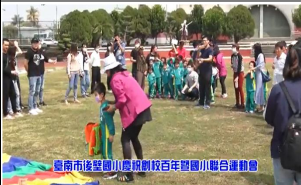
家長一同參與闖關活動