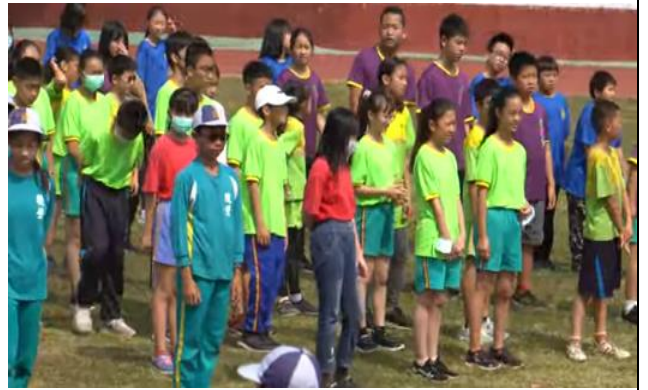
說明：他校學生一同參賽