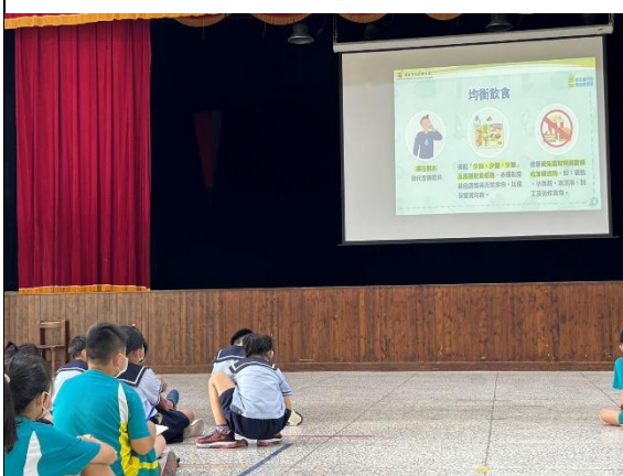
說明：衛生所護理師到校進行均衡飲食宣導