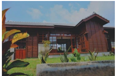
(期待這裡變成最有味道的課輔空間，也成為老中青三代的樂土)