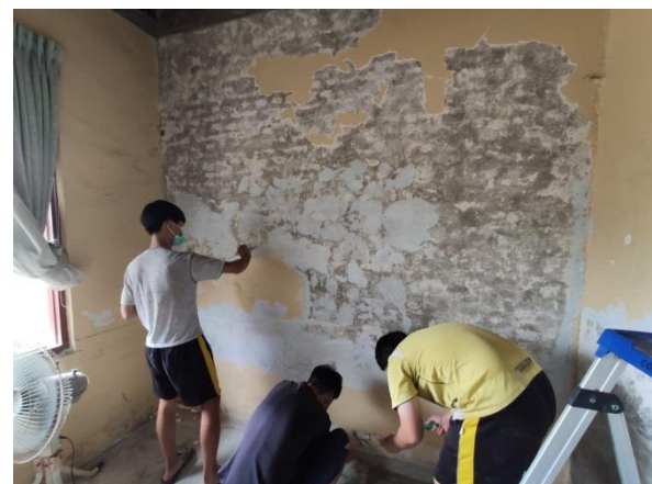
(園區的許多角落都有孩子們一起參與的身影，正因為他們也是這裡重要的一份子)