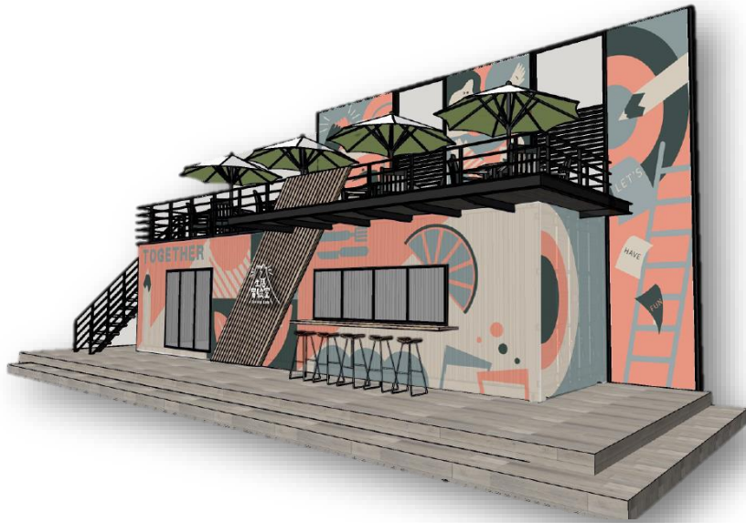
(衛福部社家署協助設計的貨櫃圖)