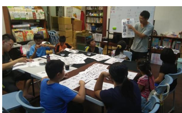
(往年在辦公室課輔班的執行狀況)