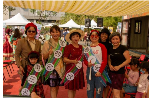
(透過青銀合作，讓阿嬤們也能重新走上表演紅毯上)