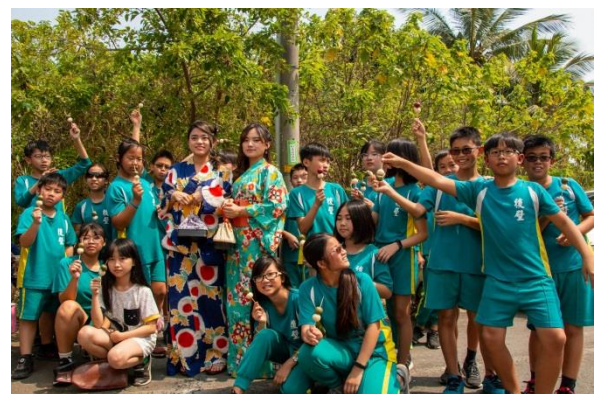
(辦理農產市集讓更多人支持在地產業和創意食農體驗)