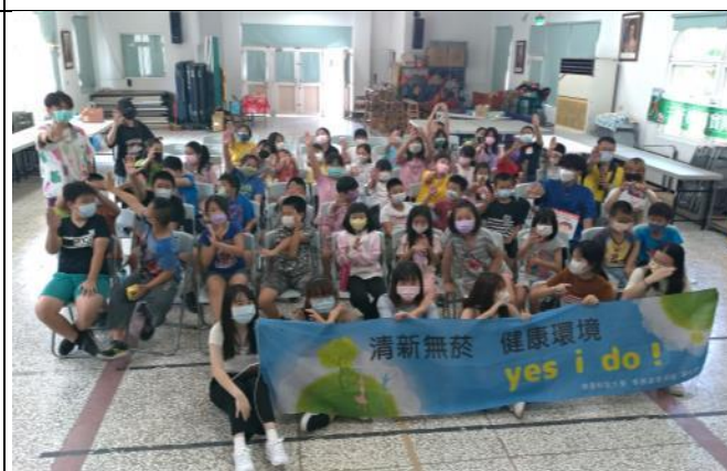
說明：南台科大帶領學童進行無菸毒活動。