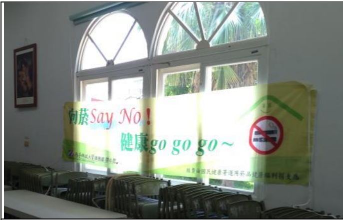
說明：於學生的集會場所懸掛「向菸SAY NO」布條。