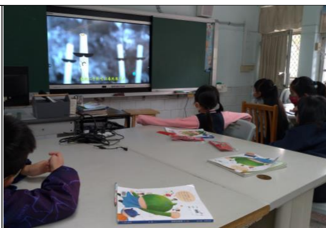
說明：結合健康課程進行菸害防制宣導。