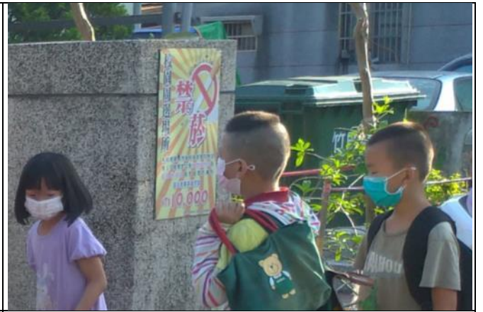
說明：於校門顯眼處張貼禁菸標誌。