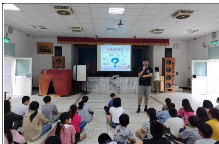
說明：老師於學生集會時宣導無菸環境宣導。