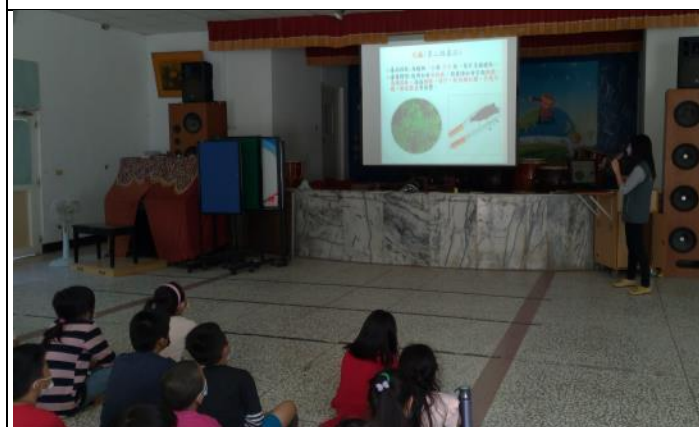
說明：邀請少年警察隊至校宣導反菸毒。