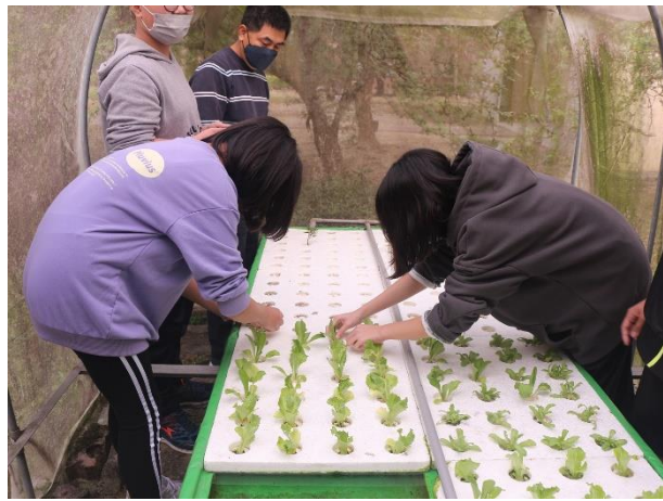
活動說明：學生親手栽種水耕蔬菜