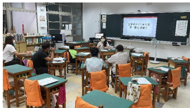
說明：班親會老師說明學生健康作息