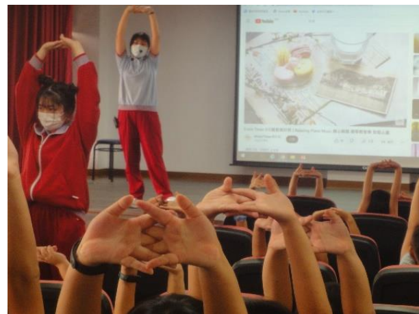
說明：敏惠護專到校宣導-eye 動眼操