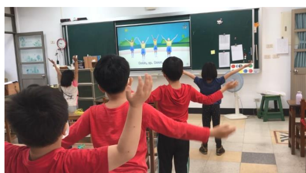
說明： 雙語健體 - 健康操