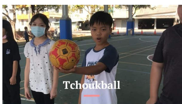
說明： 雙語健體 - Tchoukball