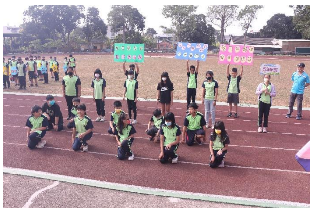
活動說明：校慶運動會- 五年級珍惜健保資源宣導