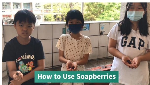
說明： 雙語健體 - How to Use Soapberries