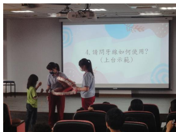
說明：敏惠護專到校宣導-有獎徵答