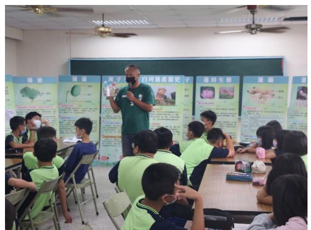
活動說明：將軍山農場到校進行食農教育