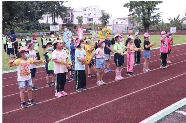
活動說明：校慶運動會- 二年級口腔衛生宣導