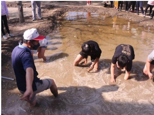
活動說明：校園蓮田耕作