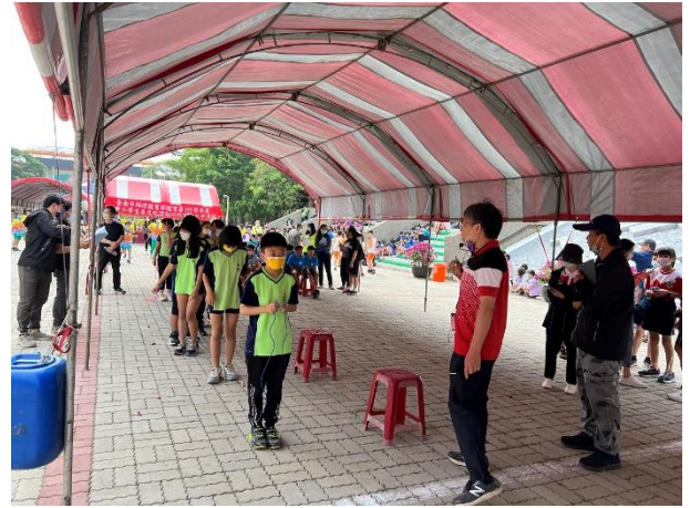
說明：參加 111 學年度國中小學生普及化運動跳繩接力比賽