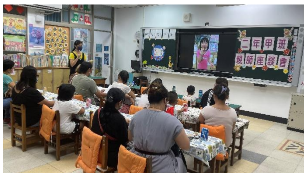
說明：班親會老師說明學生健康作息