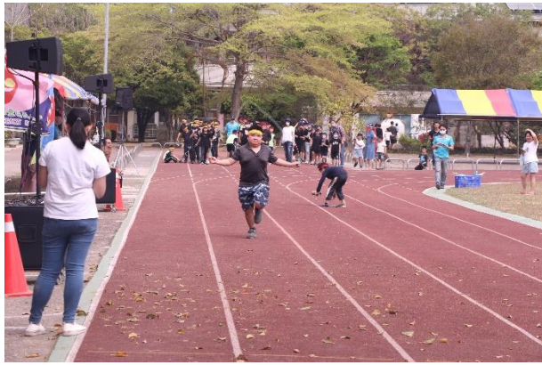
說明：舉辦跳繩接力賽