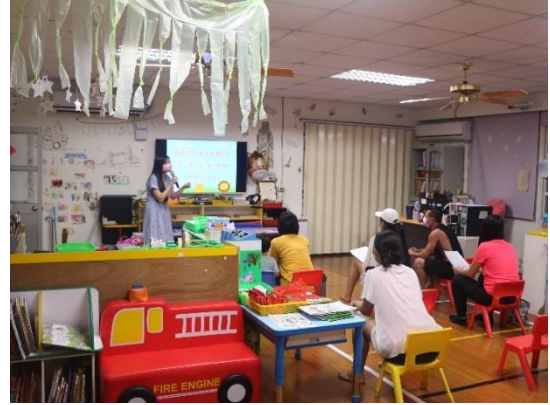
說明：班親會老師說明學生健康作息