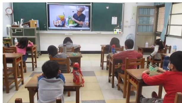
說明： 雙語健體 - 牙膏口味選擇