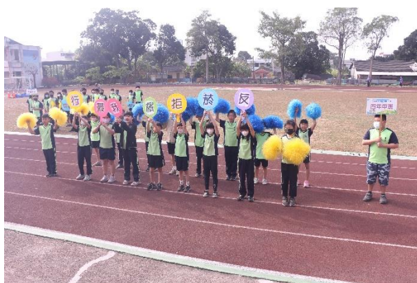
活動說明：校慶運動會- 四年級菸檳防治宣導