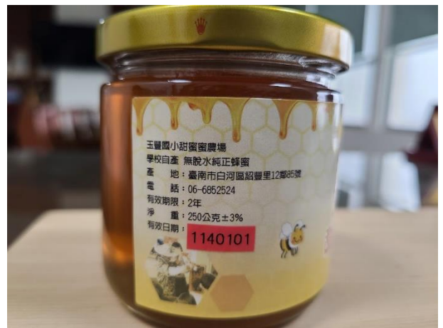
活動說明：甜蜜蜜農場自產自銷