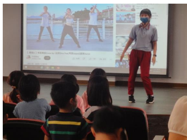
說明：敏惠護專到校宣導-有氧舞蹈帶動跳