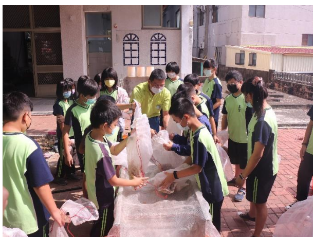
活動說明：將軍山農場到校進行食農教育