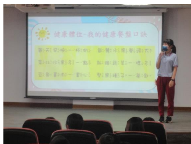
說明：敏惠護專到校宣導-健康餐盤口訣