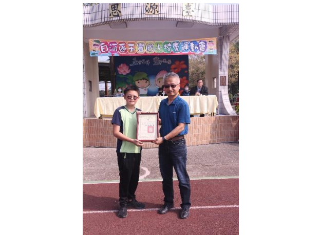
說明：傳藝比賽-臺灣獅優等