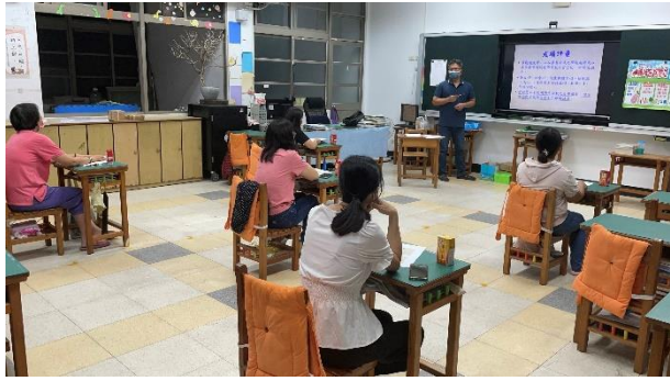
說明：班親會老師說明學生健康作息