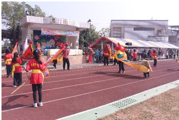
說明：推廣傳統藝術-臺灣獅