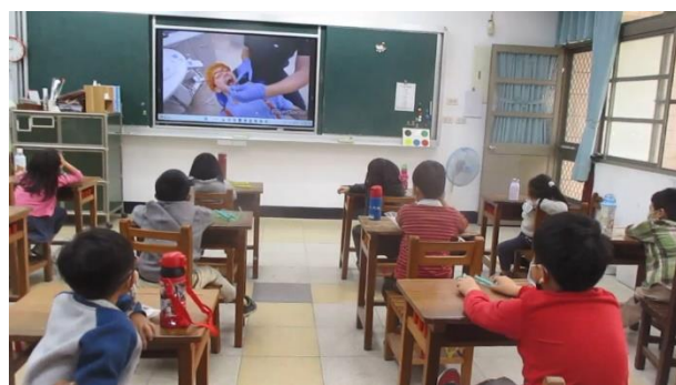
說明： 雙語健體 - 數牙齒數量