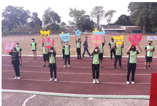
活動說明：校慶運動會- 六年級健康心理促進宣導 （五正四樂）