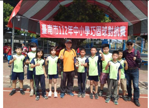
說明：112 年中小學巧固球對抗賽 榮獲四年級男生組單網組/第二名