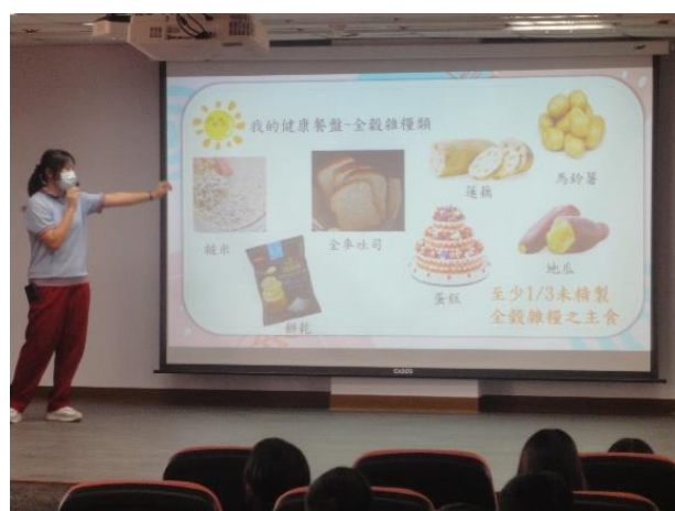
說明：敏惠護專到校宣導-健康餐盤