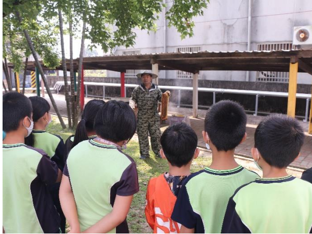
活動說明：蜜蜂教學