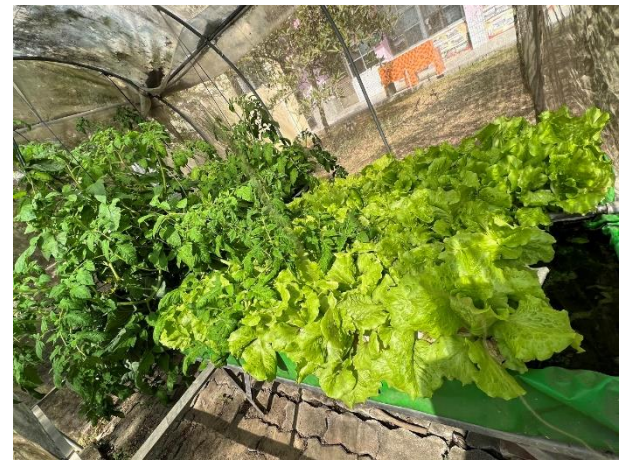
活動說明：水耕蔬菜成熟後