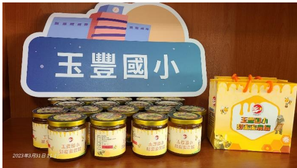
活動說明：甜蜜蜜農場自產自銷