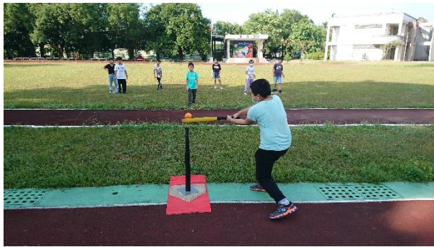
說明：推廣樂樂棒球