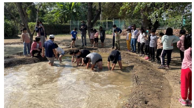
活動說明：校園蓮田耕作