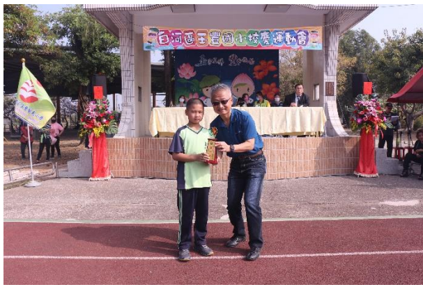
說明：111 年度中小學巧固球錦標賽 國小四年級男生單網組/第一名