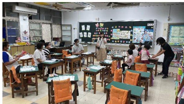
說明：班親會老師說明學生健康作息