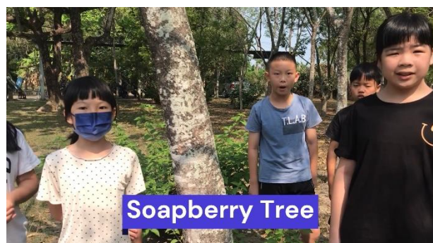
說明： 雙語健體 - Soapberry Tree