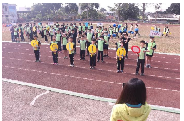
活動說明：校慶運動會- 三年級健康體位宣導