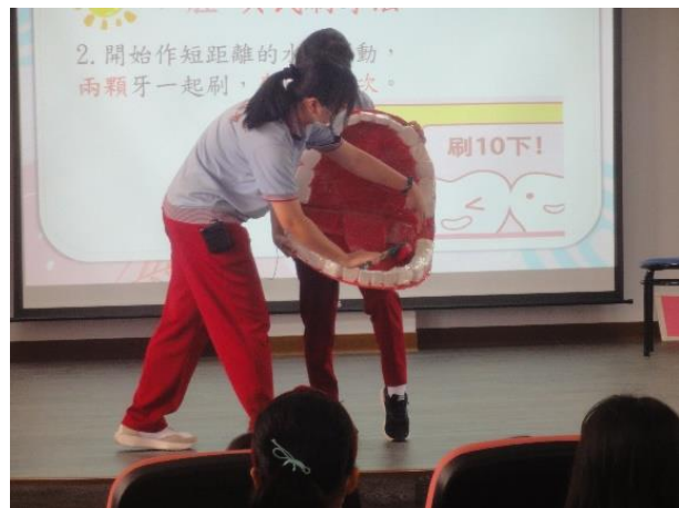
說明：敏惠護專到校宣導-貝氏刷牙法