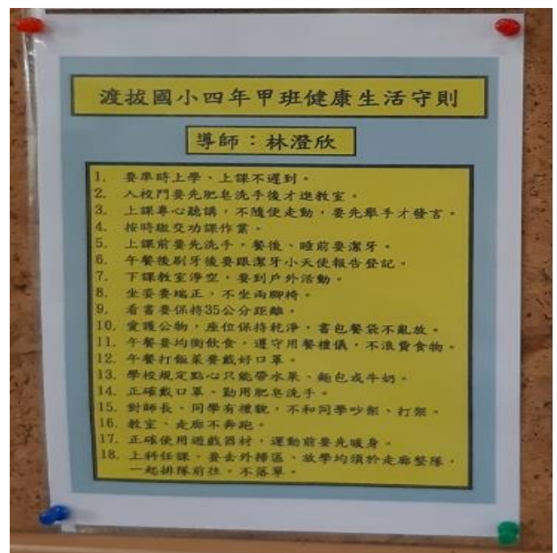
說明：四甲教室公布欄張貼健康生活守則、潔牙表