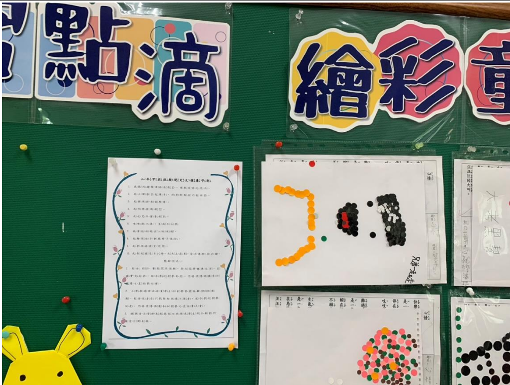
張貼公布欄-低年級班級健康生活守則