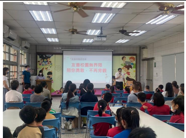
校長於友善校園週進行反霸凌宣導(上學期)