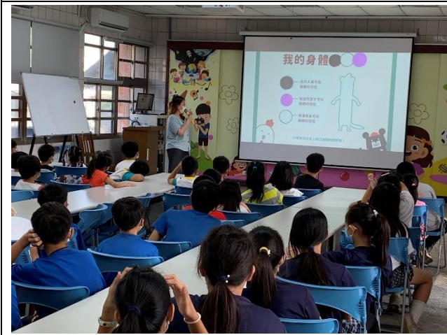
教師針對身體自主權議題進行全校宣導