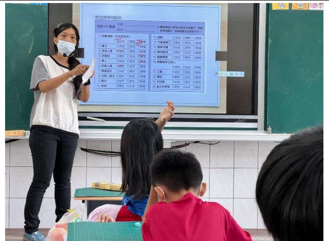
教師進行職業不分性別課程，教導正確觀念