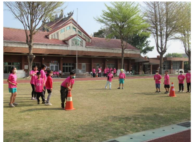
校慶舉辦刺激選邊站活動增進學生參與感