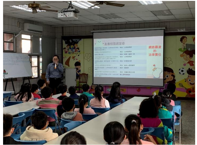
校長於友善校園週進行反霸凌宣導(下學期)