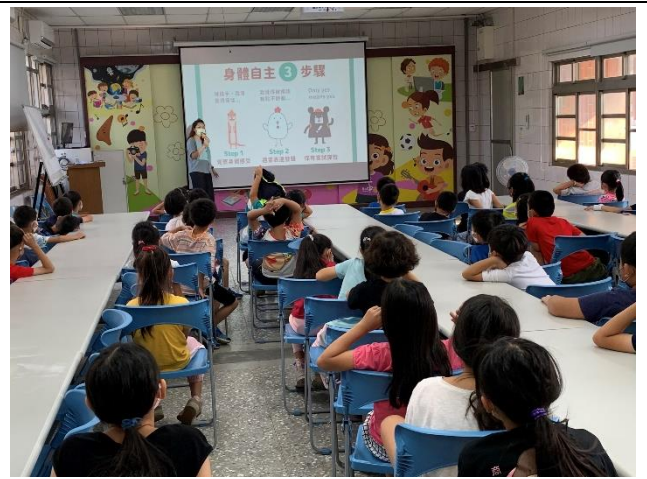
教師針對身體自主權議題進行全校宣導