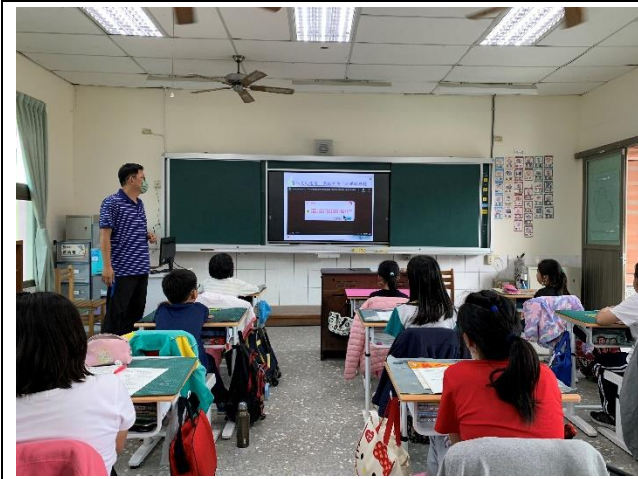
教師於性別平等教育週教導學生遇到網路騷擾的正確應對方式