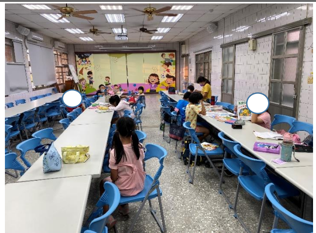
學校針對弱勢學生辦理課後輔導，讓學生的作業能於學校完成，減少家長負擔