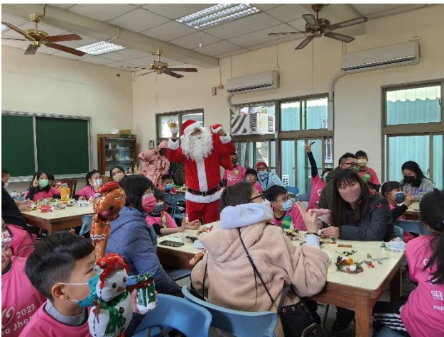
聖誕節家長會長裝扮成聖誕老公公發放禮物與師生一同慶祝聖誕節