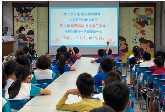
教師進行特教宣導，希望學生能了解支持與包容不一樣的孩子