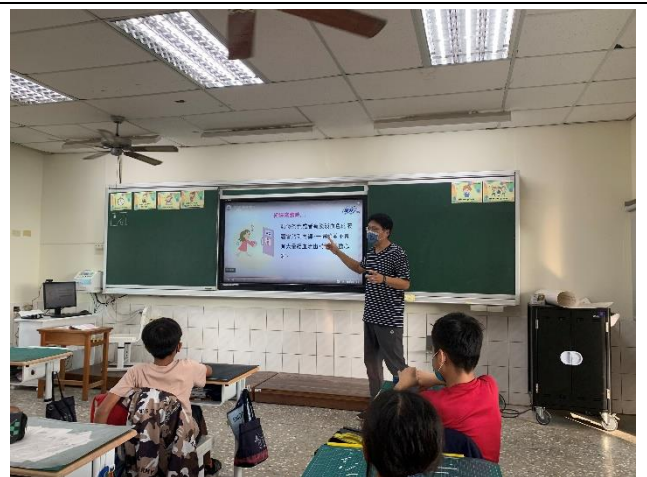
教師結合登月計畫，教導學生正確性教育知識