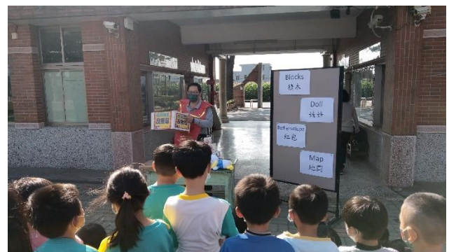
校長於寒假前裝扮成財神爺發放摸彩卷供學生進行摸彩