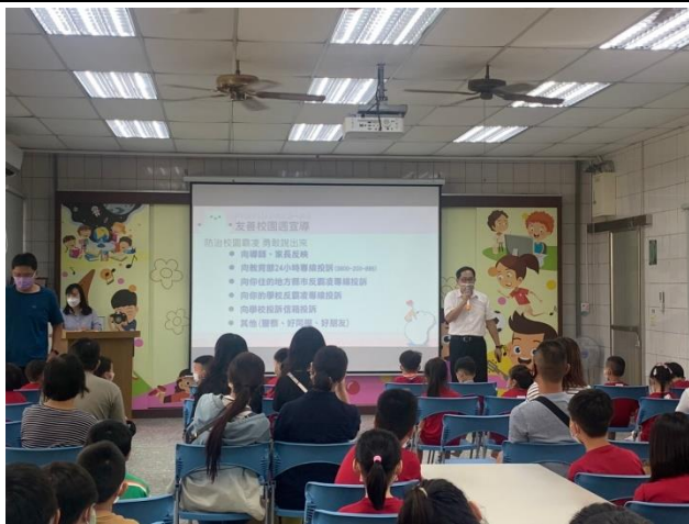
校長於友善校園週進行反霸凌宣導(上學期)