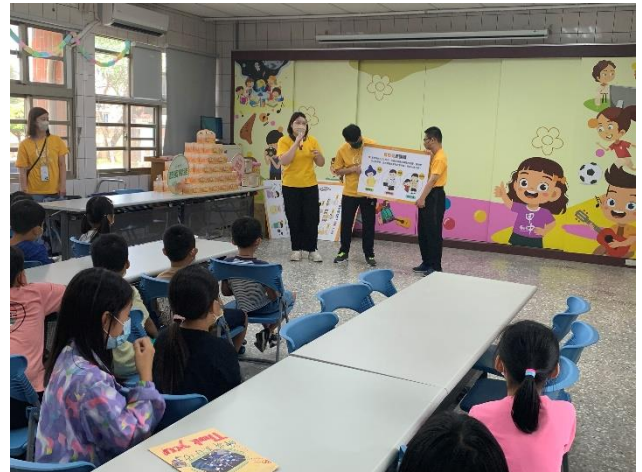
喜憨兒基金會到校辦理活動，教導學生了解喜憨兒的成因，並能包容他們。