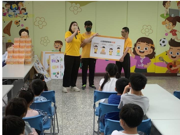
喜憨兒基金會到校辦理活動，教導學生了解喜憨兒的成因，並能包容他們。