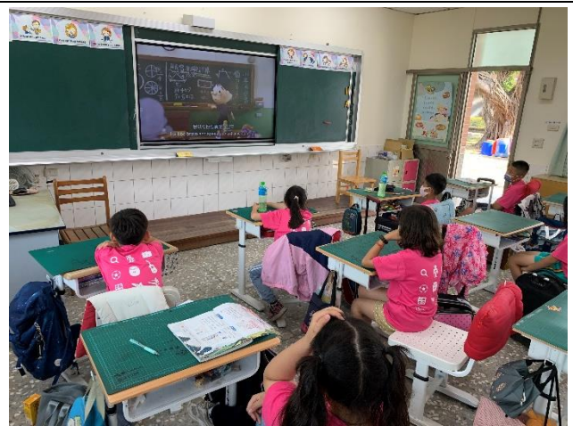
以課堂上反霸凌偶動畫對學生進行宣導