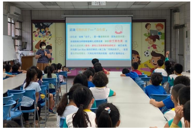
教師進行特教宣導，希望學生能了解支持與包容不一樣的孩子