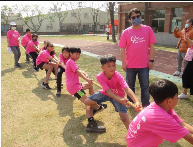
透過運動會舉辦競賽活動，增進學生競爭與合作的互動機會