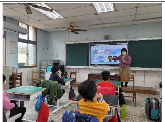
班級導師於每學期初進行性平入班宣導