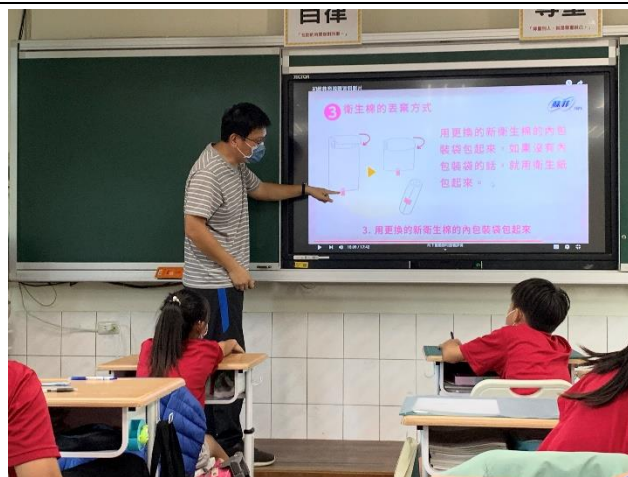
教師結合登月計畫，教導學生正確性教育知識