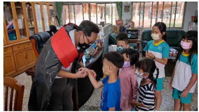
萬聖節教師與學生裝扮同樂