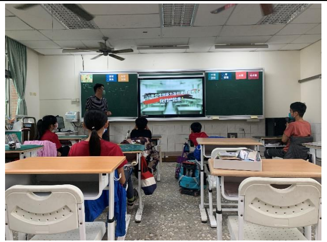
教師於性別平等教育週教導學生遇到網路騷擾的正確應對方式