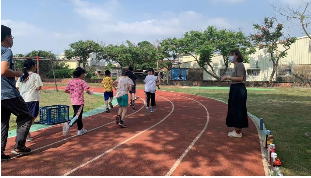
師生於下課時間一起進行體能活動