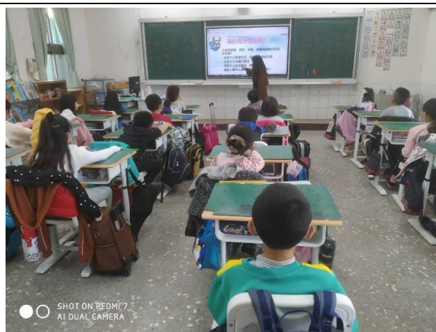
班級導師於每學期初進行性平入班宣導