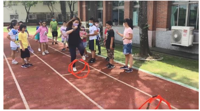
師生於下課時間一起進行體能活動