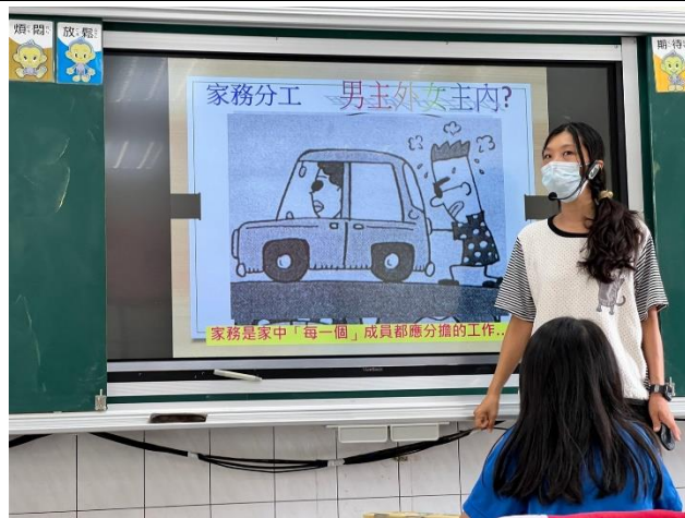
教師進行職業不分性別課程，教導正確觀念