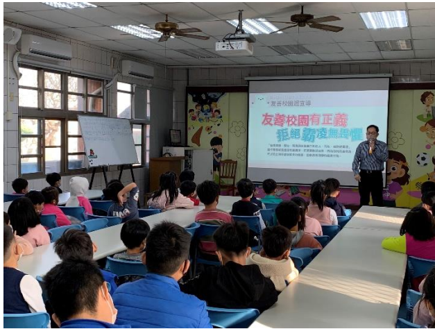
校長於友善校園週進行反霸凌宣導(下學期)