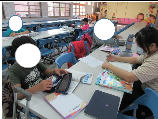
學校針對弱勢學生辦理課後輔導，讓學生的作業能於學校完成，減少家長負擔