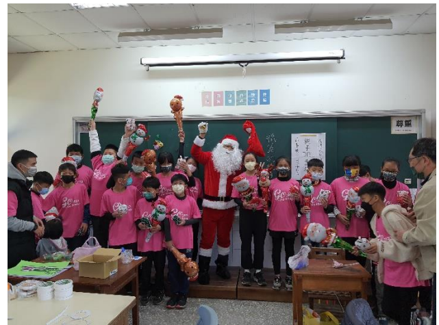
聖誕節家長會長裝扮成聖誕老公公發放禮物與師生一同慶祝聖誕節