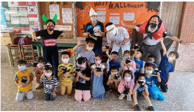
萬聖節教師與學生裝扮同樂