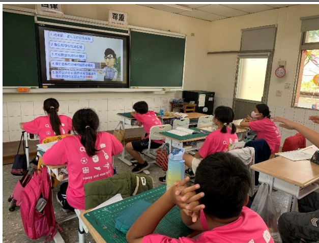
以課堂上反霸凌偶動畫對學生進行宣導