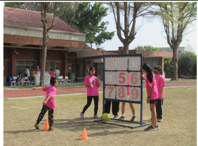
透過運動會舉辦競賽活動，增進學生競爭與合作的互動機會