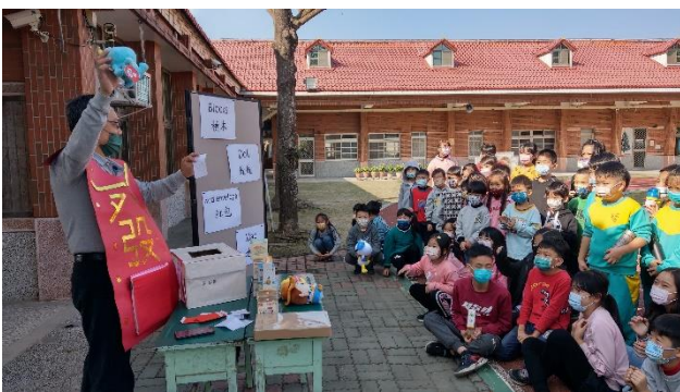
校長於寒假前裝扮成財神爺發放摸彩卷供學生進行摸彩