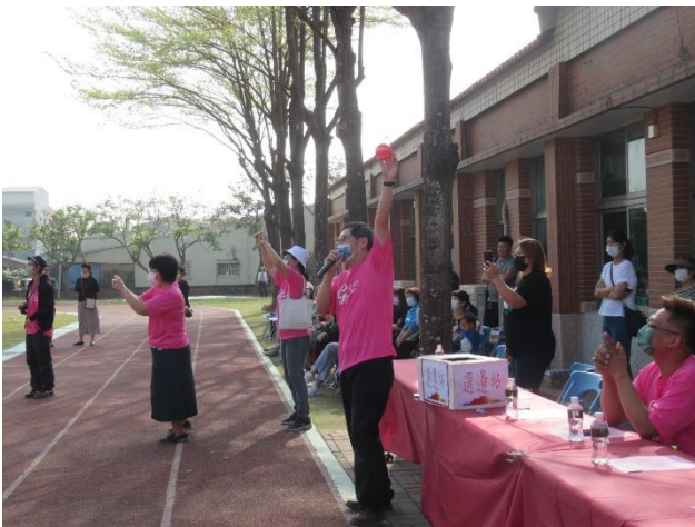
校慶舉辦刺激選邊站活動增進學生參與感