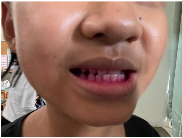
使用牙菌斑顯示劑檢測刷牙情形