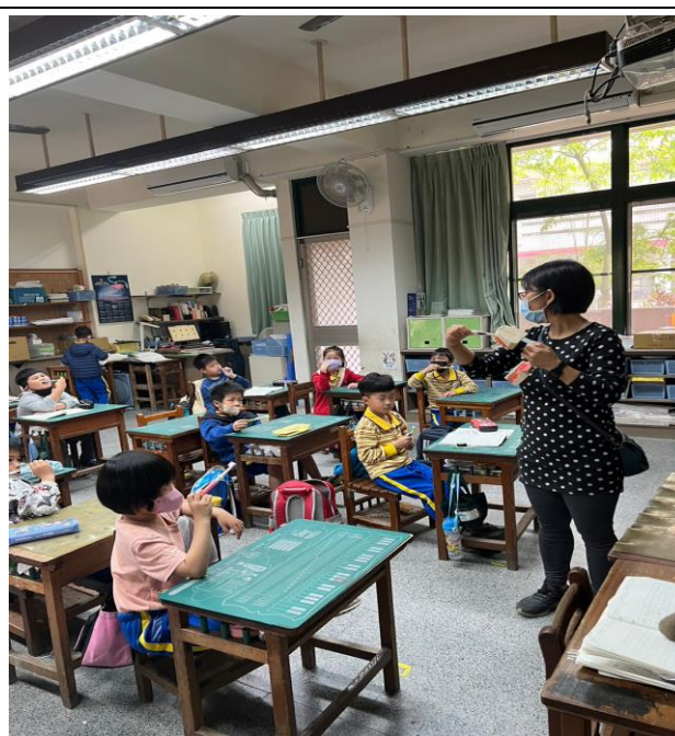
說明：貝式刷牙法介紹