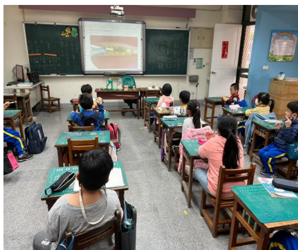
說明：引導學生了解造成蛀牙的原因