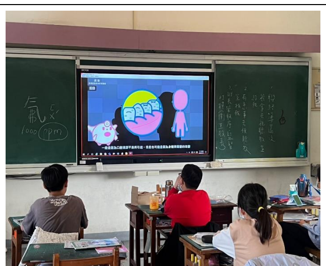
張 貼 我 的 健 康 守 則