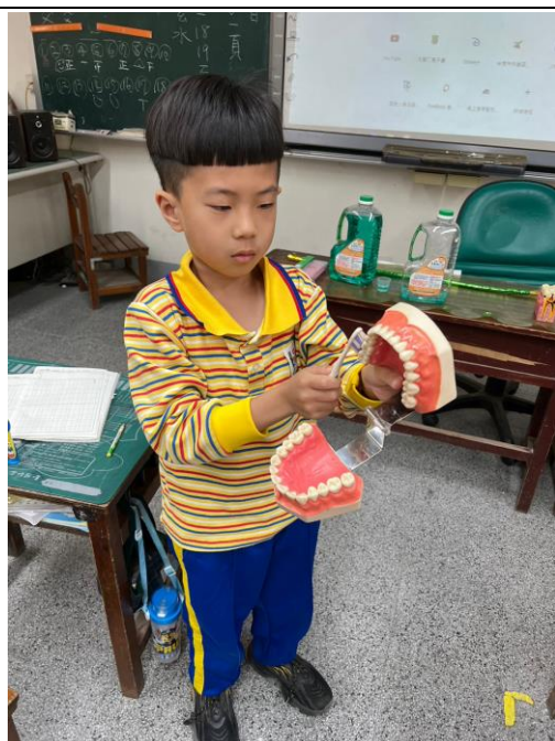
說明：利用牙齒模型練習正確刷牙的方法