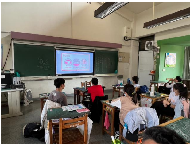
影片欣賞—正確刷牙口訣