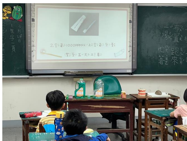
說明：說明要選擇合適牙刷及牙膏