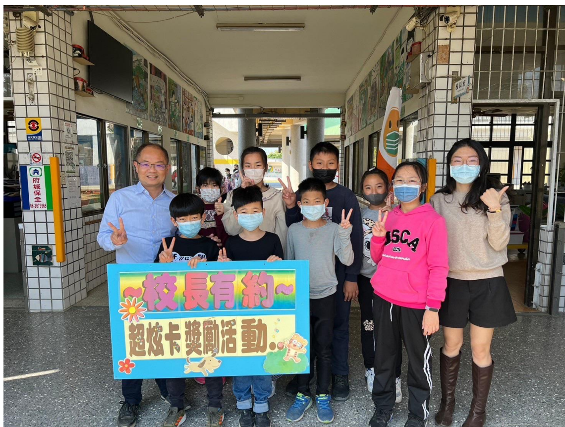
* 獎勵-超炫卡集點獎勵