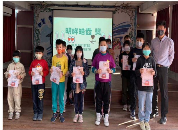
全校皆有健康五力護照，