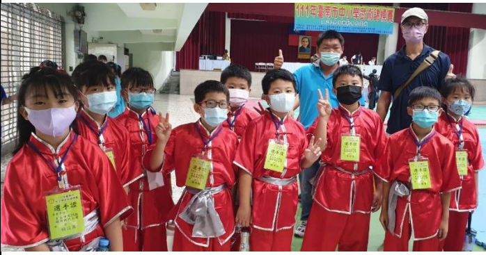
說明：參加武術比賽