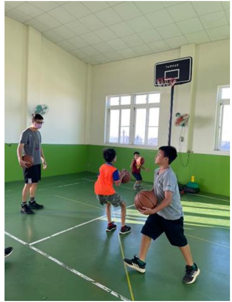
說明：課後籃球社團