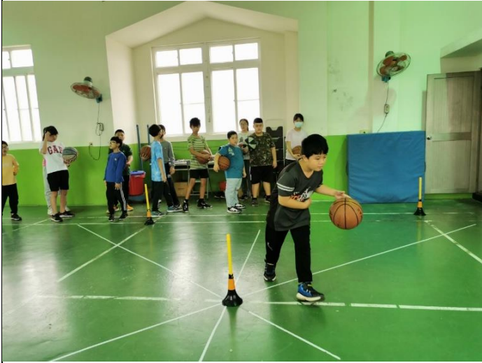
說明：課後籃球社團