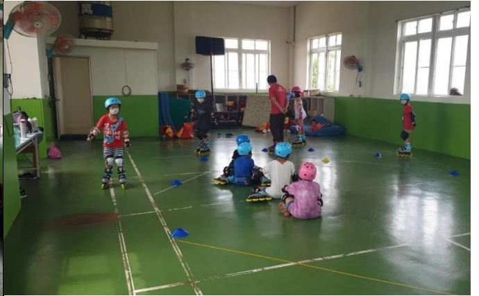
說明：暑期直排輪營