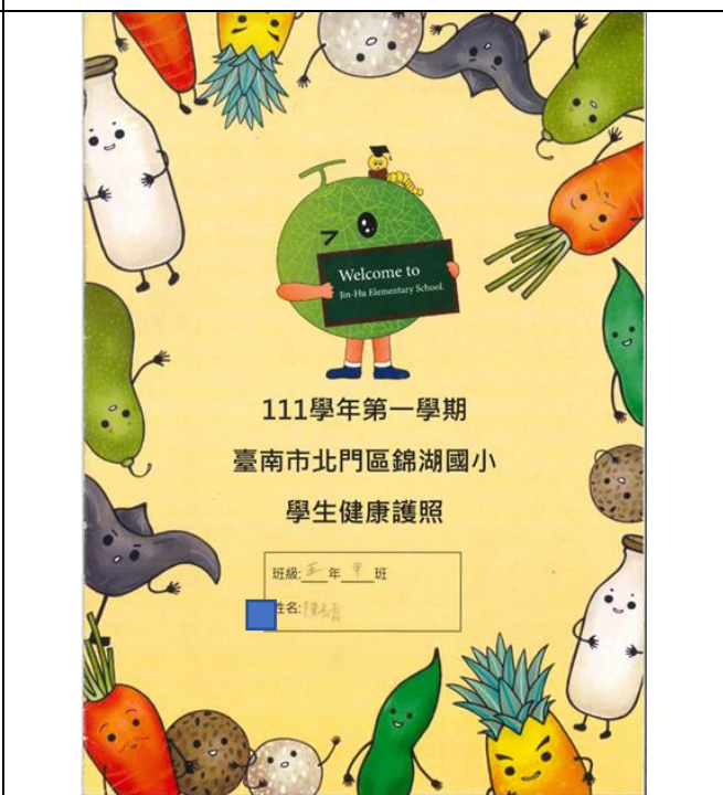
說明：運用健康護照登記每週運動時間