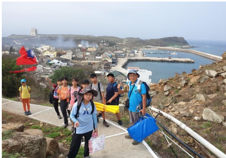
說明：結束東吉嶼海洋教育之旅