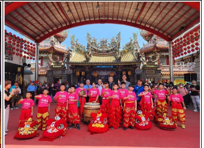
說明：醒獅戰鼓社團受邀至慈濟宮表演