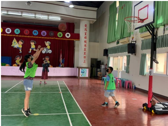
說明：參加大北門籃球錦標賽