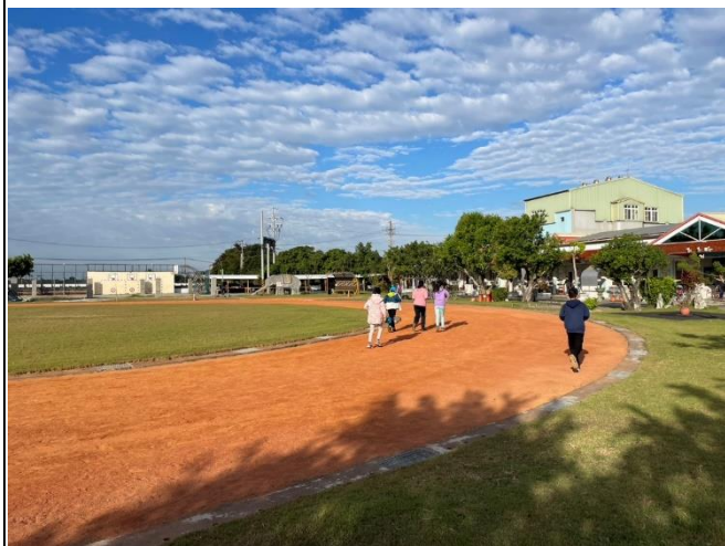
說明：晨間學生進行大跑步