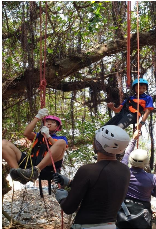
說明：繩結及攀樹教學