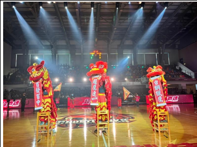
說明：醒獅戰鼓社團受邀至臺鋼獵鷹隊主場表演