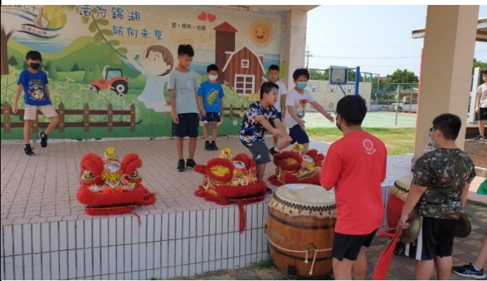
說明：醒獅戰鼓社團練習