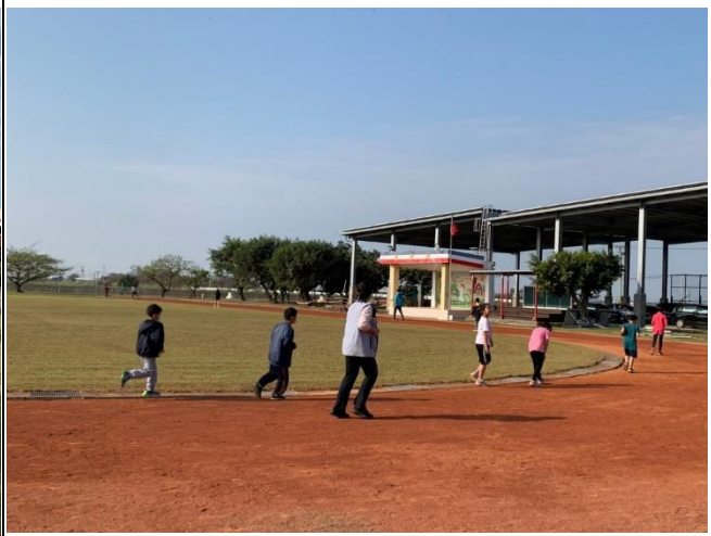
說明：師長帶領學生慢跑