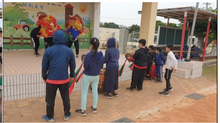
說明：醒獅戰鼓社團練習