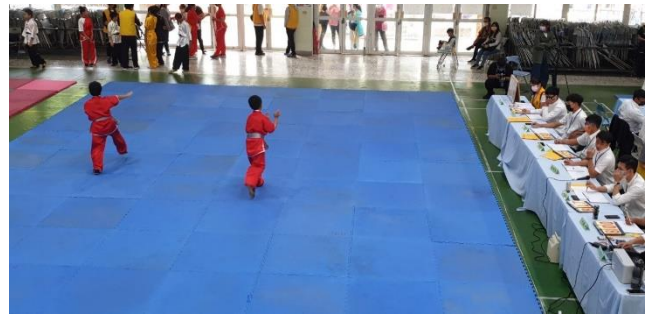
說明：武術比賽情形