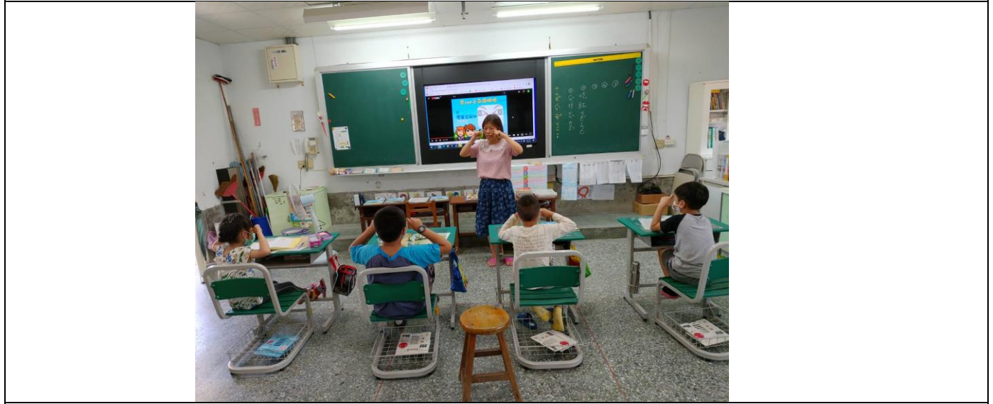
照片 2:一起做護眼操