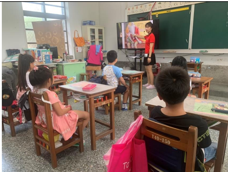
照片 1: 講解繪本內容