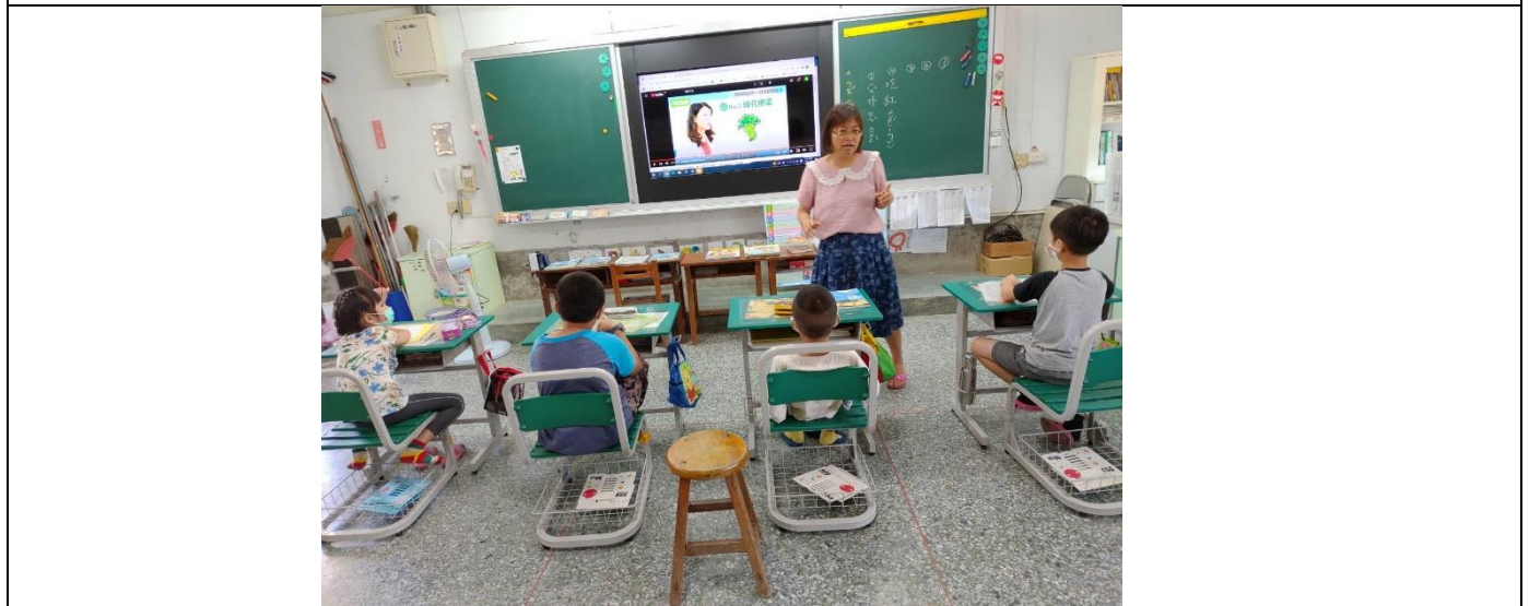
照片 1:討論能保護眼睛的食物