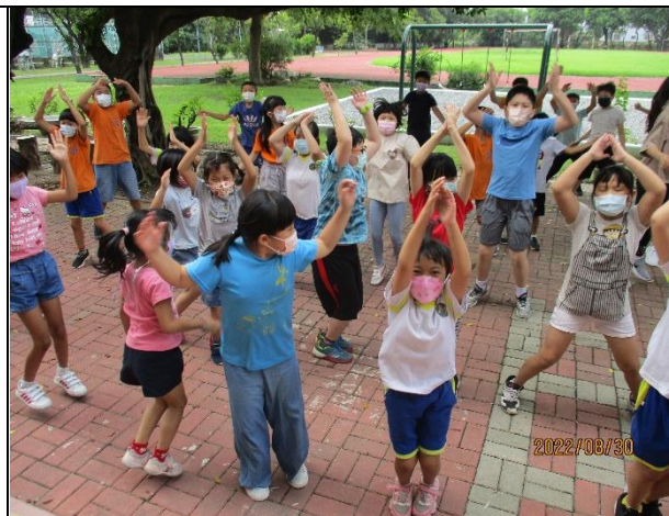
說明：每日學生課間跳躍活動練習。