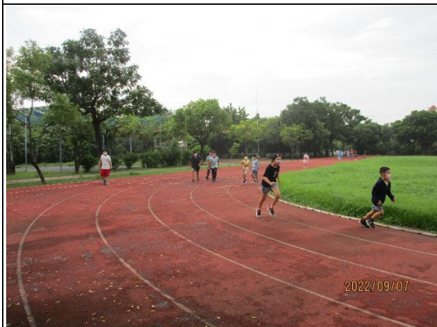
說明：每日學生晨間運動。