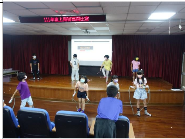
說明：期初與期末全校性跳繩比賽。