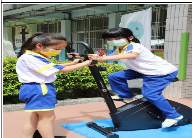
說明：期初與期末全校性飛輪比賽。