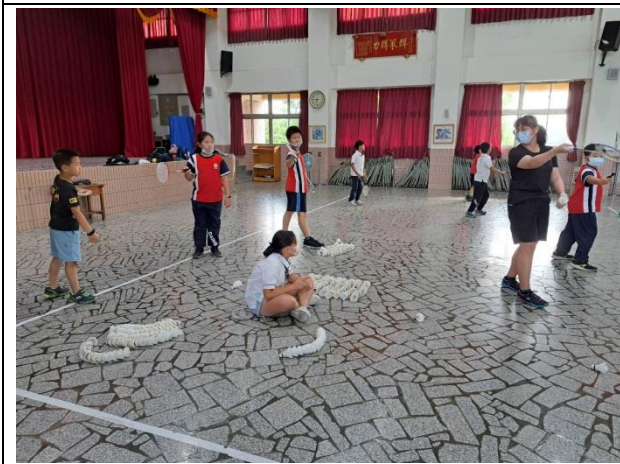
說明：羽球社團教學