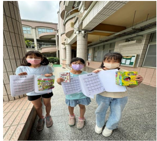
說明：健康護照集點獎勵