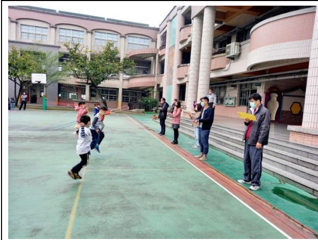
說明：辦理跳繩比賽