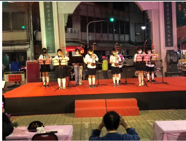
說明：受邀至新市永安宮晚會表演