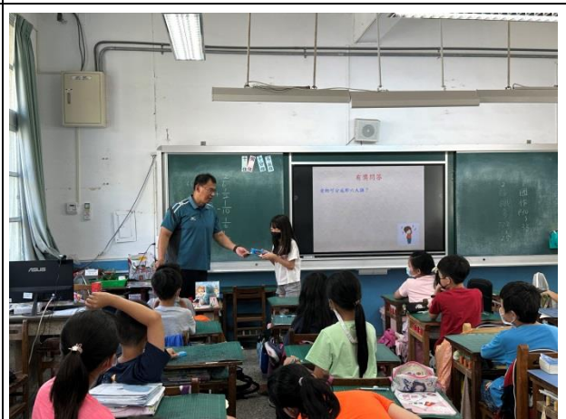
說明：健康吃、快樂動課程教學