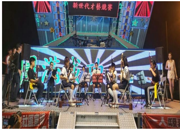
說明：受邀至社區內東勢北極殿晚會表演