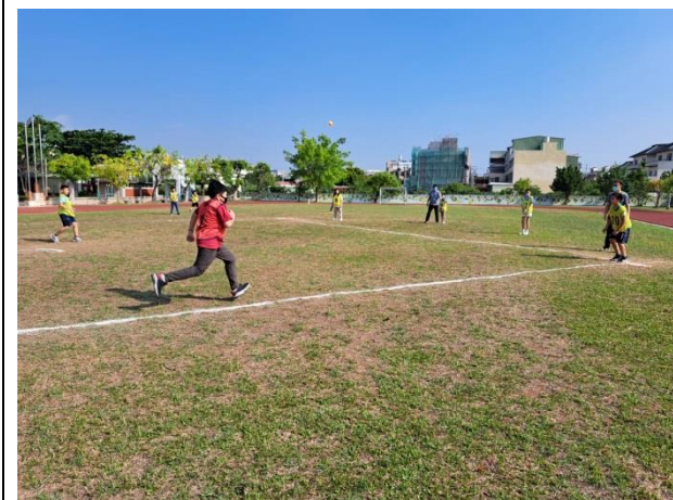
說明：五年級班際樂樂棒球比賽