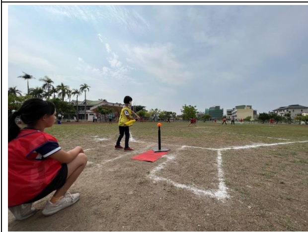
說明：三年級班際樂樂棒球比賽