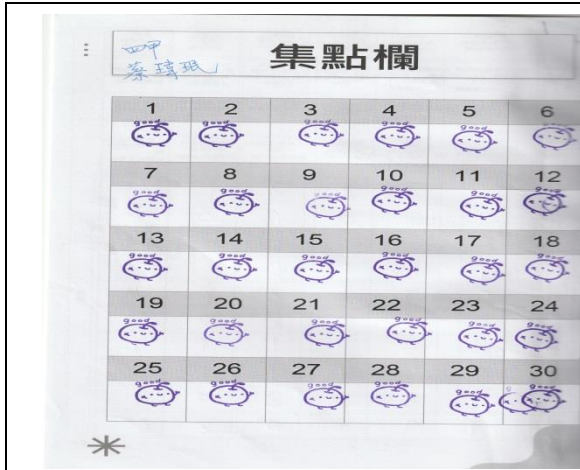
說明：學生健康護照集點好表現