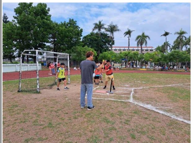
說明：六年級班際樂樂棒球比賽