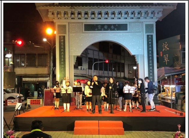
說明：受邀至新市永安宮晚會表演