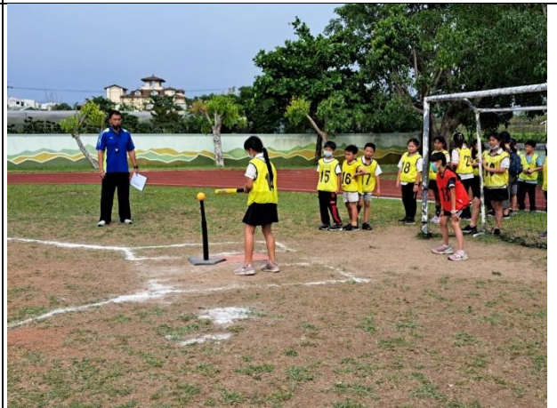
說明：四年級班際樂樂棒球比賽