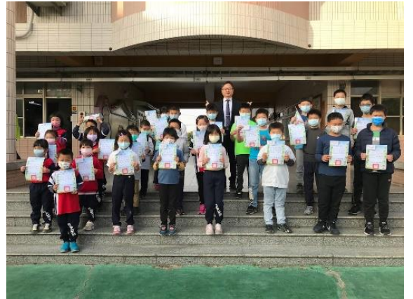
說明：跳繩比賽頒獎