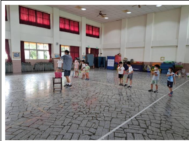
說明：迷你網球社團教學