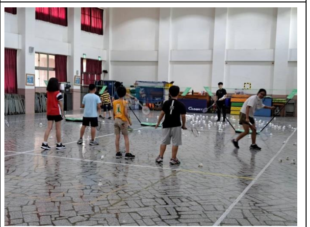
說明：羽球社團教學