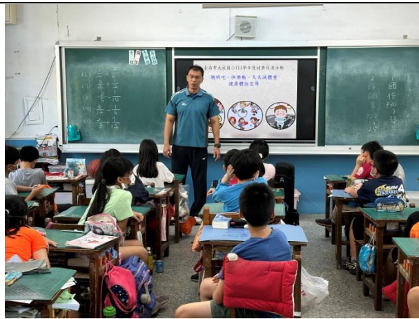
說明：健康吃、快樂動課程教學