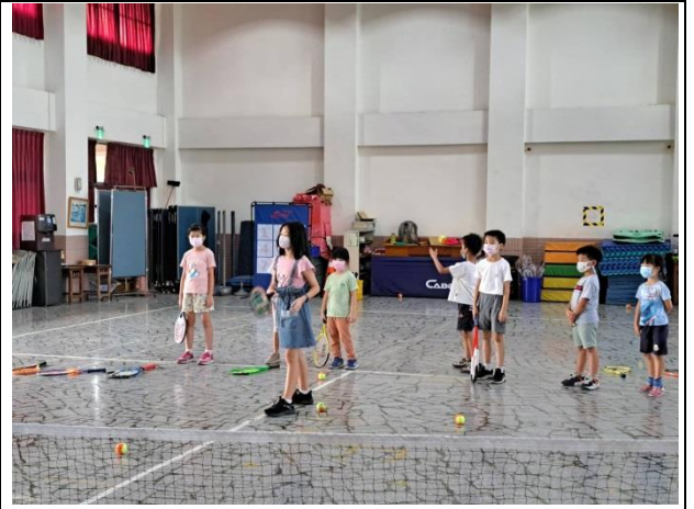
說明：迷你網球社團教學