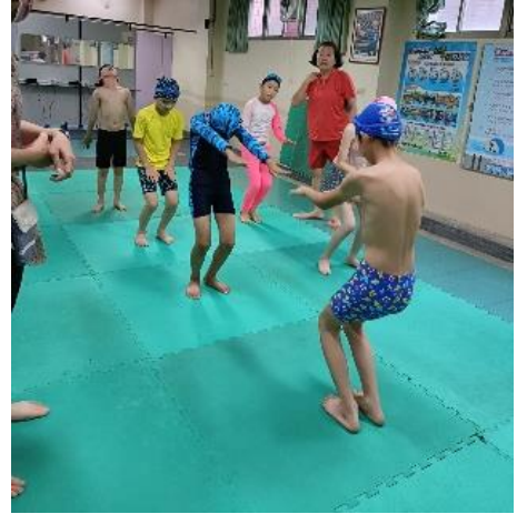
說明：陸上打水練習