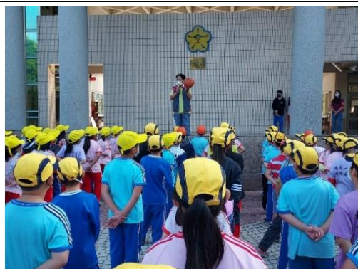
說明：朝會宣導健康體位 85110