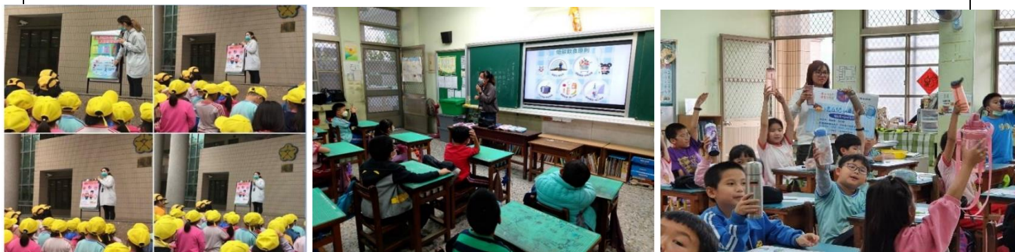
說明：衛生局辦理兒童健康宣導