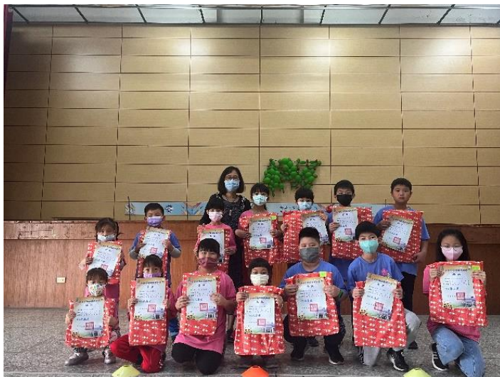
說明：頒獎肯定學生跳繩能力