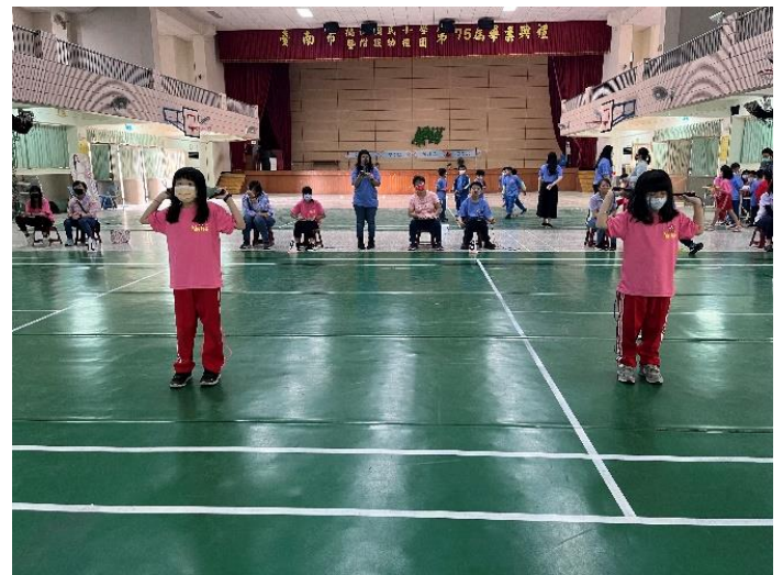
說明：低年級跳繩比賽