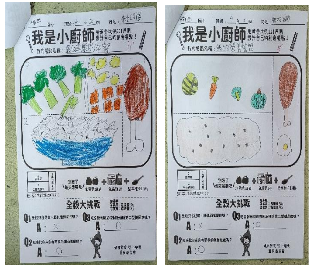
說明：「我是小廚師」營養餐盤設計