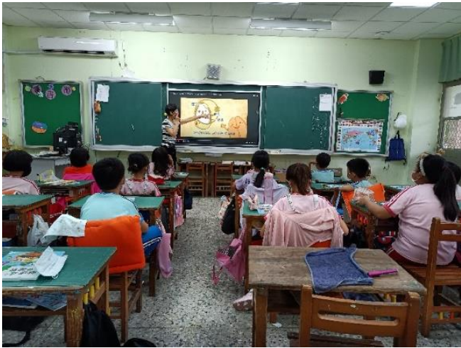
說明：「吃全穀顧健康」課程介紹