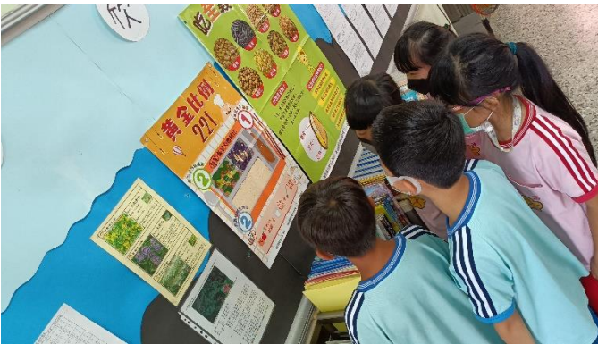
說明：「黃金比例 221」海報閱讀