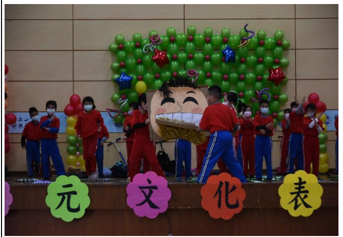
說明：潔牙好習慣表演