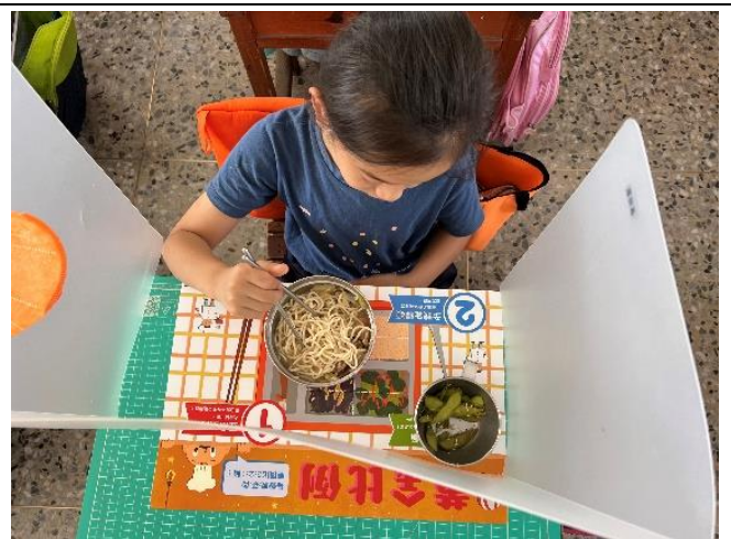
說明：「黃金比例 221」餐墊使用