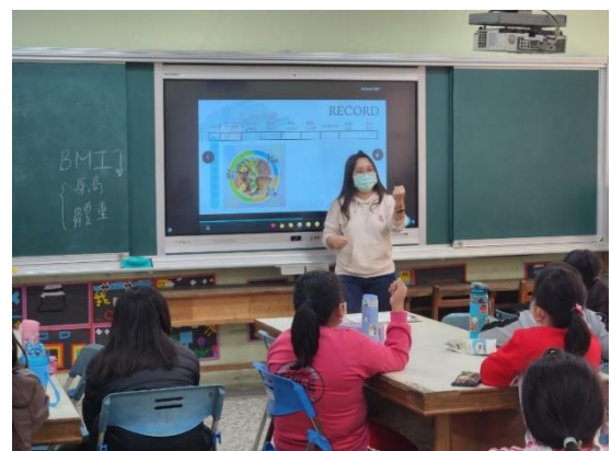
說明：營養課程—211 餐盤