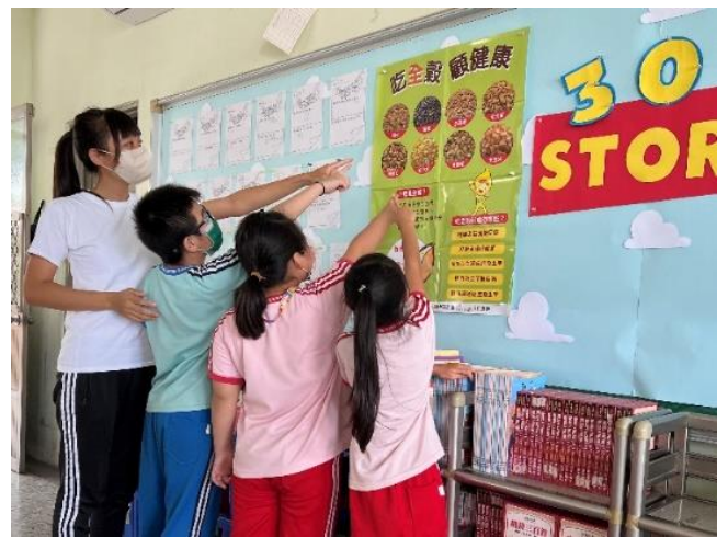
說明：「吃全穀顧健康」海報閱讀