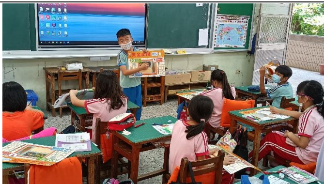
說明：「黃金比例 221」餐墊介紹