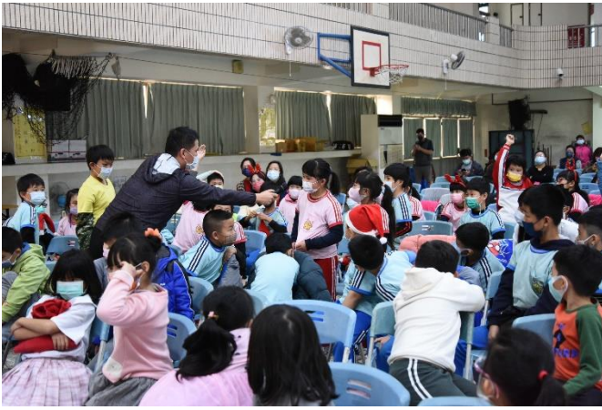
說明：健康促進有獎徵答