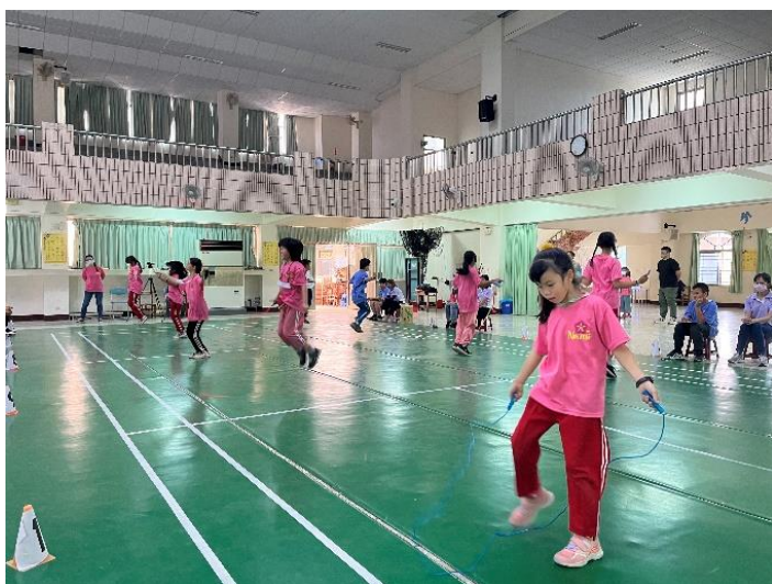
說明：中年級跳繩比賽