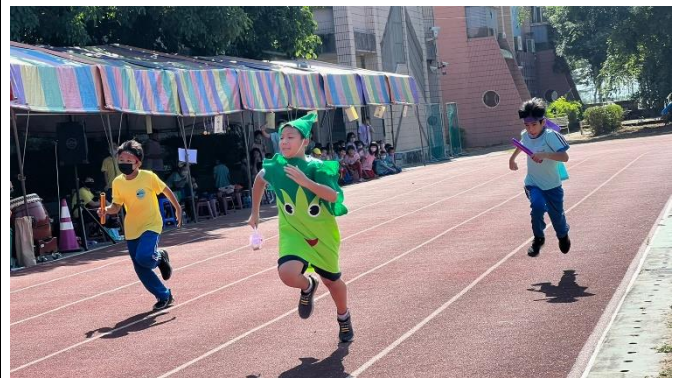
說明：健康飲食變裝