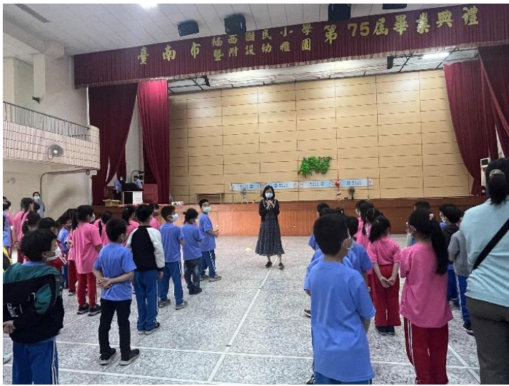
說明：校長開幕暨勉勵多運動