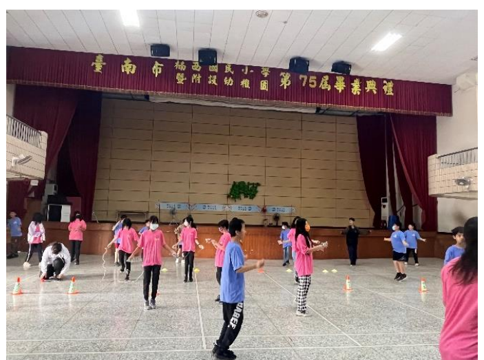
說明：高年級跳繩比賽