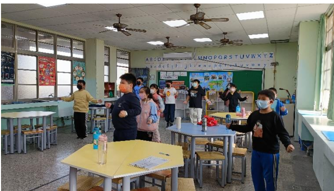
說明：有氧運動時間