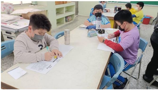
說明：填寫健康護照