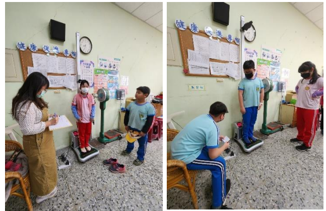
說明：定時測量身高體重