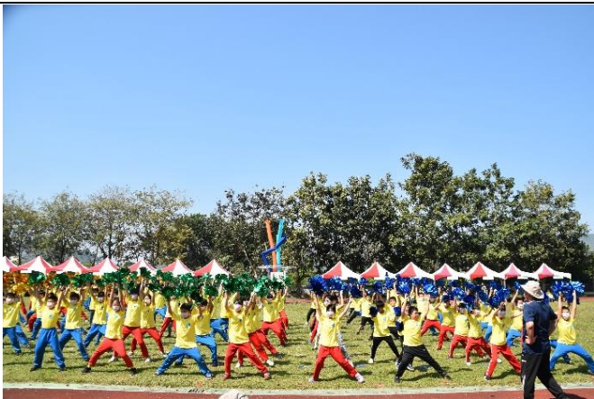
說明：大會舞與健康促進宣導