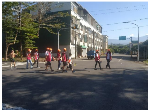
說明：踩街、親子健走活動