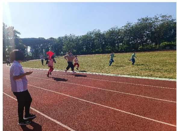
說明：師生百米挑戰賽