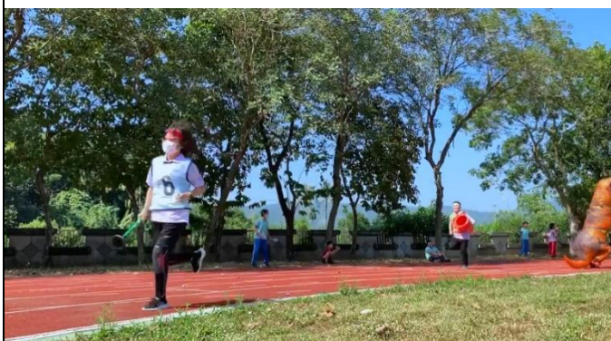
說明：師生大隊接力對抗賽