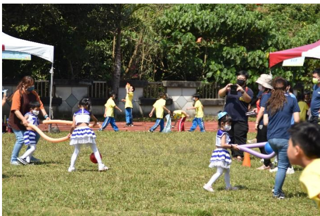
說明：親子闖關活動