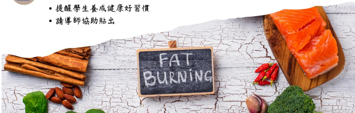
輔西國小111學年度第一學期午餐營養標示表