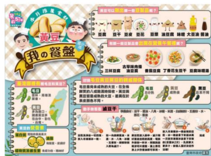
科學小學堂：黃豆含有很多蛋白質的結構