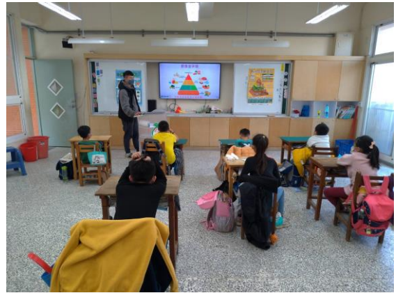
健體老師入班進行健康飲食教育課程(健康吃快樂動教材)