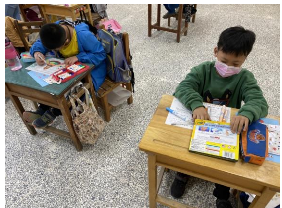
學生依課程所學完成學習單