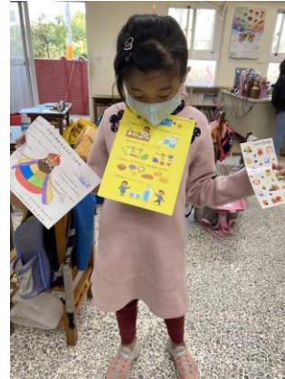
學習單優良及測驗第一名學生領取健康飲食教育文宣品小禮物