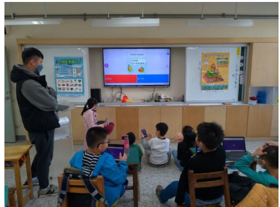
健康飲食教育課程課後測驗小競賽