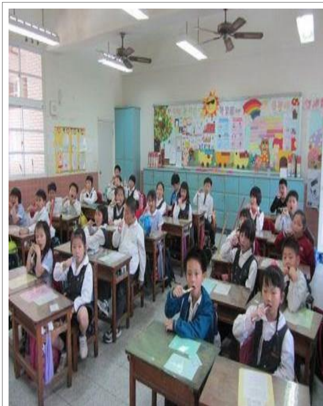
說明：午餐後潔牙活動（二年級）