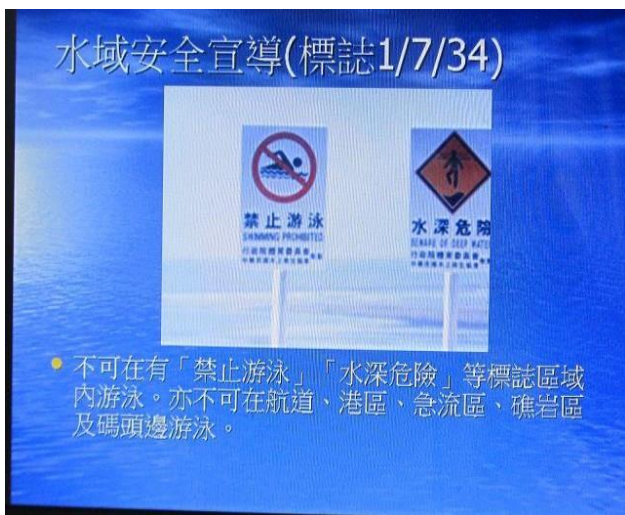
說明：不能在禁止標誌的水域戲水