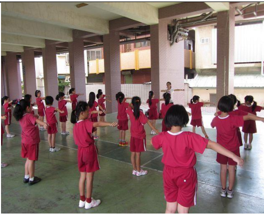
說明：舞蹈社社團練習