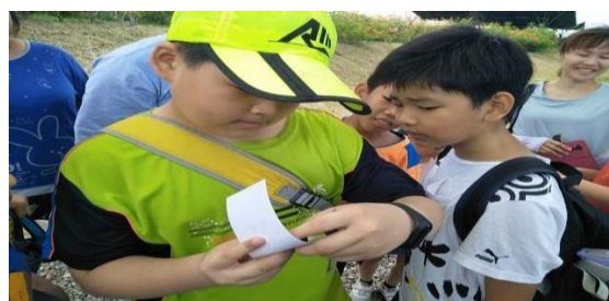
2. 照片簡述：介紹水質檢測的順序與結果判讀