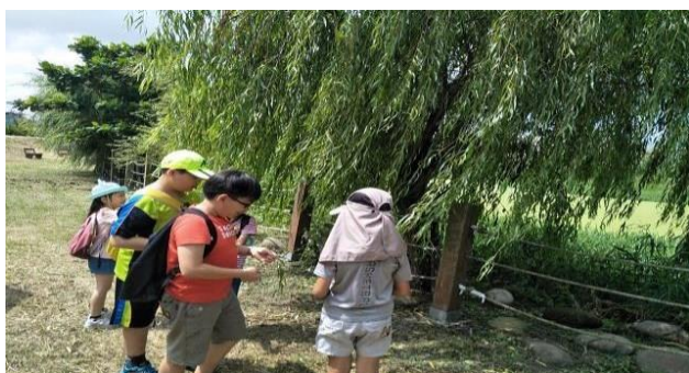
3. 照片簡述：介紹淨水廠的植物的特性