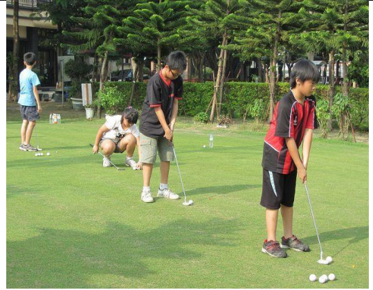
說明：高爾夫球社團練習