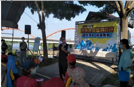
1. 照片簡述：侯副局長致詞

會議及活動簡述：以「愛川淨水、溪望無窮」為主題，舉辦「臺南市 2021 年世界水質監測競賽」活動，誠摯邀請各單位夥伴參與響應，共同以行動宣示對本市水體水域的守護