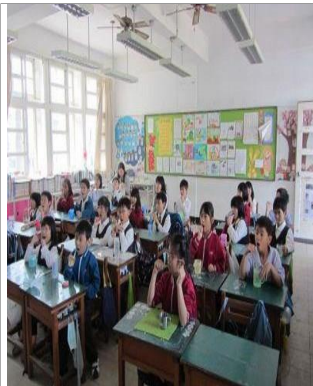
說明：午餐後潔牙活動（三年級）