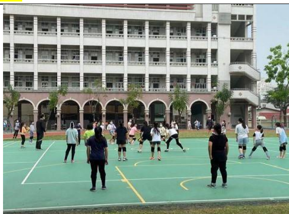
說明：女生躲避球社社團練習