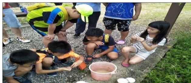
6. 照片簡述：學生取水作檢測