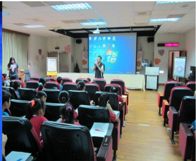
說明：體衛組長宣導戲水安全原則