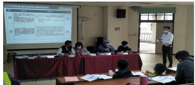
6. 照片簡述：提案討論