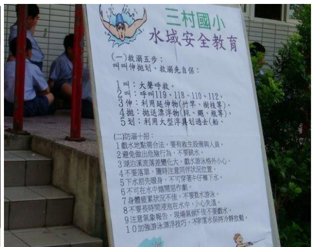
說明：學生晨會宣導水域安全教育