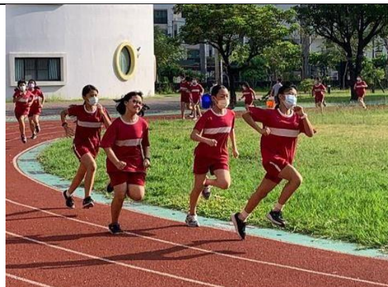
說明：田徑社社團練習