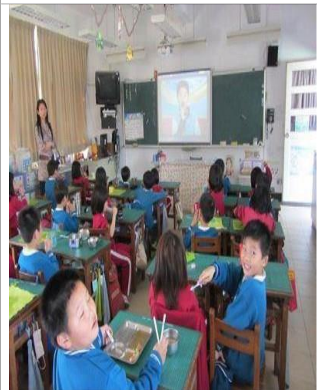
說明：午餐後潔牙活動（一年級）