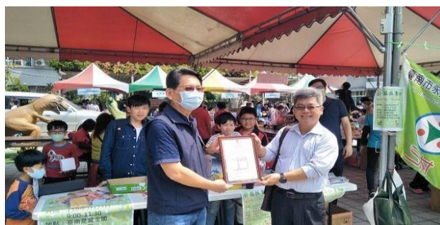
6. 照片簡述：環保局長頒發謝狀給校長