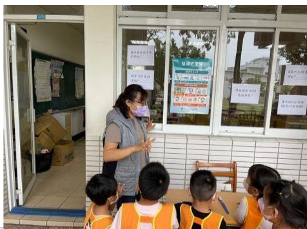
說明：護理師視力保健宣導