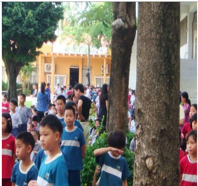
說明：宣導防溺十招