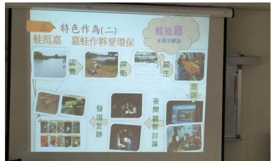
4. 照片簡述：嘉義上林水環境志工隊經驗分享