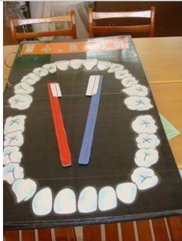
說明：小頭軟毛的牙刷