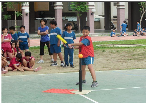
說明：樂樂棒球社社團練習