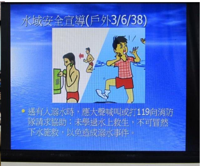
說明：有人溺水立即打 119