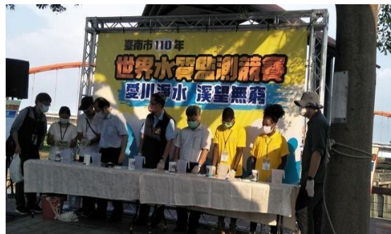
4. 照片簡述：水質檢測