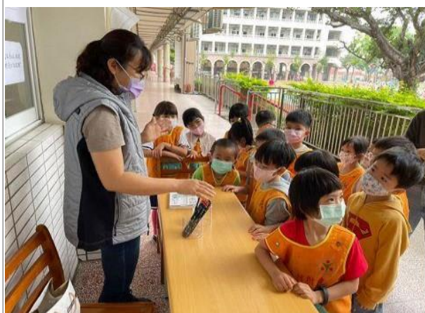
說明：護理師視力保健宣導