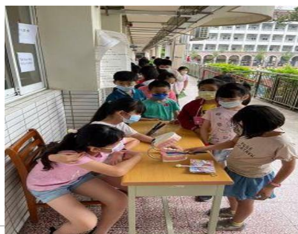
說明：學生動手做正確刷牙步驟