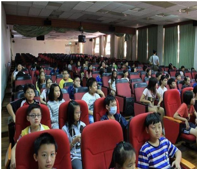
說明：高年級學生到場聽課