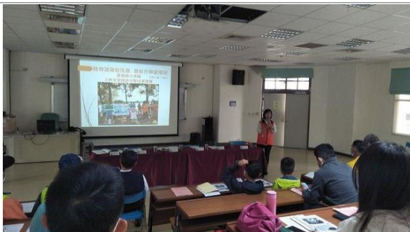
3. 照片簡述：嘉義上林水環境志工隊經驗分享