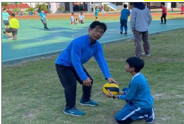
說明：男生躲避球社社團練習