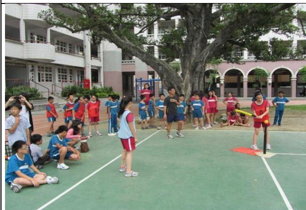
說明：樂樂棒球社社團練習