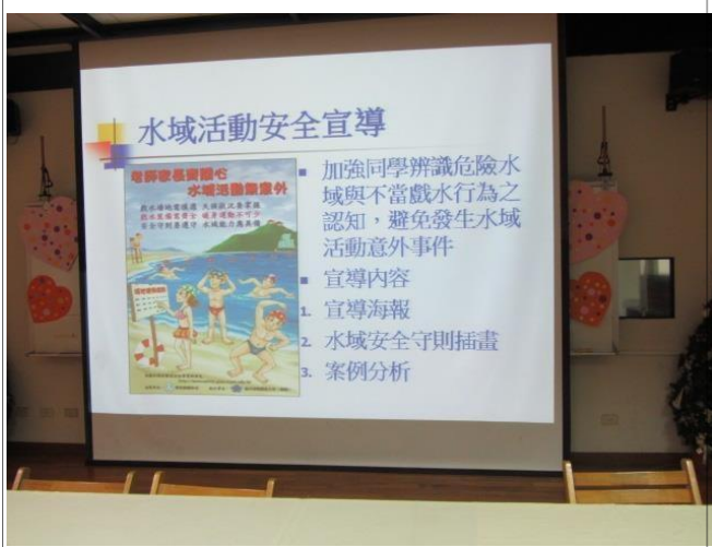
說明：水域安全宣導