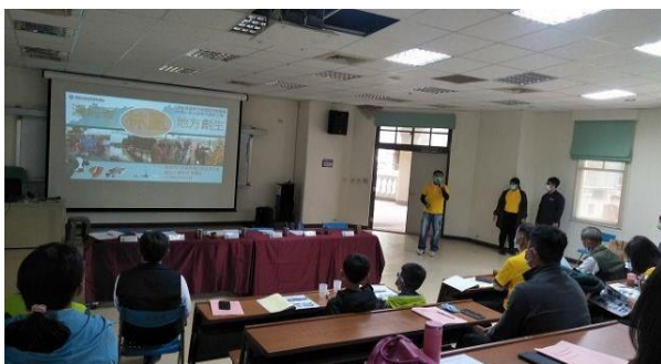
5. 照片簡述：林鳳社區水環境志工隊經驗分享