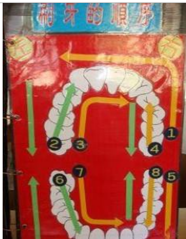
說明：貝氏刷牙法的刷牙順序