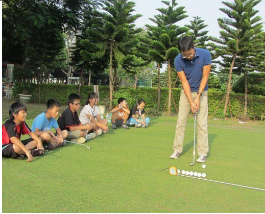
說明：高爾夫球社團練習