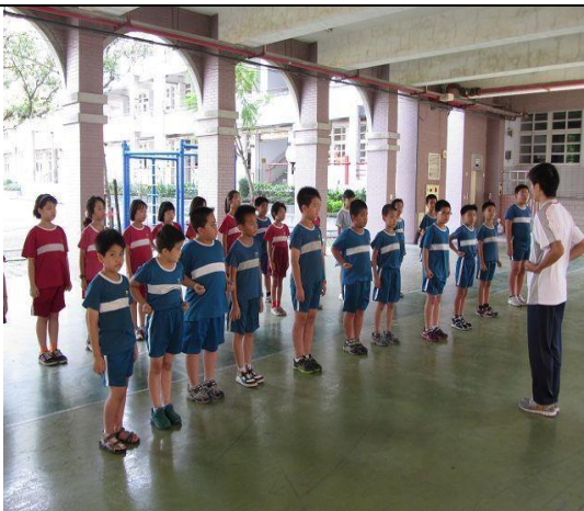
說明：武術社社團練習