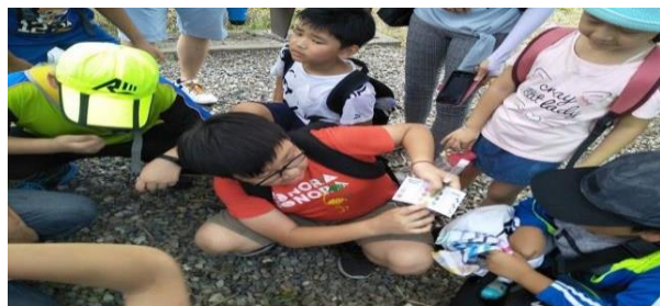
5. 照片簡述：學生取水作檢測