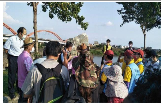
2. 照片簡述：介紹二仁溪的故事