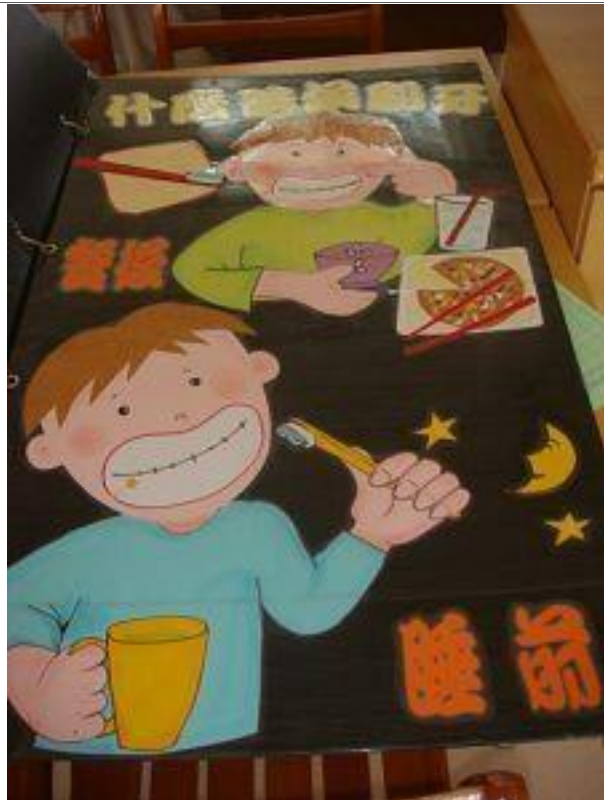
說明：貝氏刷牙法的道具