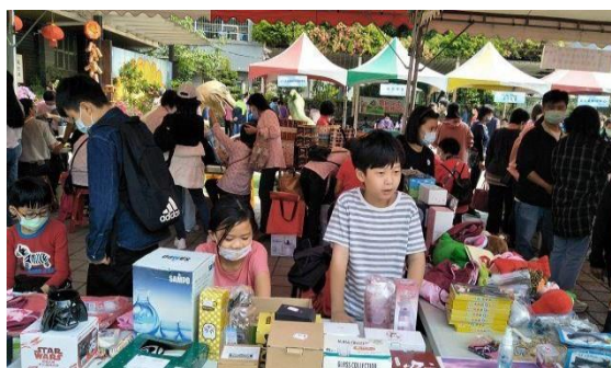
4. 照片簡述：學生叫賣