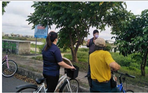
6. 照片簡述：分組活動