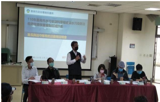
1. 照片簡述：侯副局長致詞