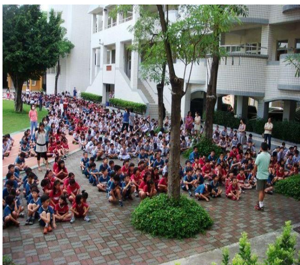
說明：宣導防溺十招