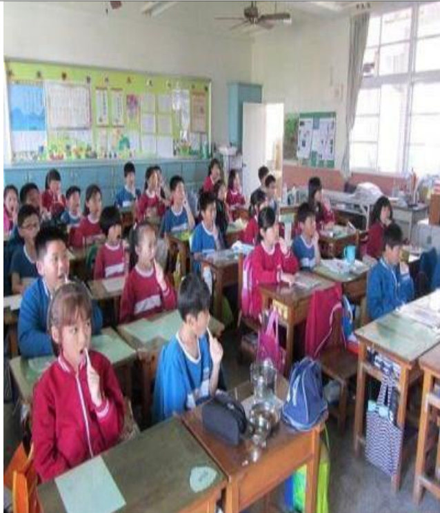
說明：午餐後潔牙活動（四年級）