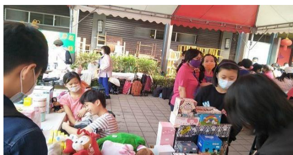
1. 照片簡述：本校學生擺攤參加義賣活動

會議及活動簡述：結合環保局進行環境教育，做二手物愛心義賣活動，將義賣所得捐給弱勢團體。