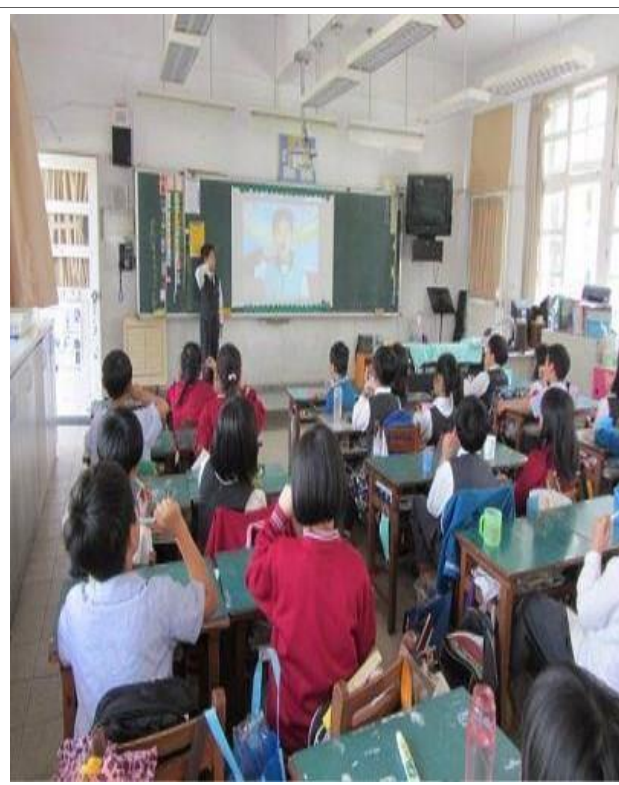
說明：午餐後潔牙活動（三年級）