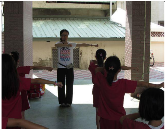
說明：舞蹈社社團練習