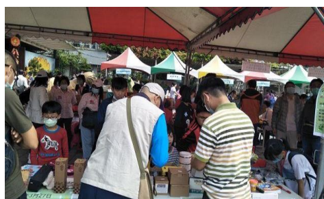
2. 照片簡述：招呼客人