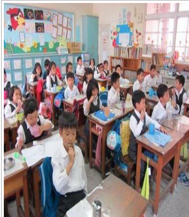
說明：午餐後潔牙活動（四年級）