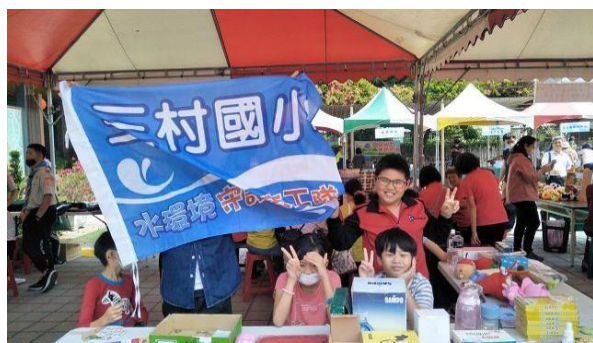
5. 照片簡述：學生合影