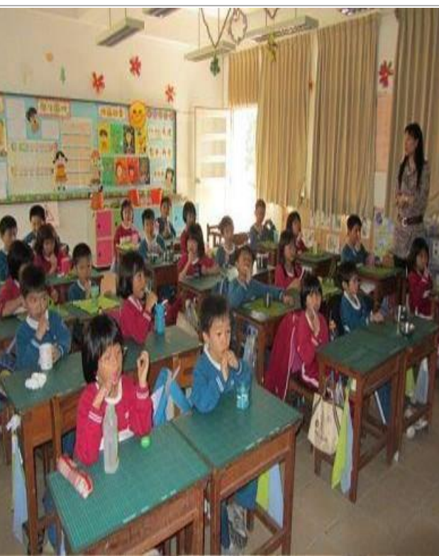
說明：午餐後潔牙活動（一年級）