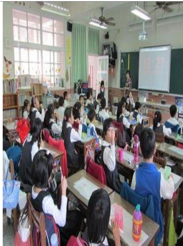
說明：午餐後潔牙活動（二年級）