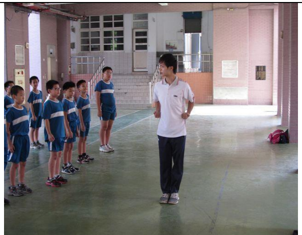
說明：武術社社團練習