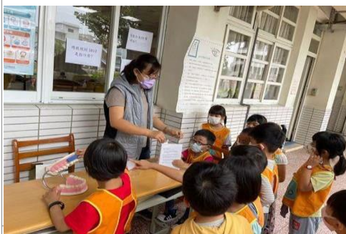
說明：學生動手做正確刷牙步驟