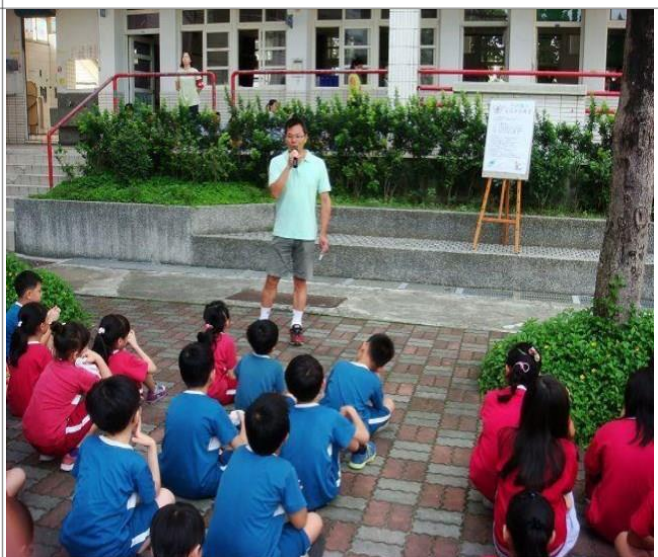
說明：宣導防溺十招與學生互動