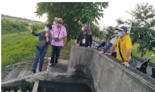
5. 照片簡述：分組活動