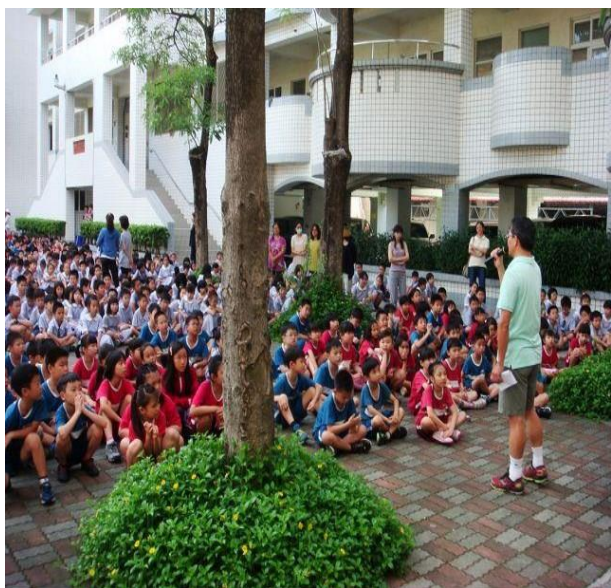
說明：救溺五步「叫叫伸拋划」