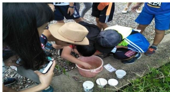
4. 照片簡述：學生取水作檢測