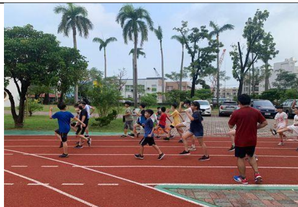
說明：田徑社社團練習