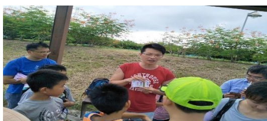
1. 照片簡述：介紹水質檢測的順序