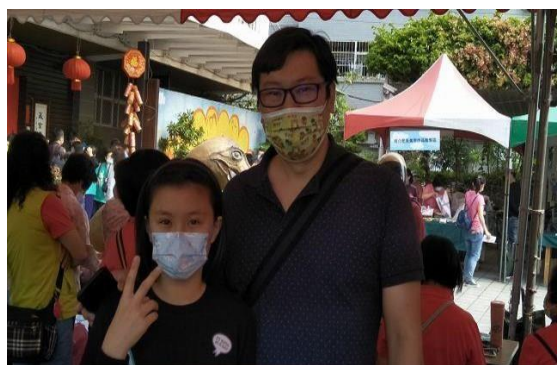
3. 照片簡述：家長熱心參與-父女合影