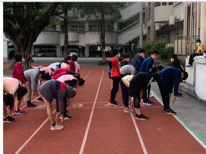
體育課安排體適能檢測項目教學與練習_肢體前彎