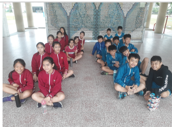
週三下午練習田徑