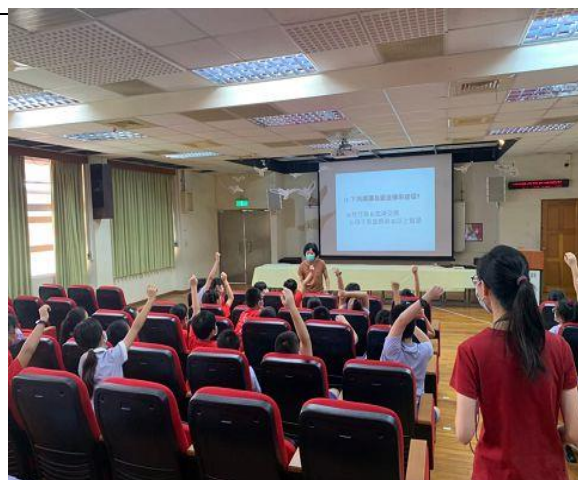
說明：學生舉手搶答