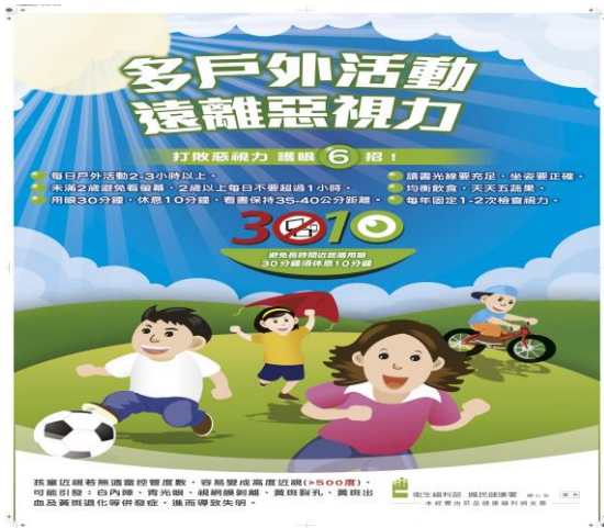
說明：視力保健海報