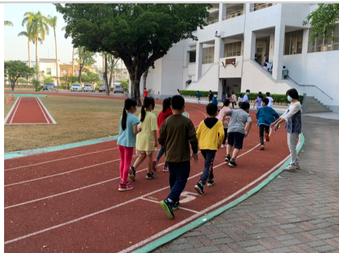
體育課安排體適能檢測項目教學與練習_跑走