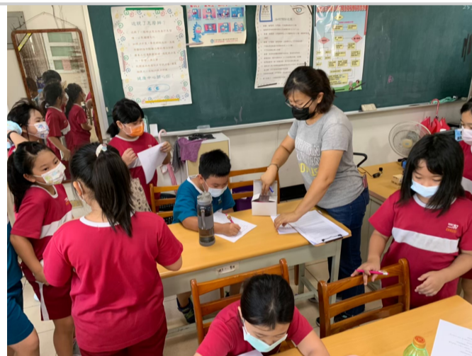
均衡飲食及營養教育議題課程_問卷