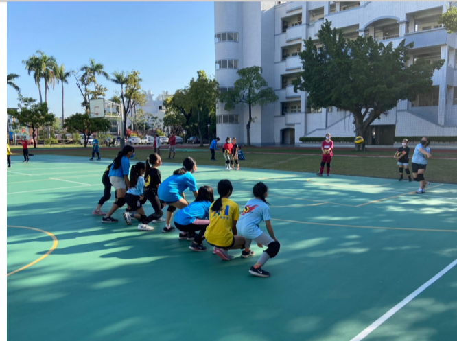
教師指導學生於課間時間進行體能活動_躲避球