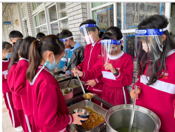
班級定量打菜，鼓勵學童嘗試多元而營養均衡料理