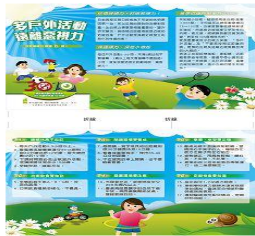
說明：視力保健海報