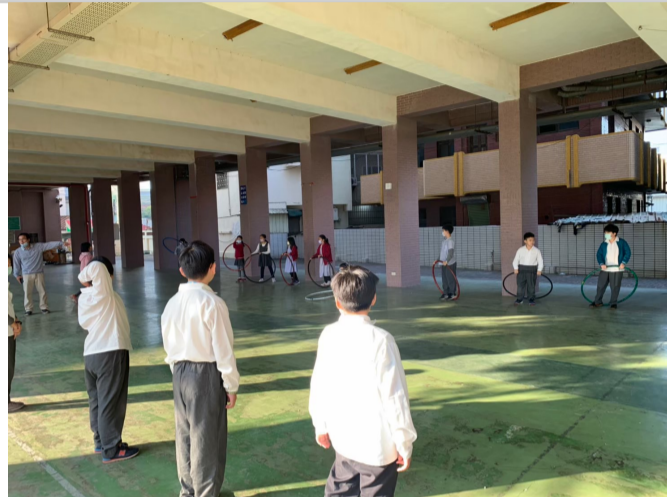
教師指導學生於課間時間進行體能活動_哈啦圈