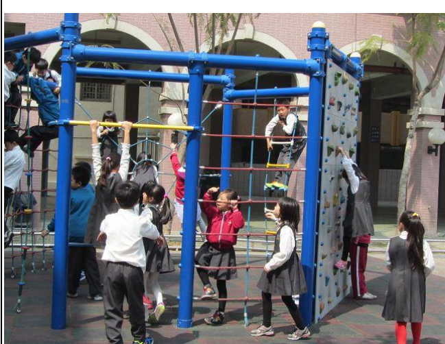
說明：下課淨空做活動