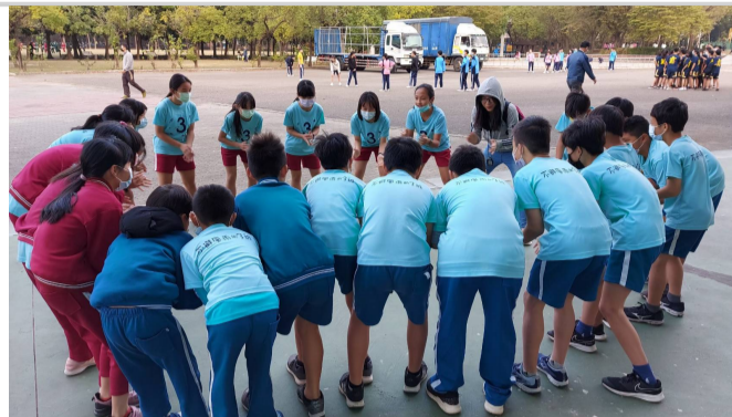
參加110年全市大隊接力-熱身