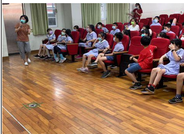
說明：愛滋病的知識介紹