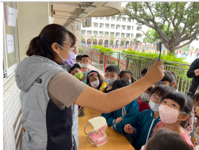
全校推動餐後潔牙，建立衛生習慣 (2)