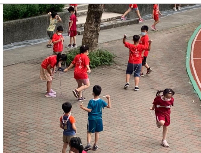
相關體適能活動_跳繩