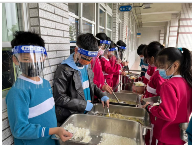
班級定量打菜，鼓勵學童嘗試多元而營養均衡料理 (2)