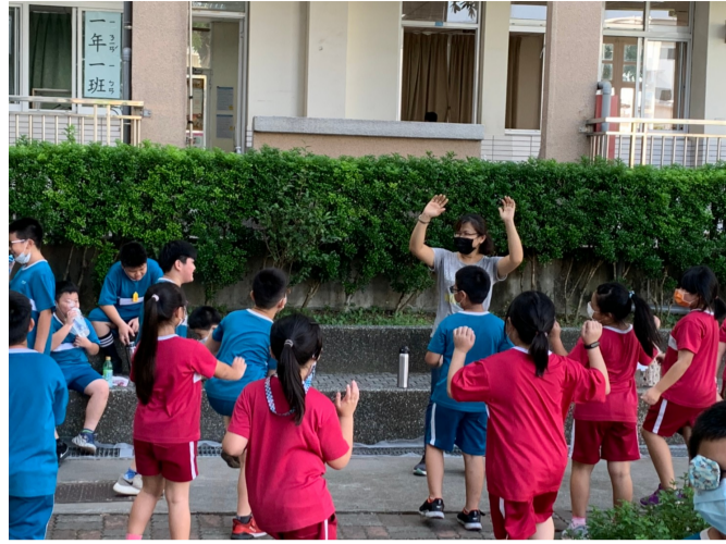
利用晨間時間進行體能活動_體操