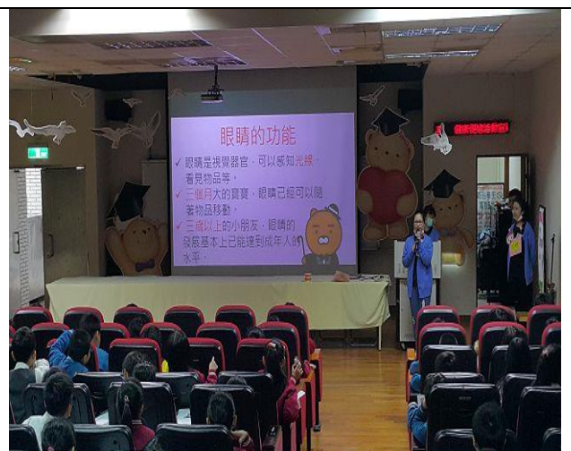
說明：結合中華醫事護理系到校宣導