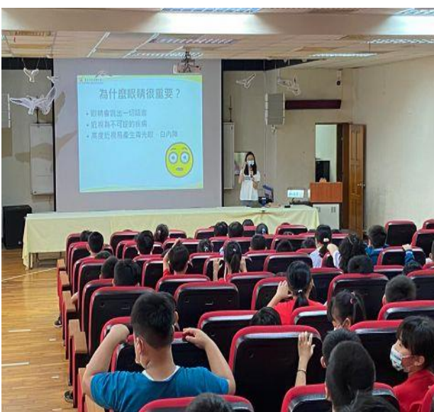
說明：三年級視力保健宣導