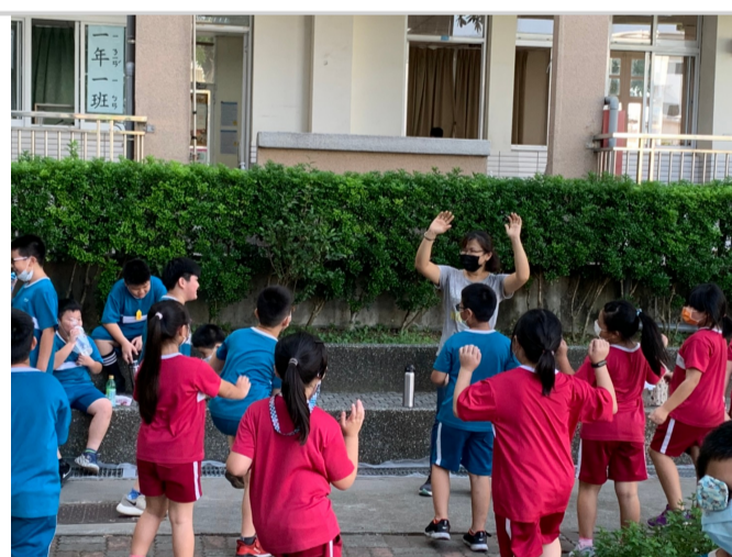
相關體適能活動_體操