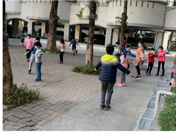
利用晨間時間進行體能活動_跳繩