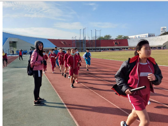
參加110年全市大隊力-接棒練習