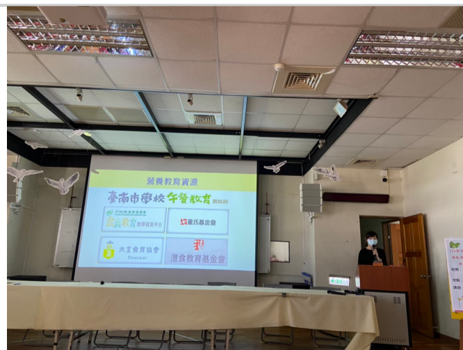
台南市午餐教育宣導