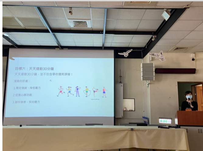
健康護照指標宣導1