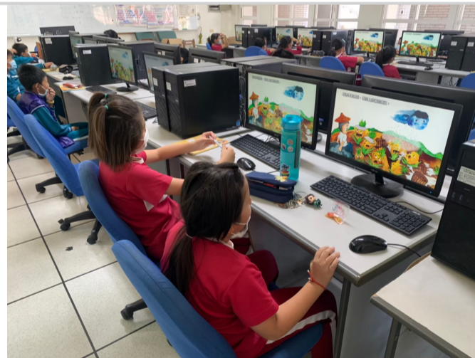
班級利用餐前或相關課程，透過午餐教育資訊網教材實施餐前教育3