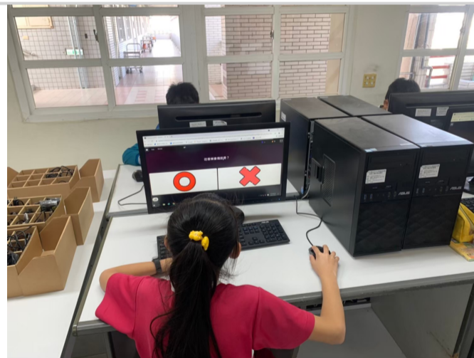
學期中根據影片內容辦理有獎徵答