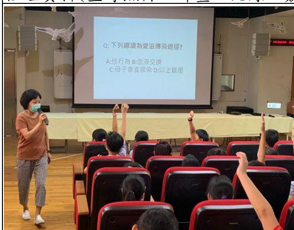
說明：愛滋病的傳染途徑