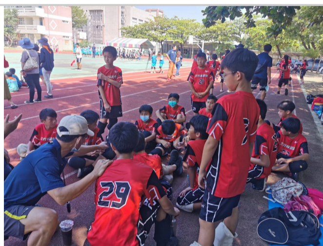
參加校際躲避球賽