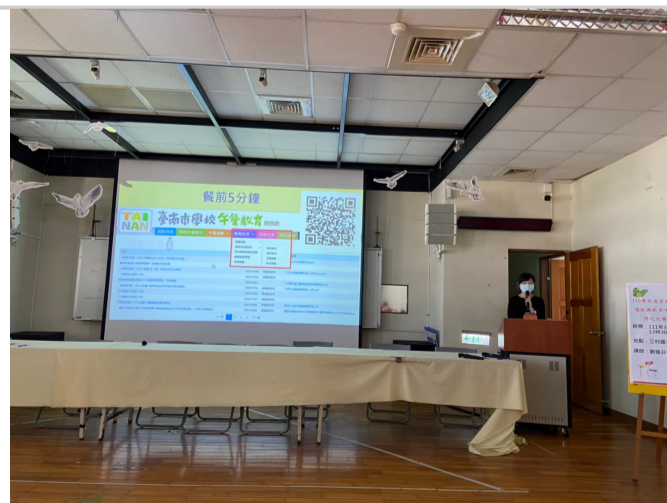
餐前5分鐘教師宣導