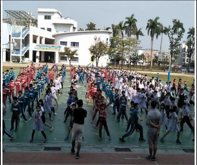
說明：升旗做健身操