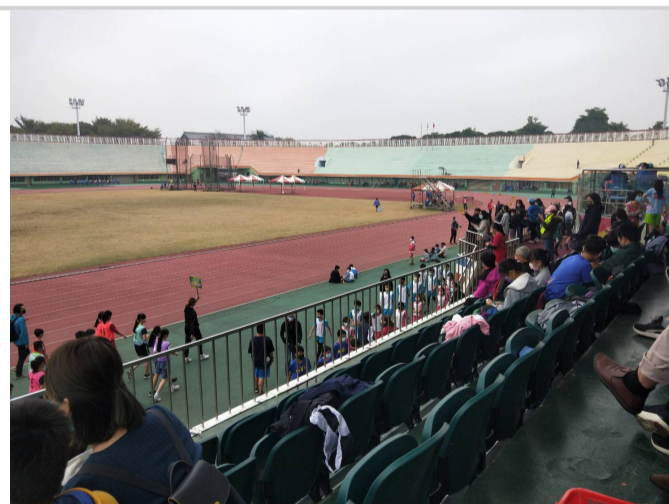
參加111年全市大隊接力 (2)