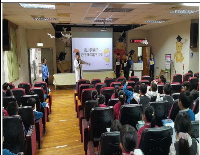
說明：結合中華醫事護理系到校宣導