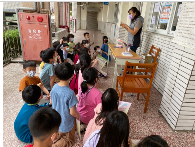
全校推動餐後潔牙，建立衛生習慣