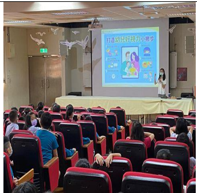
說明：三年級視力保健宣導