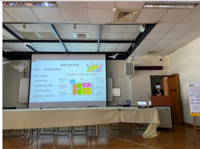
健康護照指標宣導2