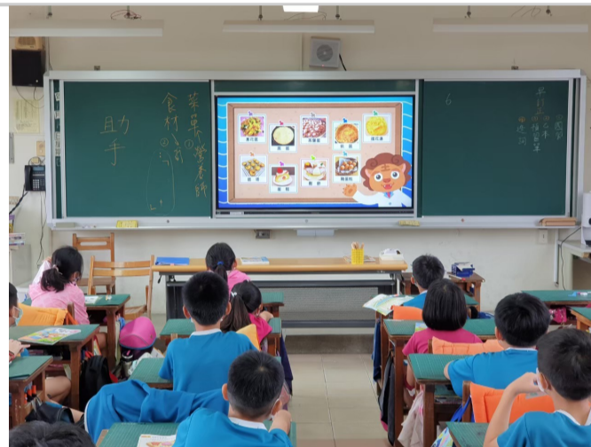
班級利用餐前或相關課程，透過午餐教育資訊網教材實施餐前教育2