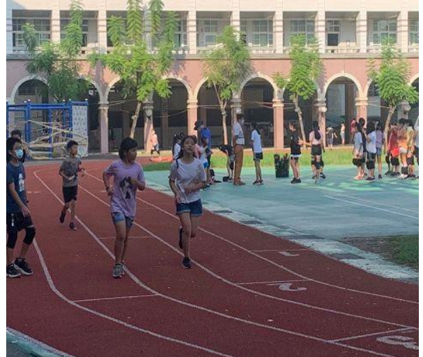
說明：sh150 活動學生課間跑步