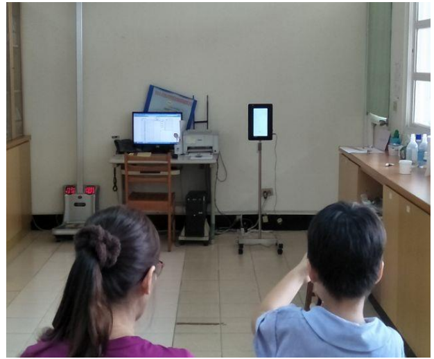
說明：護理師測量學生視力