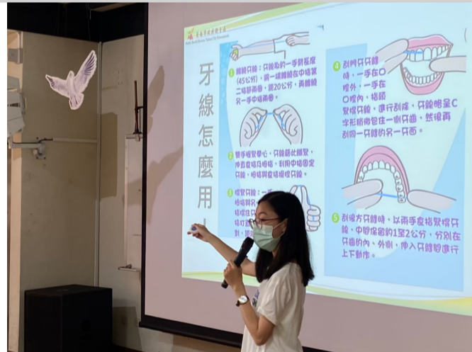
健康口腔衛生融入相關課程宣導2