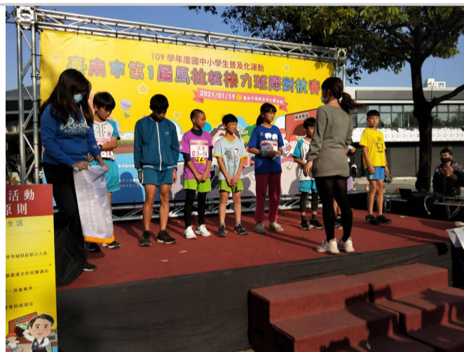
參加110年全市馬拉松接力