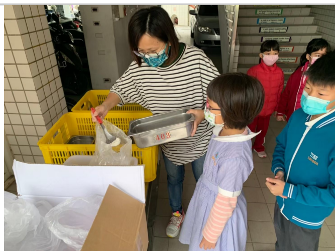
廚房根據各班飲食與剩食狀況，配