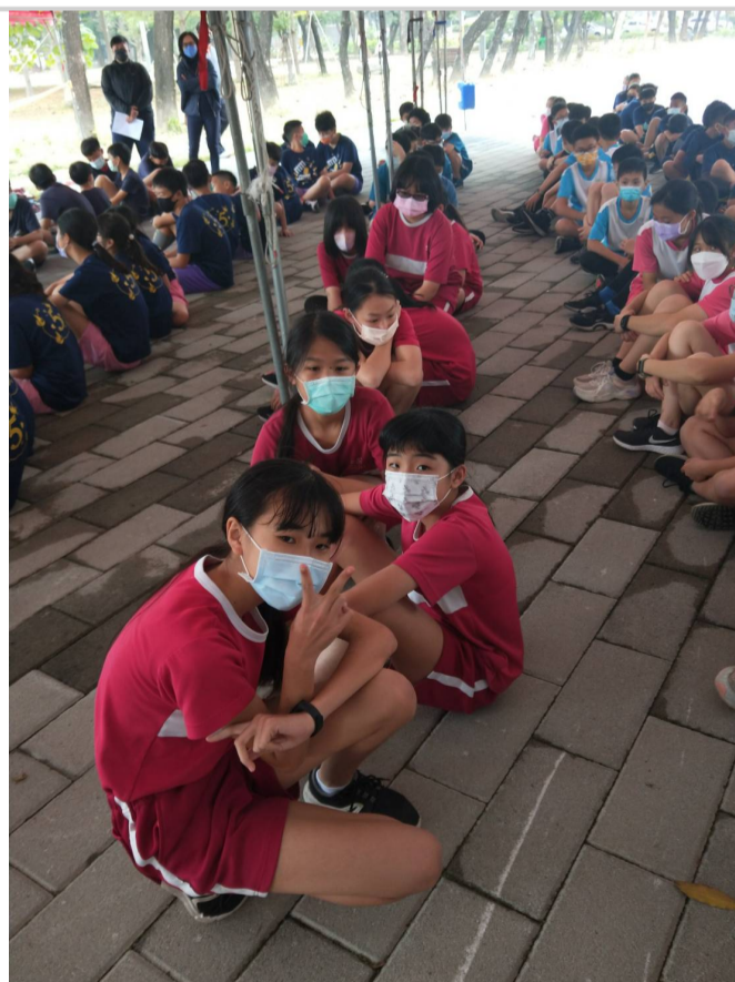
參加111年全市大隊接力