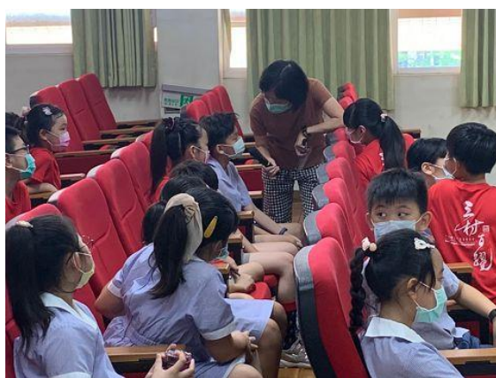
說明：學生舉手搶答