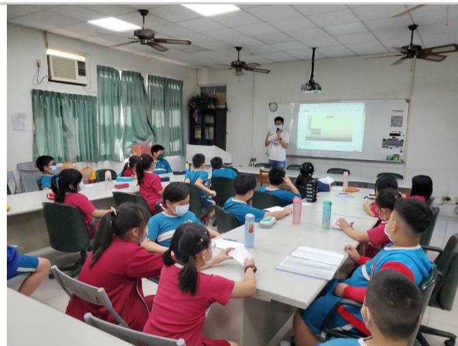
班級利用餐前或相關課程，透過午餐教育資訊網教材實施餐前教育