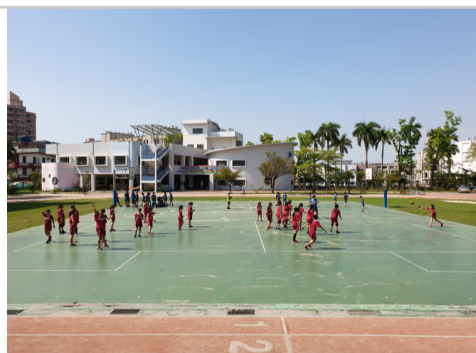
利用晨間辦理學生躲避球賽