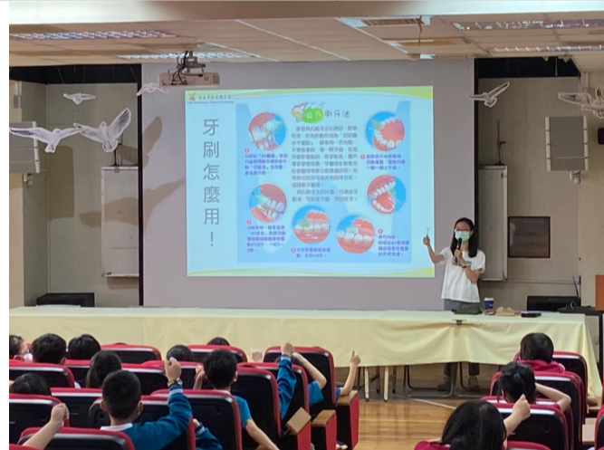
健康口腔衛生融入相關課程宣導