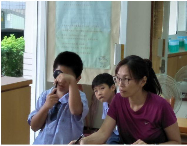
說明：護理師測量學生視力