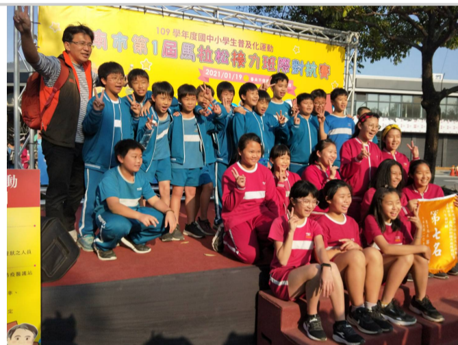
參加110年全市馬拉松接力 (2)