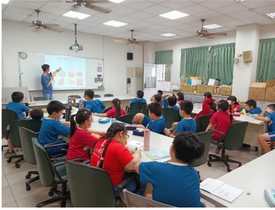
說明：課程講授與學習