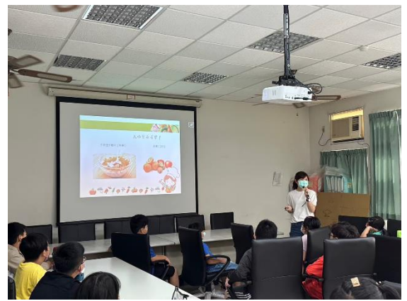
說明：課程講授與學習