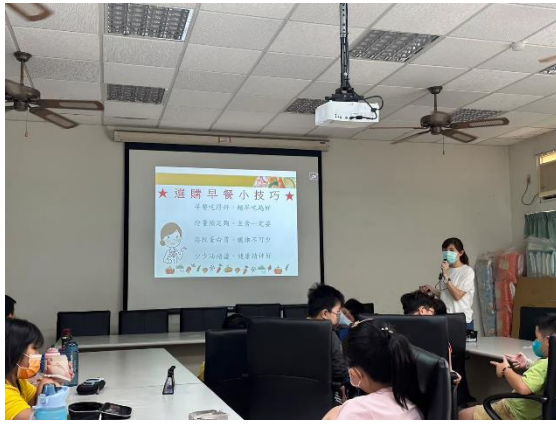
說明：課程講授與學習