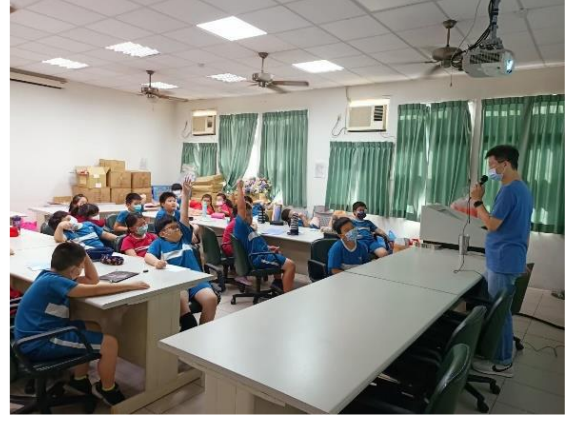
說明：課程講授與學習