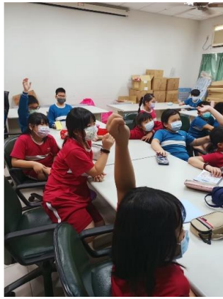
說明：課程講授與學習