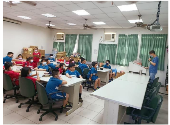
說明：課程講授與學習