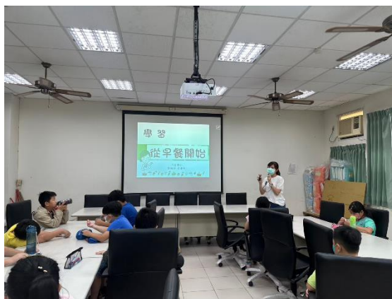
說明：課程講授與學習