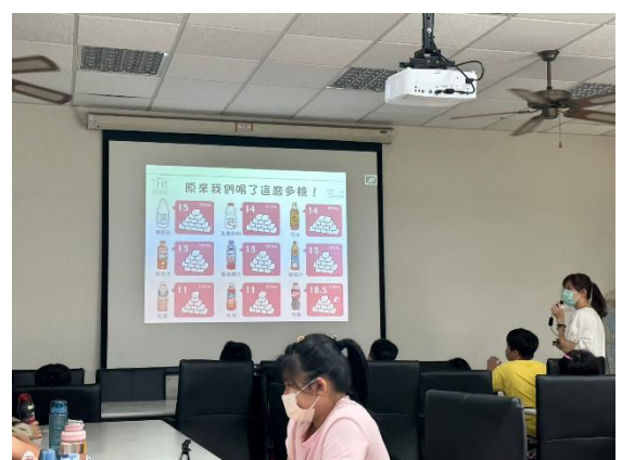
說明：課程講授與學習