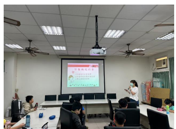
說明：課程講授與學習