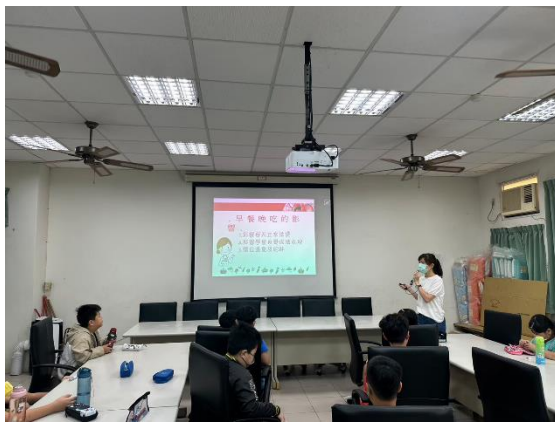
說明：課程講授與學習