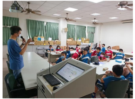
說明：課程講授與學習