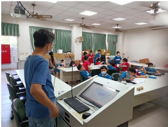
說明：課程講授與學習