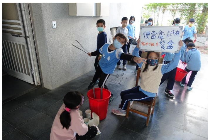
全校垃圾分類、星期二中午資源回收