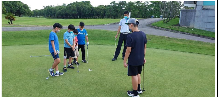
課後才藝班 -高爾夫球營隊