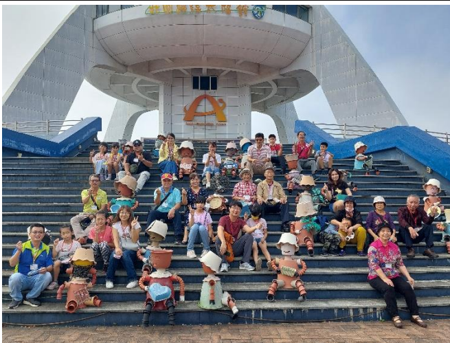
校長帶領家長會志工聯誼北回歸線太陽館、故宮南院參訪