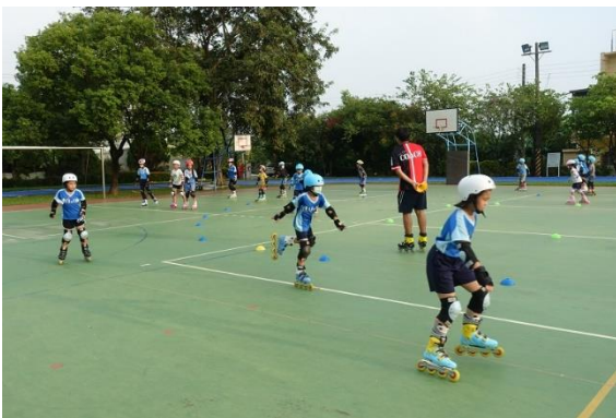
課後才藝班 -直排輪社