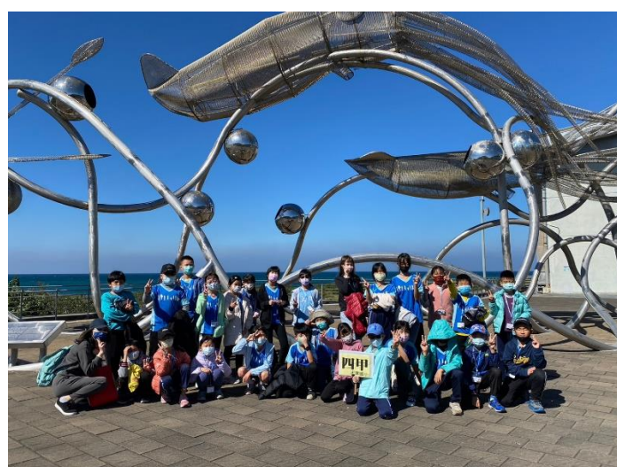
全校海生館一日遊