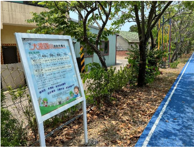
操場張貼運動熱量估算表、看我跑了消耗多少熱量