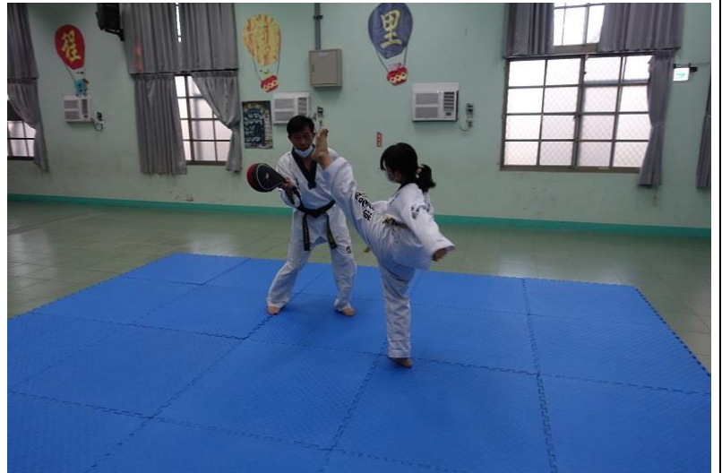
課後才藝班 -跆拳道社