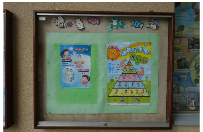
張貼健促相關議題海報