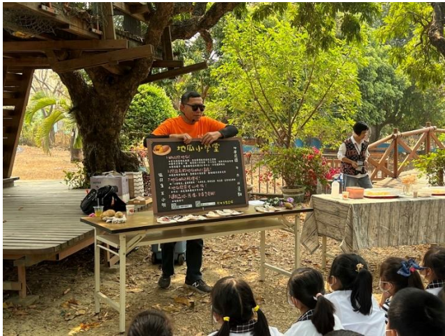
長榮大學到校食農教育教育課程