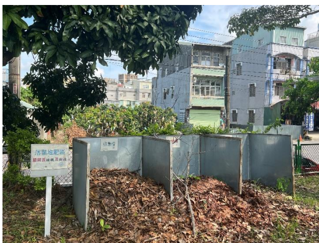
落葉堆肥、節能減碳永續資源