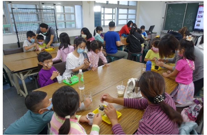
辦理化身綠手指親子玩園藝