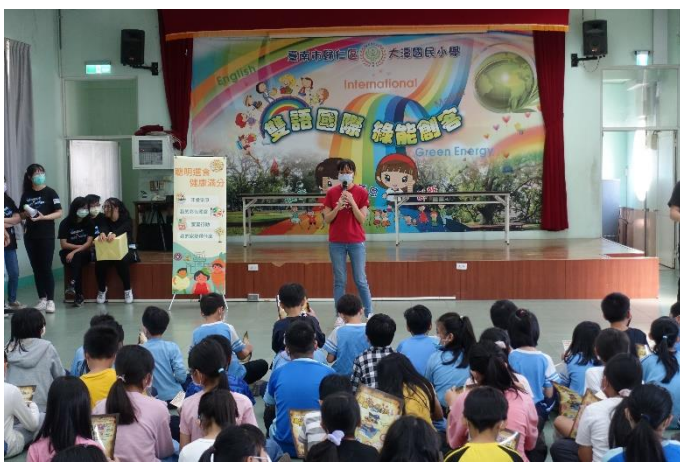
長榮大學辦理營養教育闖關活動