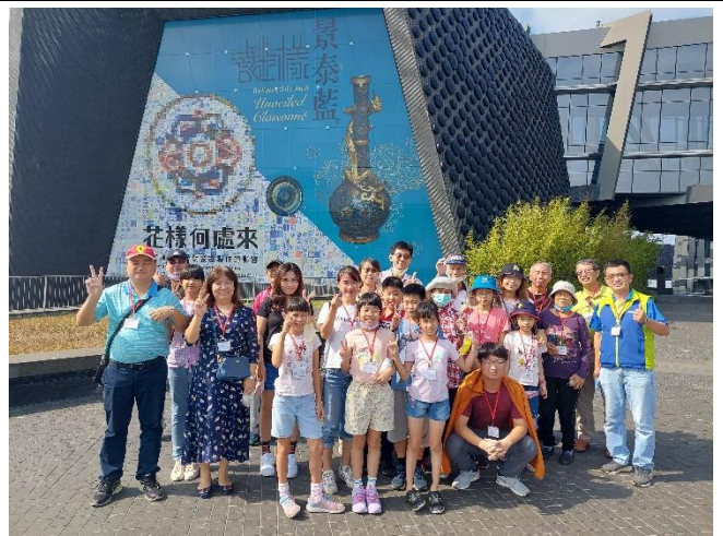
校長帶領家長會志工聯誼北回歸線太陽館、故宮南院參訪