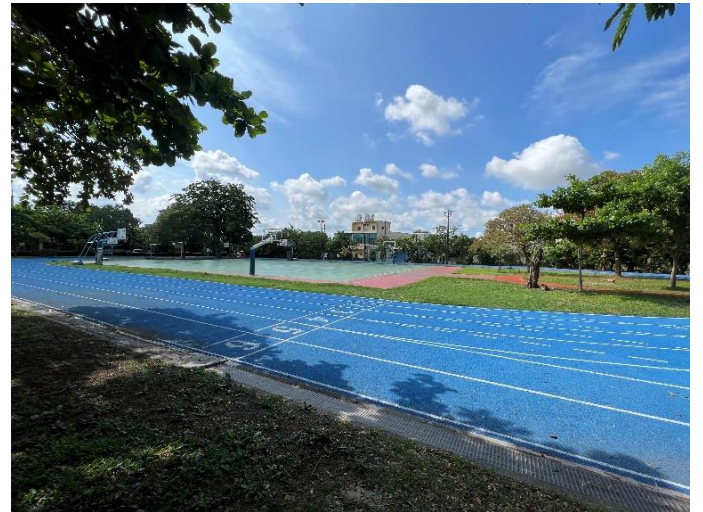
各類運動場-籃球場及操場、學生運動好場所