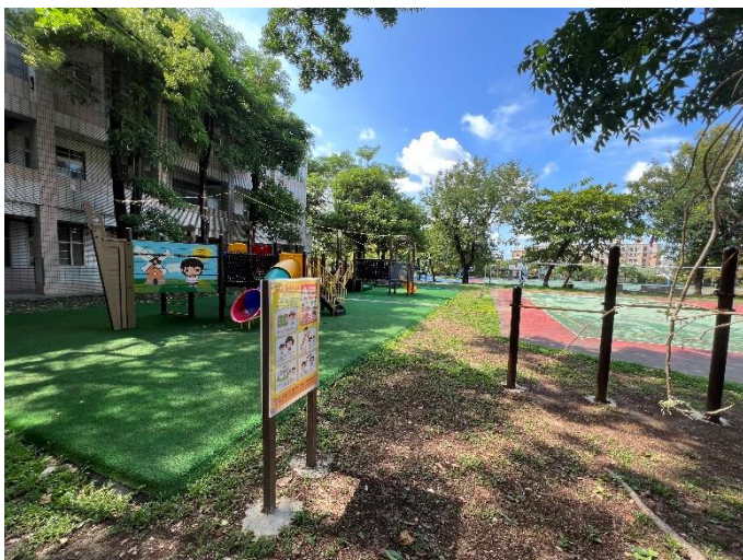
各式遊戲設施、學生下課可做體能訓練