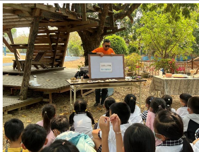
長榮大學辦理食農教育