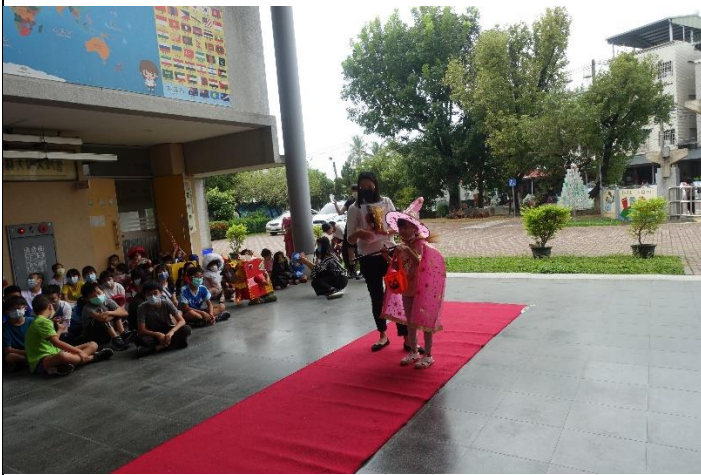
辦理萬聖節化妝走秀活動