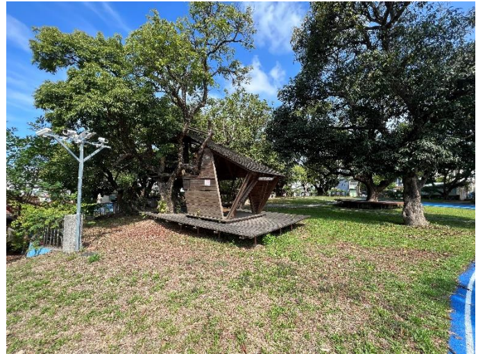
生態公園及水池，學生下課好去處