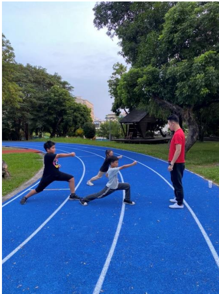
課後才藝班 -武術班