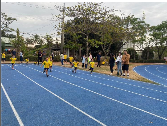
辦理校慶田徑比賽