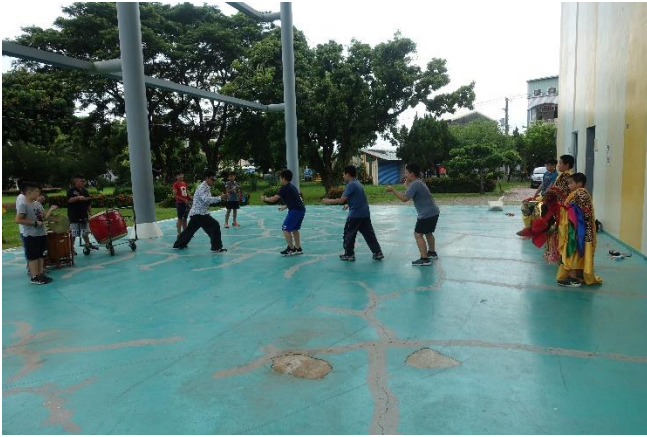
舞獅社團暑期訓練