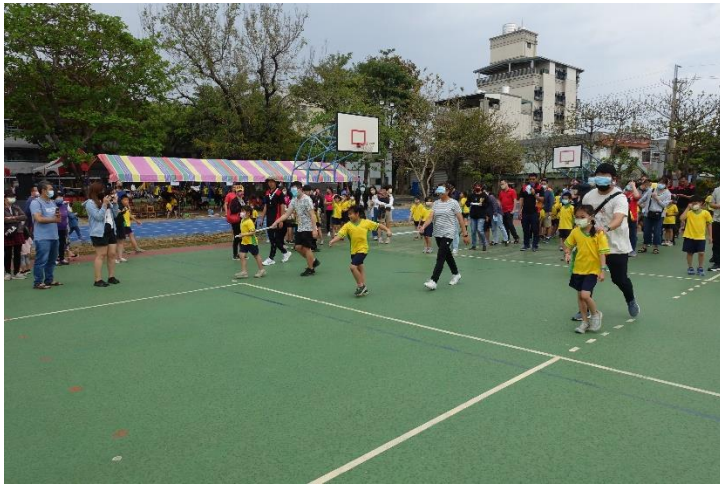
運動會親子趣味競賽