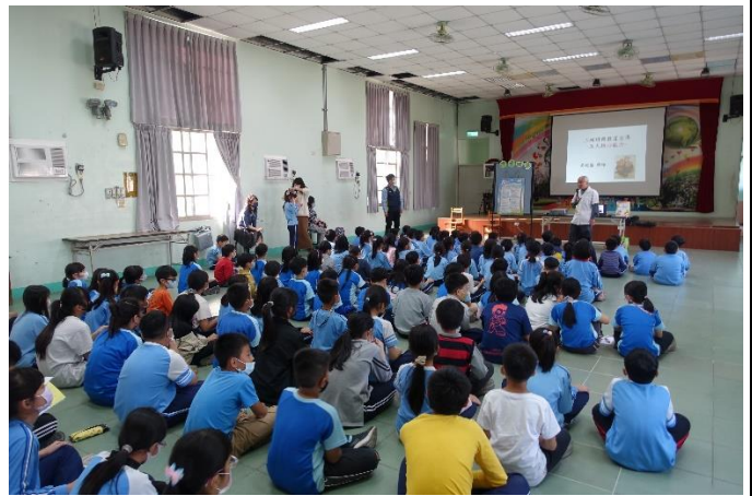
藥師到校宣導正確用藥(全民健保)