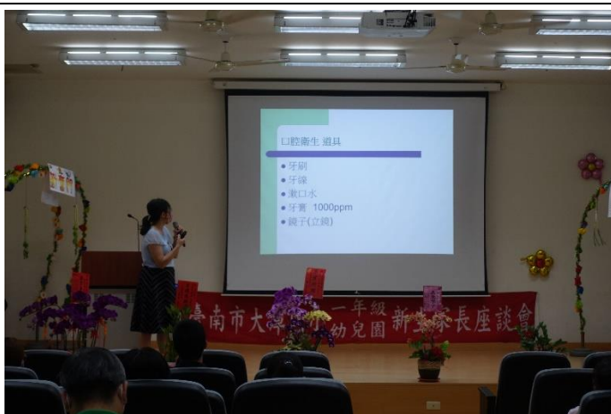
新生家長座談會口腔保健宣導