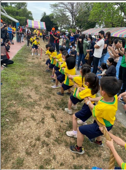
辦理校慶拔河比賽