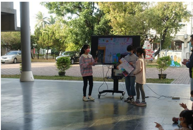
學生朝會報告各種發電方式比較(風力)