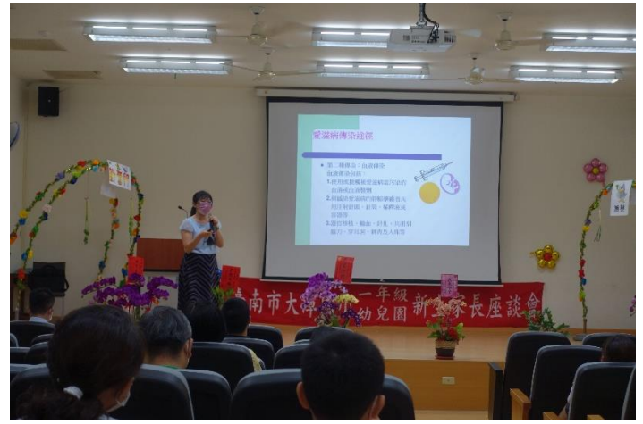
新生家長座談愛滋病宣導