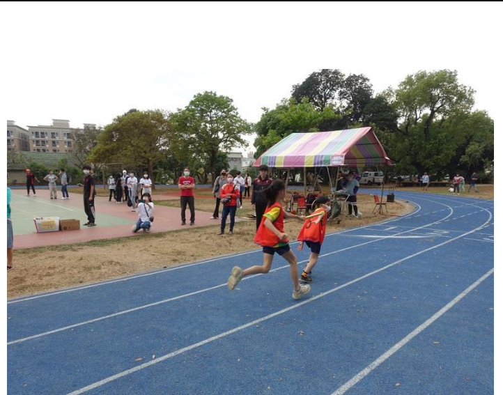
辦理校慶各年級大隊接力比賽