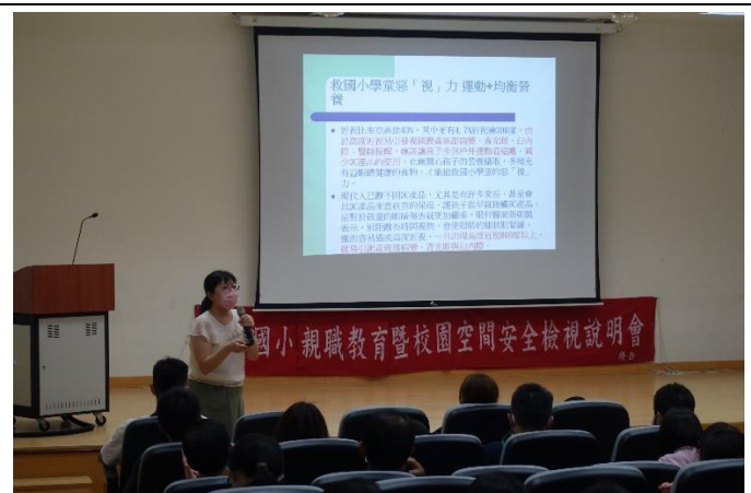
家長座談會視力保健宣導