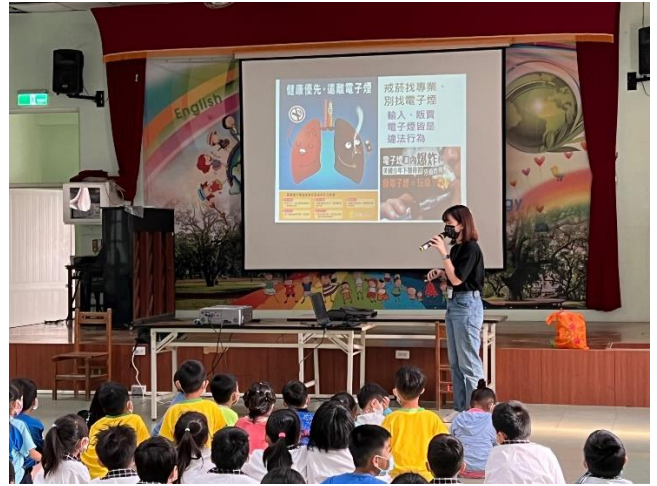
衛生所護理師到校菸害防制宣導