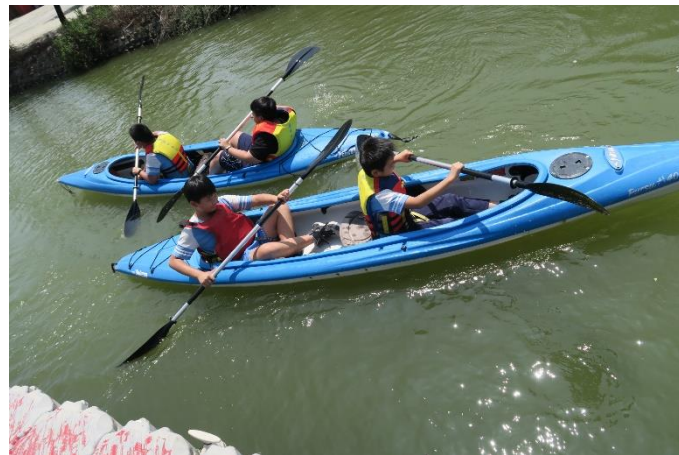
校外教學至光復實小體驗划獨木舟