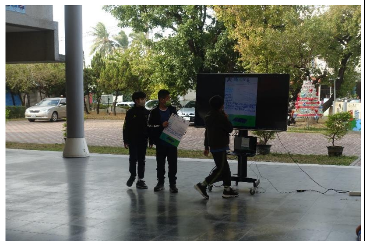
學生朝會報告各種發電方式比較(太陽能)