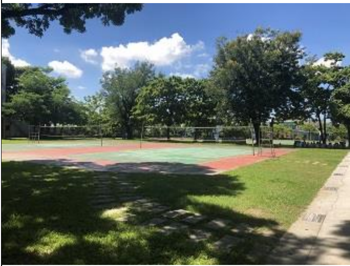
綠意盎然的校園，可舒緩疲勞眼睛