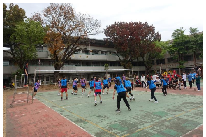
辦理社區議長杯排球比賽