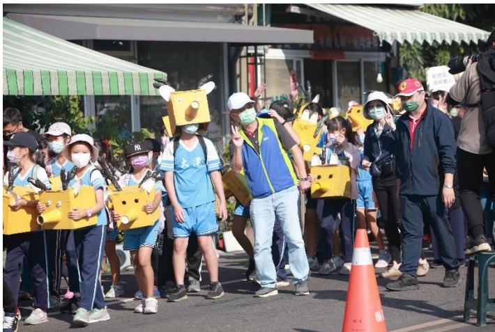
根與芽動物嘉年華遊行活動