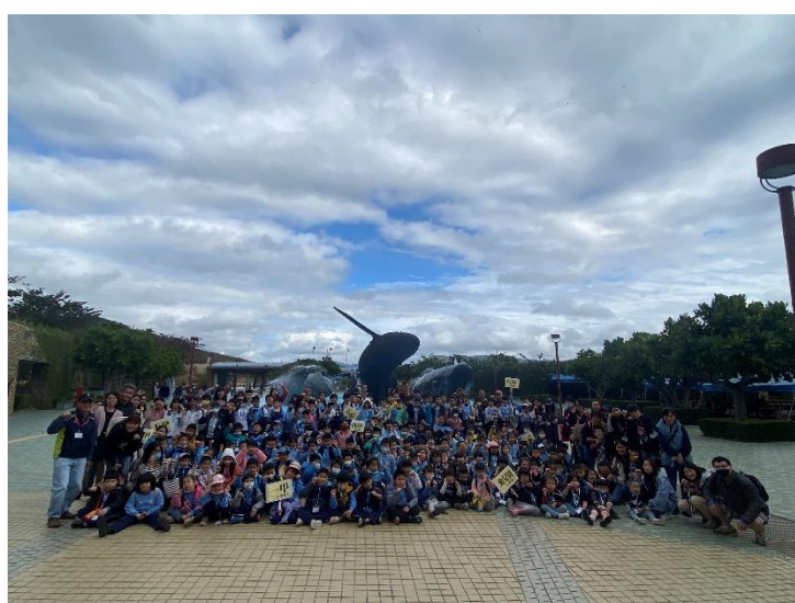
全校海生館一日遊