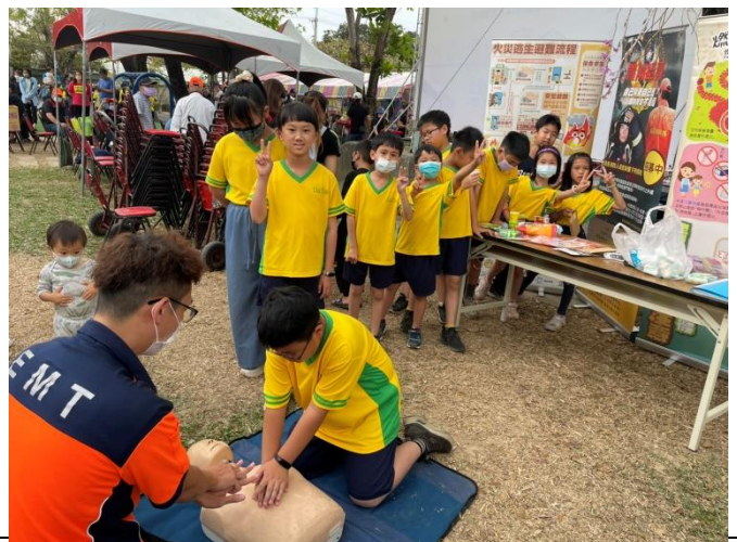
消防隊到校宣導緊急救護演練