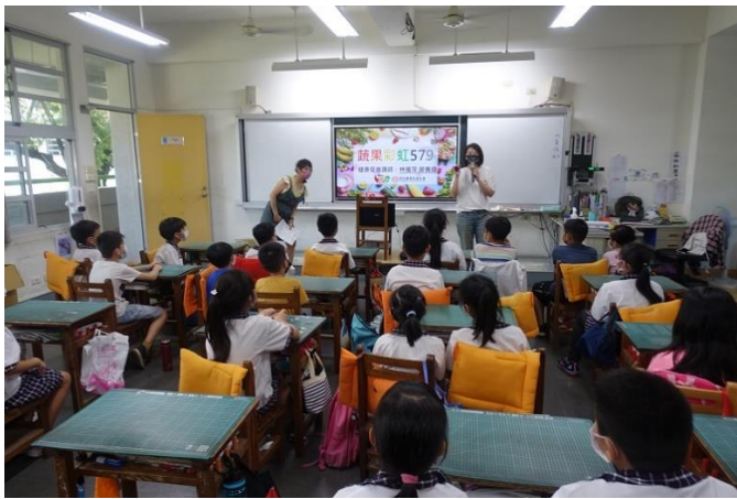
營養師入班宣導飲食教育