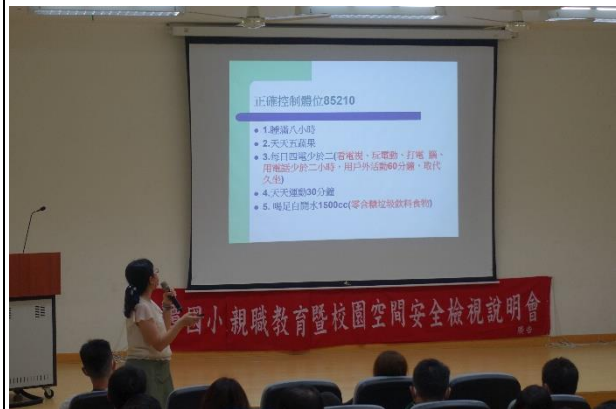
向家長解說正確控制體位85210