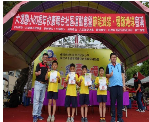
校長頒獎給田徑比賽表現優良學生