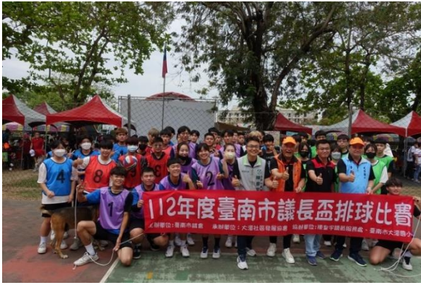
說明：校長帶領下舉辦議長盃排球賽