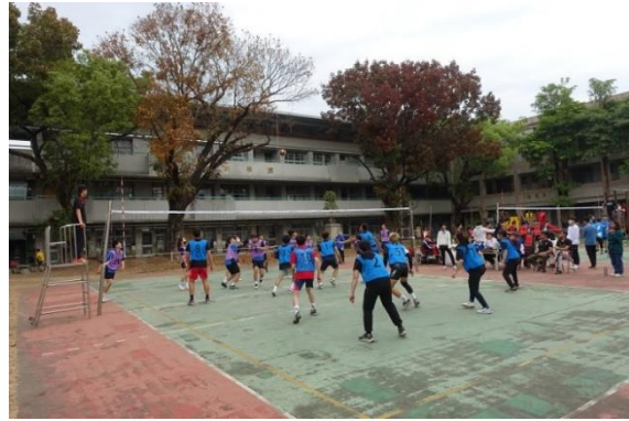
說明：校長帶領下舉辦議長盃排球賽