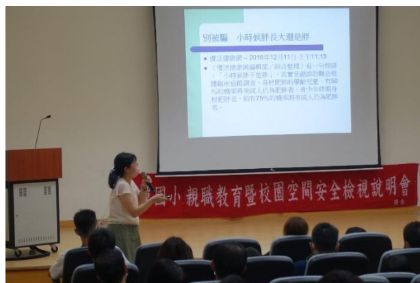
告知小時候胖長大還是胖