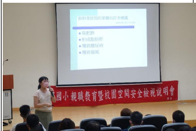
向家長解說喝含糖飲料壞處