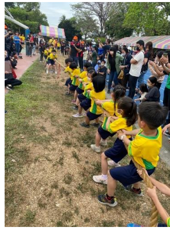
學生拔河比賽、哪班團結力量大