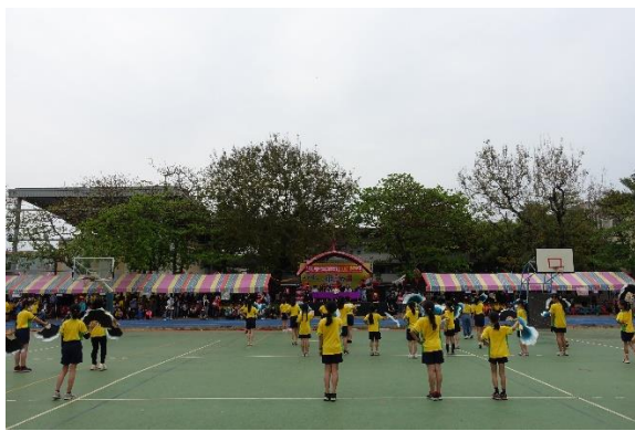
校長與來賓家長一起觀賞學生舞蹈表演