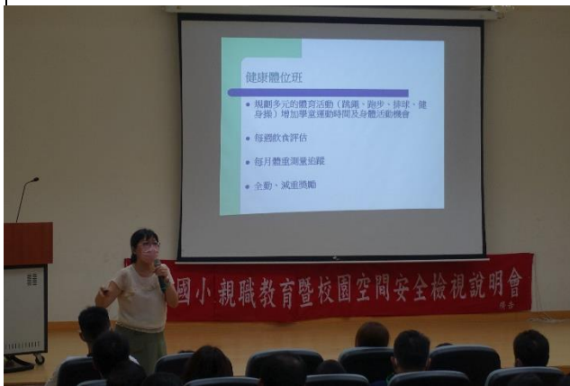
向家長學校成立健康體位班實施目的及內容