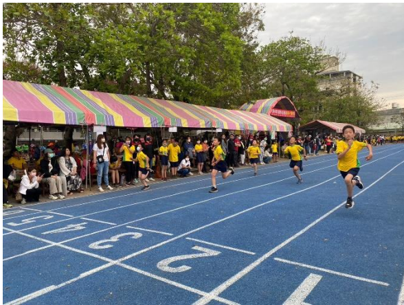
學生一起跑步比賽、看誰跑得快