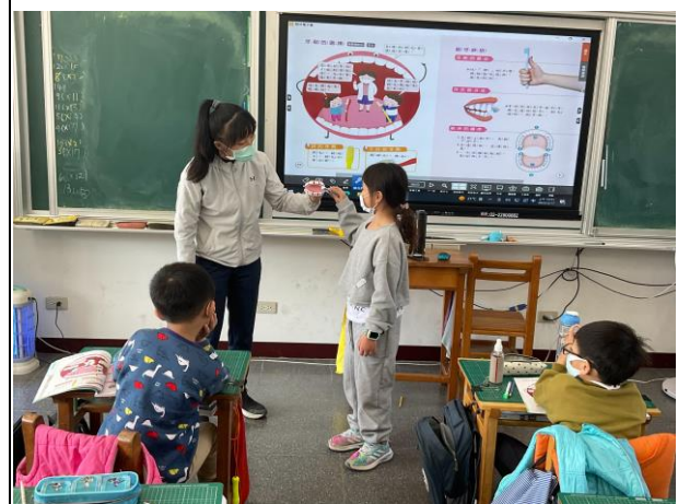
學生藉由牙齒模型來練習正確刷牙方式。