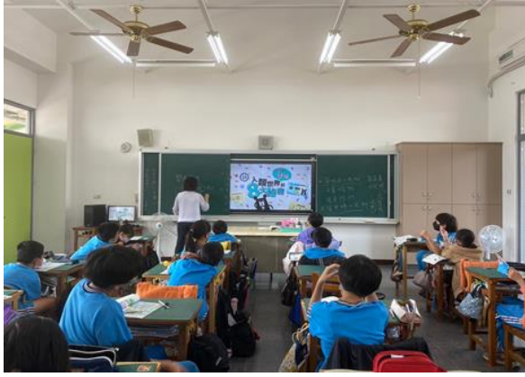
說明：教師講解全民就醫義務。