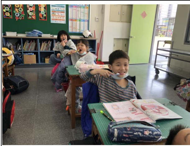
學生養成優良刷牙習慣。