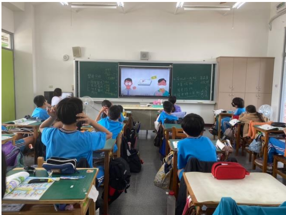
說明：學生學習正確就醫。