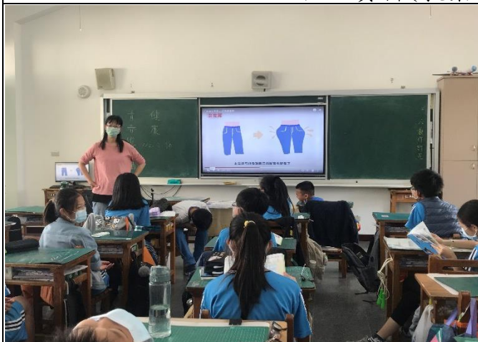
利用影片解說女生在青春期的第二性徵