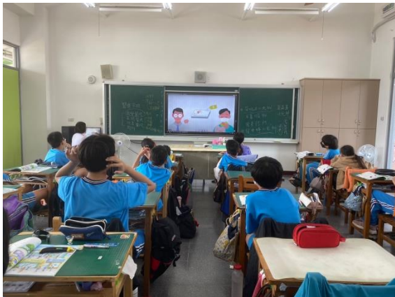
說明：學生了解分級醫療的正確觀念行為。