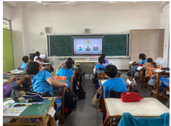
說明：學生學習避免醫療資源浪費。