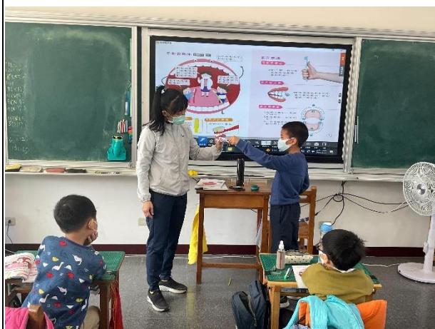
學生藉由牙齒模型來練習正確刷牙方式。