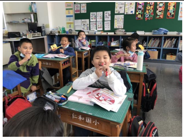
學生養成優良刷牙習慣。