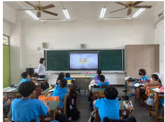
說明：學生了解全民健保的好處。