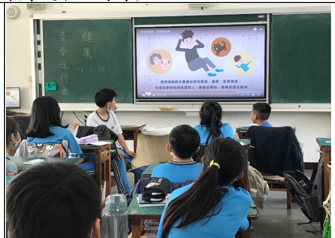
利用影片解說男生在青春期的第二性徵