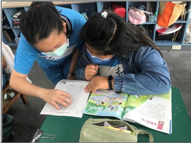
學習單討論與書寫