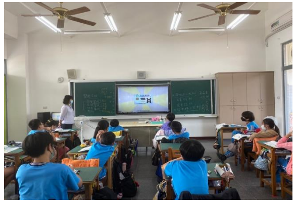
說明：教師說明全民健保的資源。