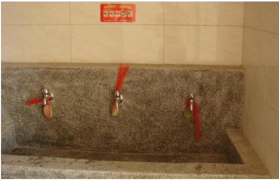
說明：濕搓沖捧擦多洗手防腸病毒等疾病