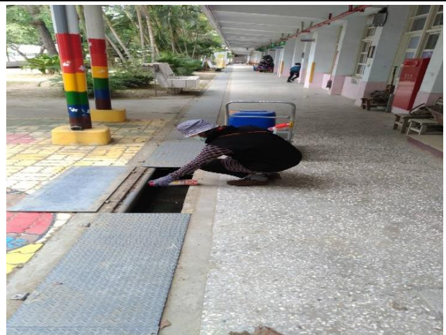
說明：清理水溝，滅蚊子。