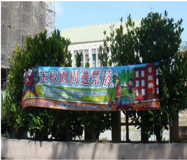
說明：無菸無毒環境營造記錄。