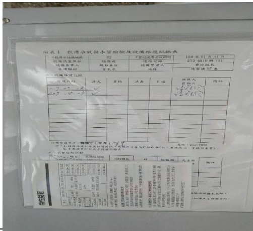
說明：飲水機水質檢驗及設備維護記錄表。