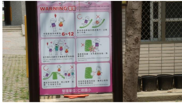
說明：告知遊樂器材正確使用，避免危險。