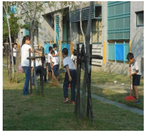
說明：學生參與校園美化綠化工作。