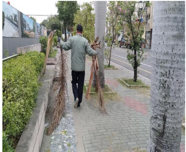
說明：修剪校門口雜枝樹葉。