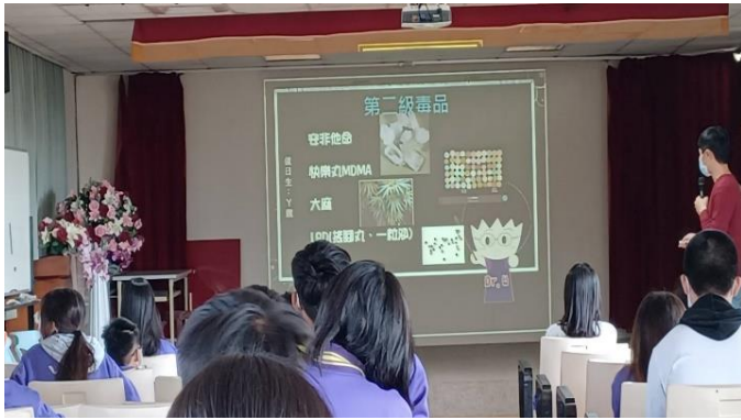
內容：第二級毒品介紹