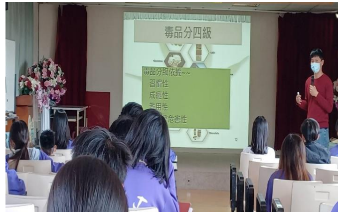
內容：毒品分級介紹