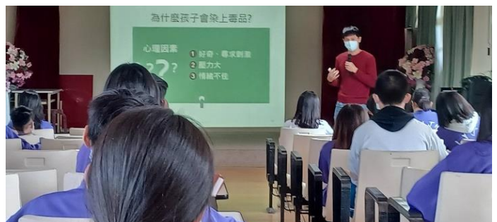
內容：孩子染上毒品的原因