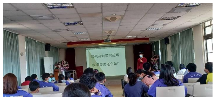
內容：如何拒絕毒品