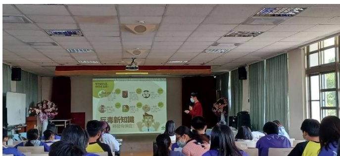
內容：如何拒絕毒品