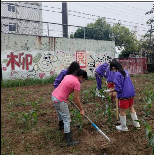
定期清理雜草撿拾石頭，觀察生長情形，