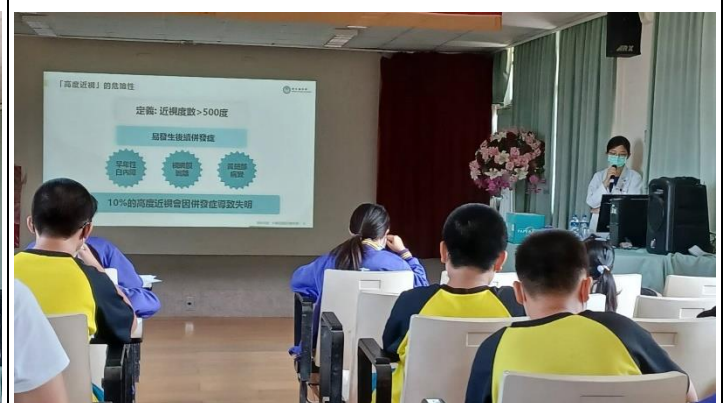
說明：講解近視及重度近視定義