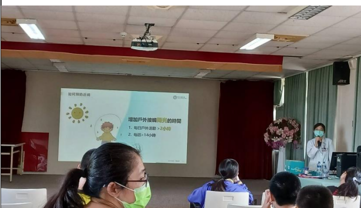
說明：預防近視，每日戶外運動大於2小時