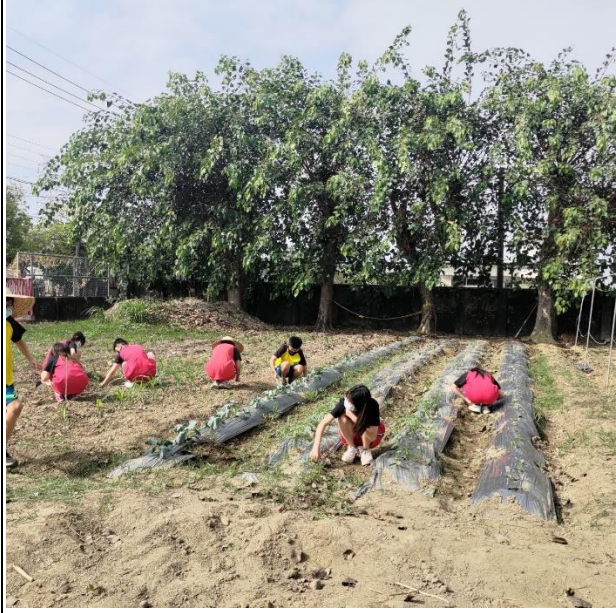
整土作畦整地挖溝