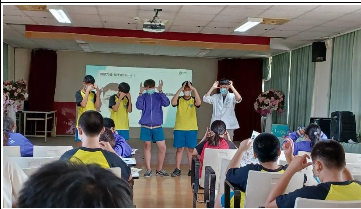
說明：中醫師向學生示範眼睛按摩正確動作