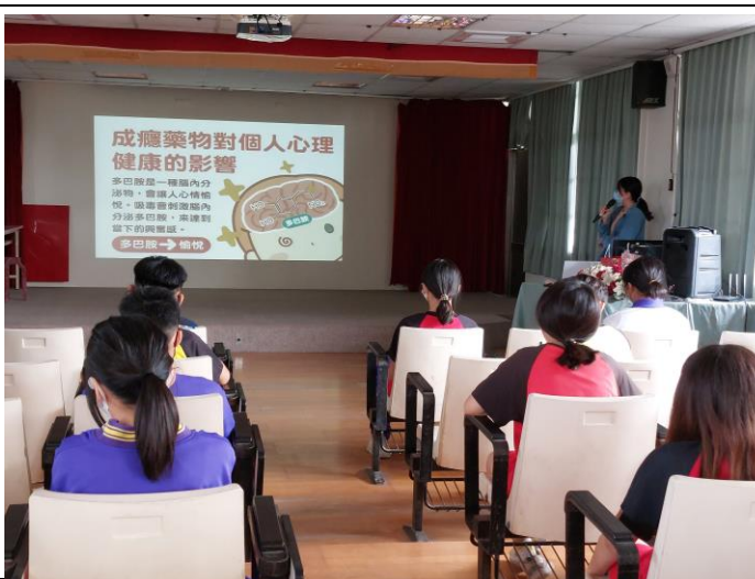
說明：成癮藥物對人體心理健康的影響