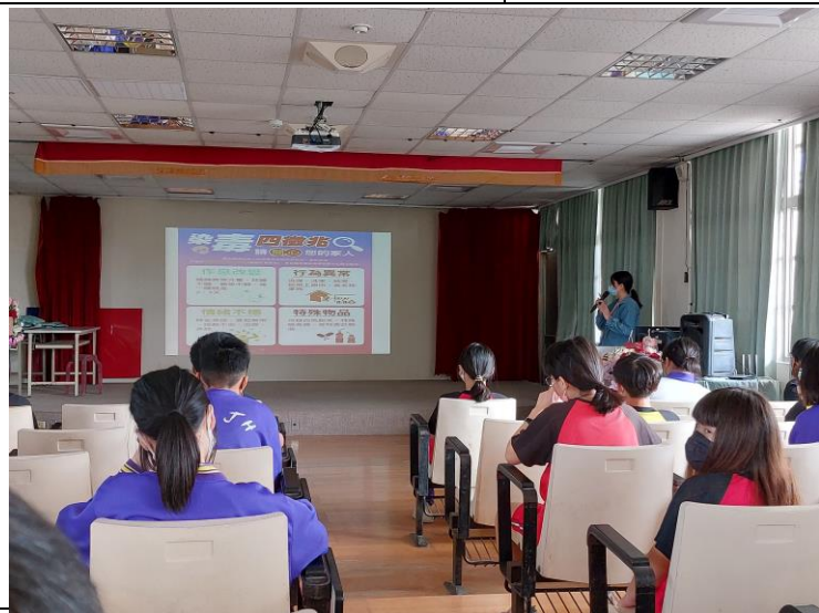
說明：說明染毒的症狀