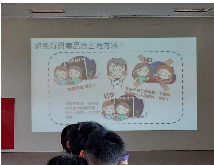
說明：教導避免新興毒品危害方法