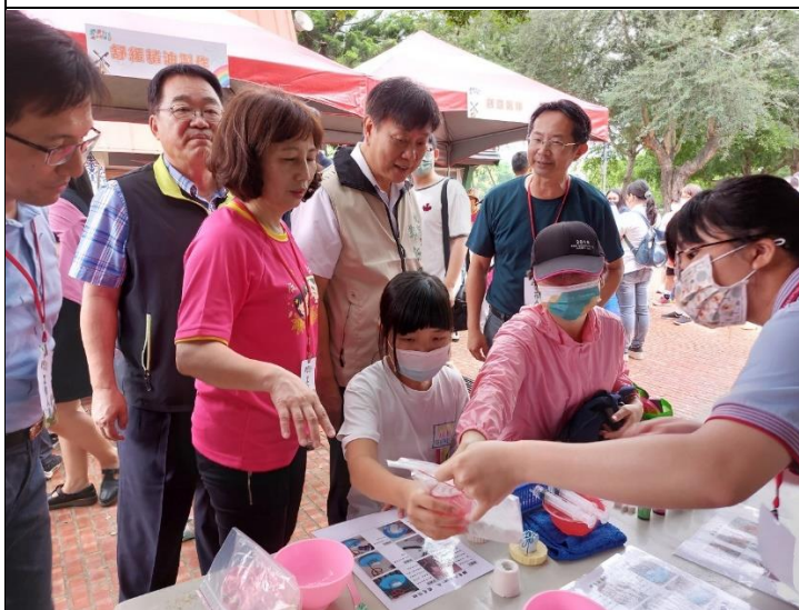
說明：局長與校長參觀本校同仁闖關關卡