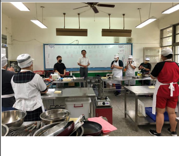
說明：校長說明本項活動的意義