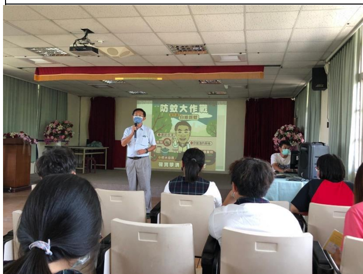
說明：校長宣導防制登革熱方法