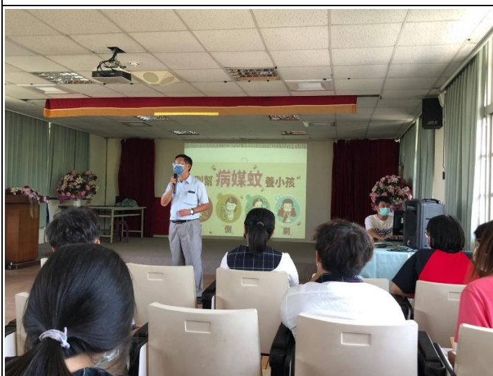
說明：校長宣導清除登革熱病媒蚊巡倒清刷