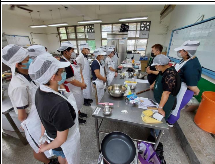
說明：烹飪老師說明課程重點