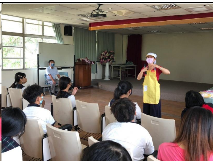
說明：護理師示範穿著打飯菜同學衛生裝備