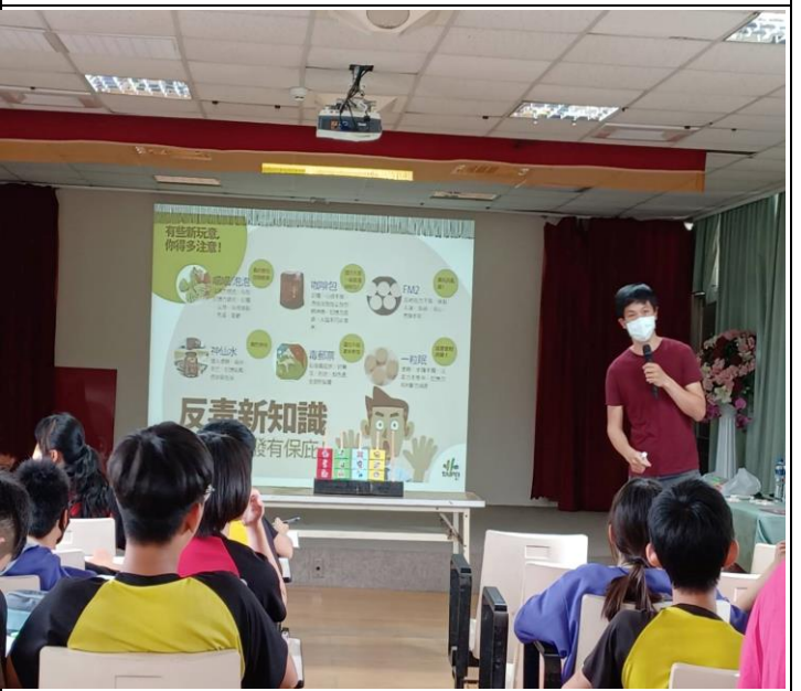
說明：校藥師介紹戒毒專線