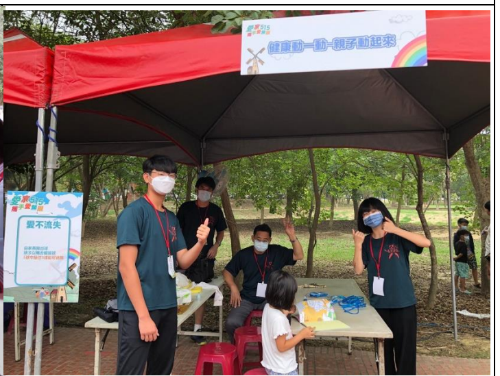
說明：本校同仁擔任健康動一動親子動起來關卡