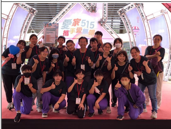
說明：校長帶領師生擔任活動志工