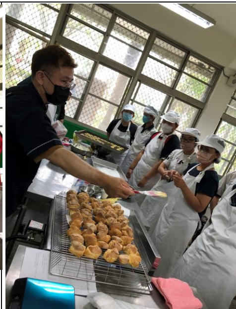
說明：親子一起完成的美食