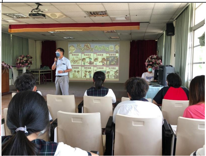
說明：校長宣導拒毒方法