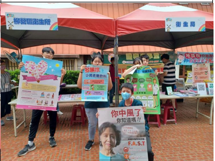
說明：本校志工同學擔任健康促進宣導大使