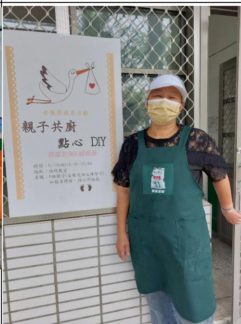
說明：家長熱衷參與本項活動